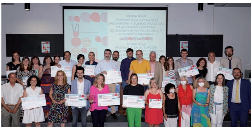
▲ Todos los premiados, junto a las autoridades municipales.

El Ayuntamiento, concretamente la Delegación de Educación, ha premiado 19 proyectos de innovación educativa y buenas prácticas. Con estos premios el Consistorio continúa reconociendo la gran labor y el esfuerzo de los centros educativos de la localidad, además de promover la innovación y el intercambio de experiencias.