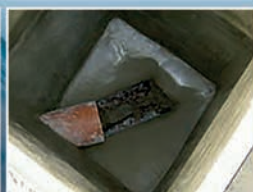
ANTES / DESPUÉS