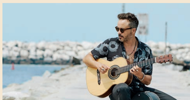
▲ El 23 de julio actuará el Twanguero en la Plaza de la Constitución.

Y, cómo no, especial atención a las funciones de Titirisanse de lunes a sábado a las 20.00 h. El Hada de los Dientes y La Ratoncita Mágica estarán en distintos emplazamientos de la ciudad. Todas las actividades culturales son gratuitas. ■