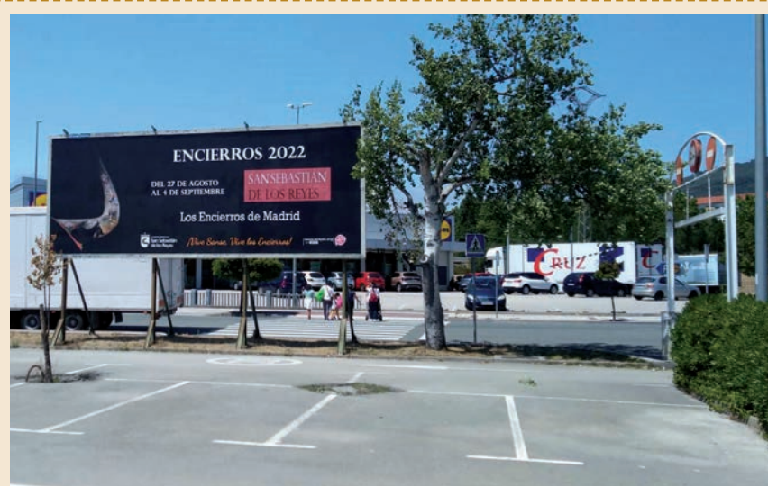
▲ El Ayuntamiento lanza una campaña de promoción de los encierros de Sanse en Pamplona durante los sanfermines, en redes sociales y en el mobiliario urbano de diversas ciudades españolas. Se mantendrá viva hasta el día 4 de septiembre, con vallas promocionales, anuncios en el principal buscador de internet, así como en el mobiliario urbano digital de algunas capitales de España.

Los participantes recibieron el correspondiente certificado por parte de la Academia de Formación Permanente de la Policía Municipal de Pamplona. ■