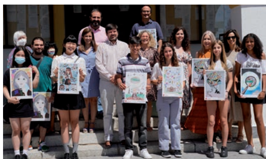
▲ Los premiados con sus dibujos.

La entrega de los premios del Concurso se celebró el pasado 28 de junio en el salón de