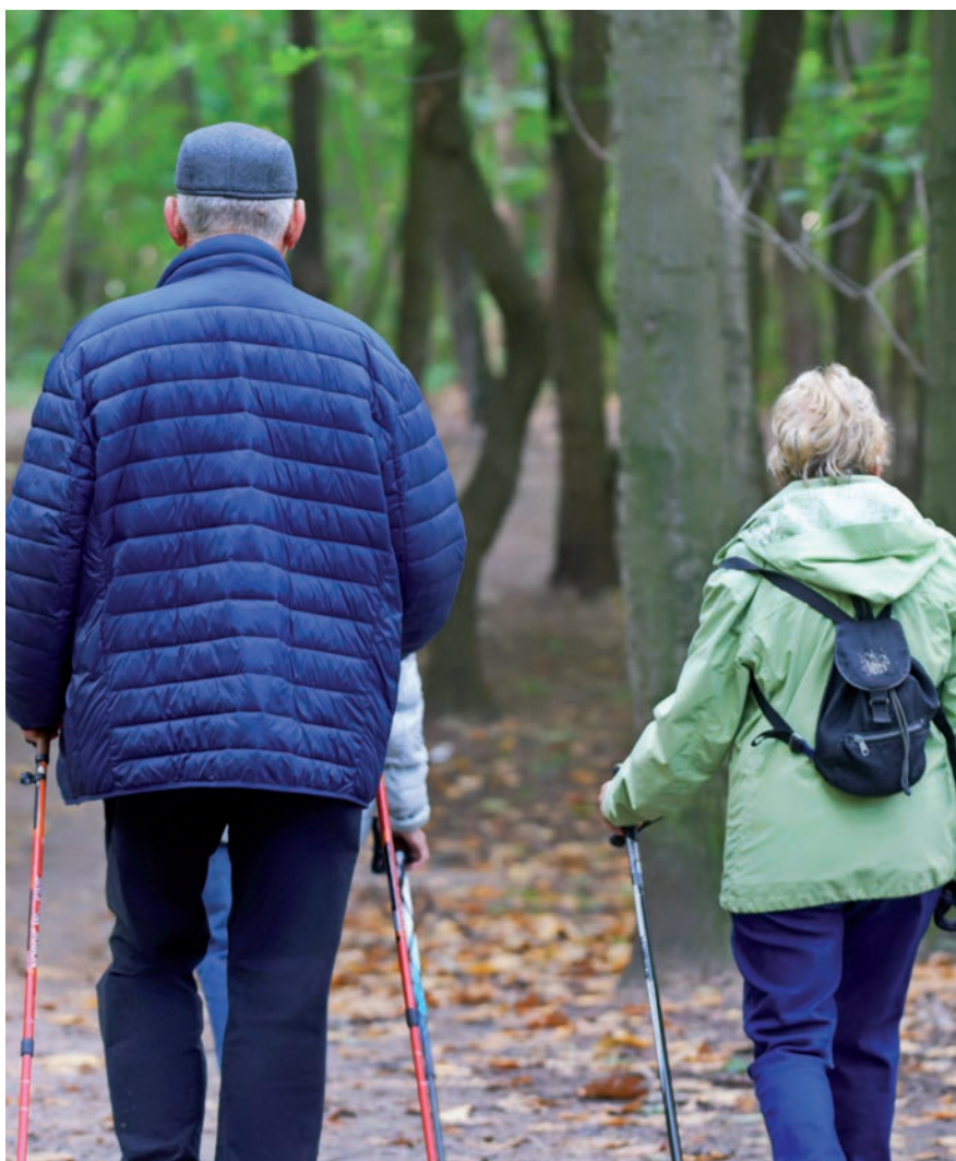
▲ La programación de actividades recoge la oferta de años anteriores, pero destaca el incremento las de actividades físicas, entre otras.

El Ayuntamiento, más concretamente la Concejalía de Personas Mayores, Envejecimiento Activo y Calidad de Vida, oferta un conjunto de servicios, programas y actividades para el curso 2022/2023 que dan respuesta a la creciente demanda y los diferentes intereses y necesidades de las personas mayores a partir de los 60 años. En San Sebastián de los Reyes la población mayor de 60 años representa el 20,8% del total (19.114 personas).