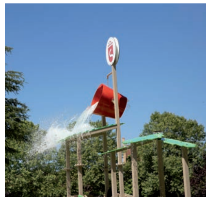
▲ Un verano pasado por agua y deporte, en Sanse.

ponden a plazas subvencionadas por el Ayuntamiento, a las que se suman las plazas para personas discapacitadas y aquellas de inclusión social que gestionan los Servicios Sociales del municipio. Toda la organización está orientada a garantizar que las familias más des-