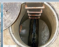
ANTES / DESPUÉS