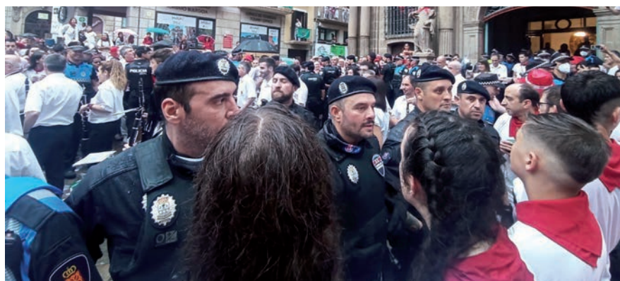
▲ Policía Local de Sanse durante los sanfermines, en la parte práctica de las jornadas.

Desde la Delegación de Festejos se manifiesta que “este año va a ser muy importan-