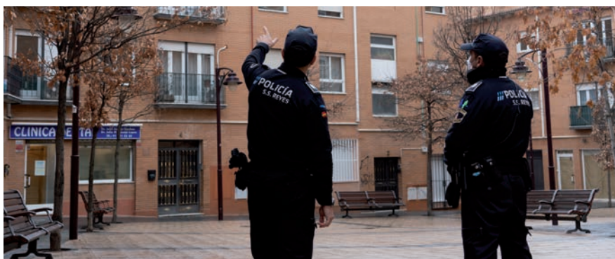
▲ Los efectivos de la Policía Local velarán para que no hay sorpresas en las viviendas y comercios durante las vacaciones.

La Concejalía de Seguridad Ciudadana ha desarrollado el Plan Vacaciones Seguras, que se mantiene operativo hasta el 30 de septiembre. Su fin es prevenir robos o cualquier hecho fortuito que pueda afectar a las viviendas y comercios cuyos propietarios se ausenten con motivo de las vacaciones estivales y queden desocupadas durante los meses de julio a septiembre, así como establecer medidas especiales en lugares de pública concurrencia y en aquellas actividades que se producen en la época estival.