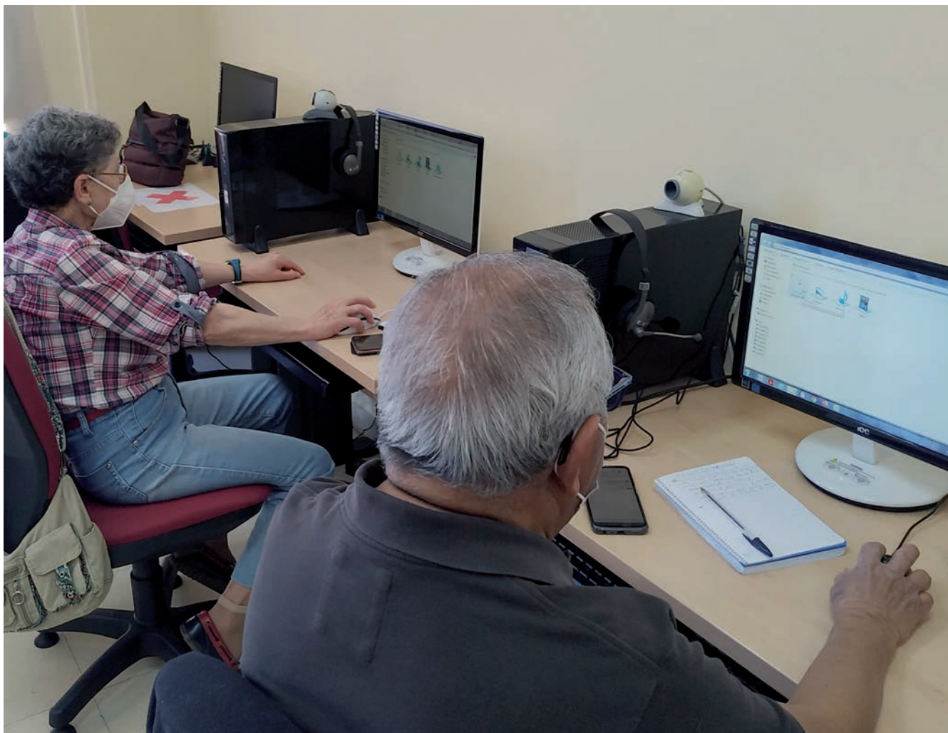
▲ Se han ampliado las plazas de ofimática, internet y aplicaciones móviles de 144 a 200 plazas.

ge la oferta de años anteriores, pero destaca el incremento en las áreas de nuevas tecnologías, estimulación cognitiva y actividades físicas, cuya demanda se ha incrementado de manera muy significativa desde la pandemia.