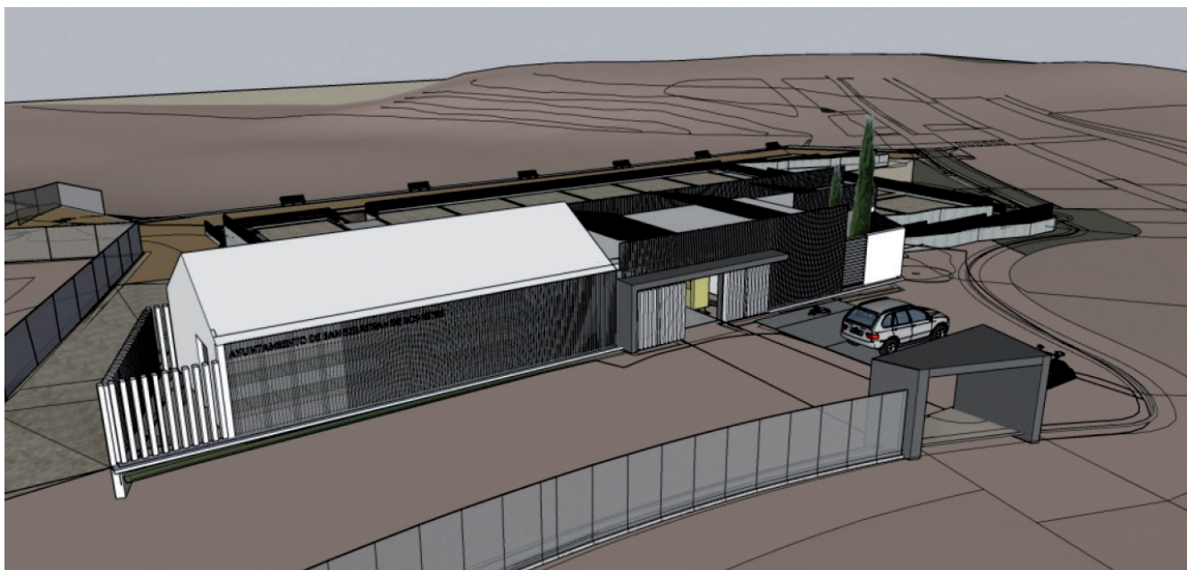
▲ La instalación tiene prevista un edificio de servicio que contendrá un área de almacén con 48 jaulas para material de los usuarios, invernadero de semillas y oficina de gestión.

La Junta de Gobierno Local del Ayuntamiento ha aprobado el proyecto de construcción para acoger los nuevos huertos urbanos que estarán ubicados en la Avenida de Navarra. Esta nueva actuación de la Concejalía de Medio Ambiente contempla que el proyecto, que ocupará un espacio de 7.400 m 2 , contará con 48 huertos que podrán ser utilizados para el cultivo de productos por parte de vecinos y asociaciones del municipio.