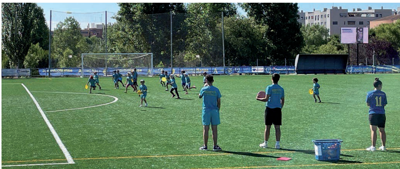
▲ 17 clubes de nuestra ciudad, representados por la Asociación de Clubes de Sanse Sebastián de los Reyes (ACSSReyes), participan en los Pre-Campus y en los Campus.

Bajo el eslogan "Un verano para todos" ningún niño de San Sebastián de los Reyes se quedará sin los Campus de