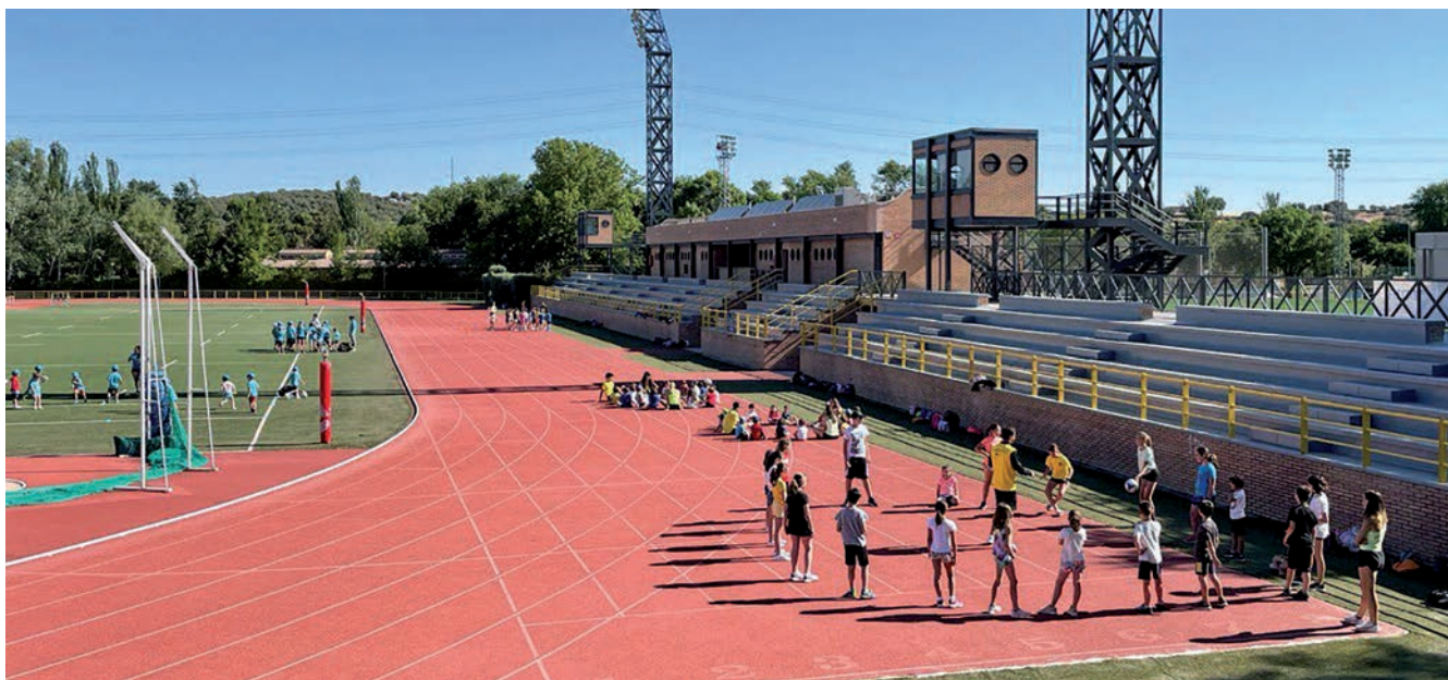
▲ Más de 1.000 niños, con ganas de disfrutar, llegaron a las 15 instalaciones deportivas del municipio, el día 27 de junio.

La antesala de los Campus de Verano más grandes de España se inició con una semana llena de deporte y diversión para todos los jóvenes de Sanse. Los Campus deportivos ayudarán a facilitar la conciliación familiar y la integración social con 17 clubes que comienzan este servicio deportivo que reunirá a más de 7.000 participantes durante todo el verano.