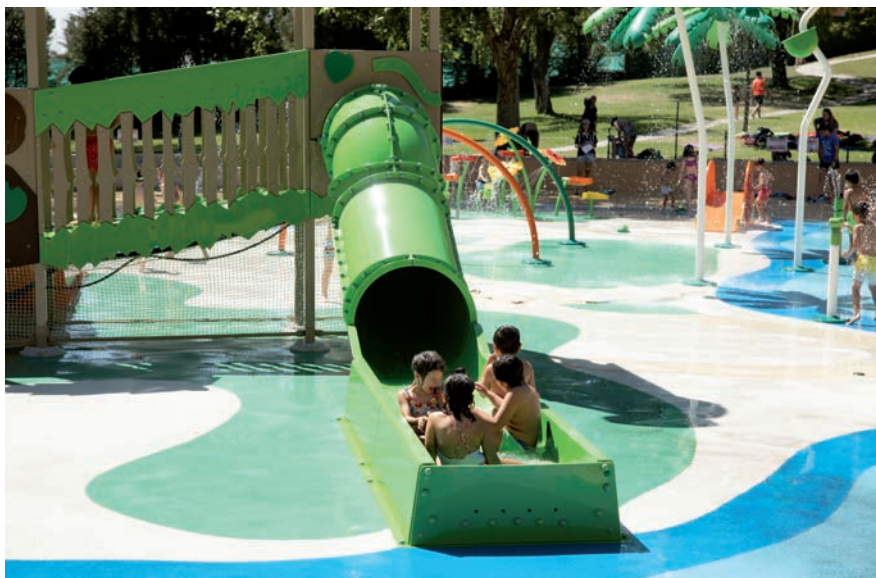
▲ Una de las grandes protagonistas del verano es el agua y las diferentes atracciones acuáticas.

Verano y que se cumpla así el objetivo real de facilitar la conciliación familiar.