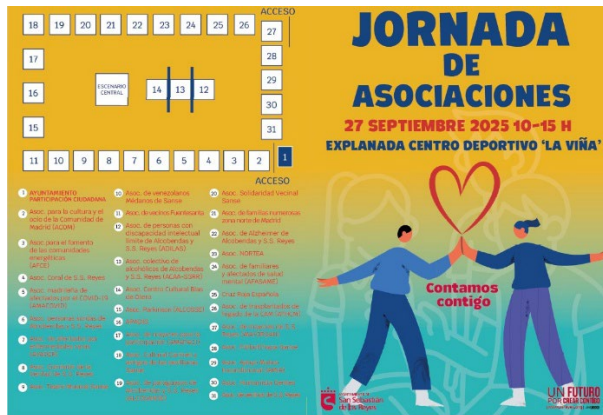
JORNADA DE ASOCIACIONES DE PARTICIPACIÓN CIUDADANA