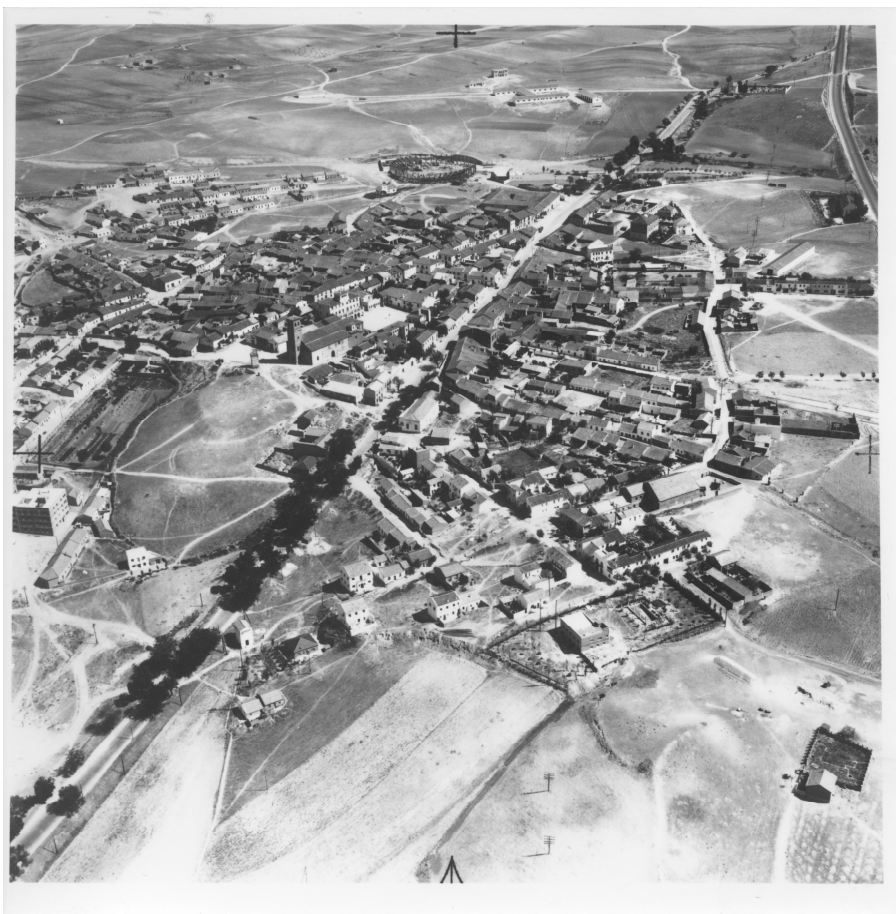
Imagen aérea de Sanse en 1961