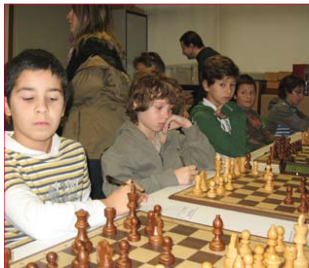
VIII Festival Infantil de Ajedrez