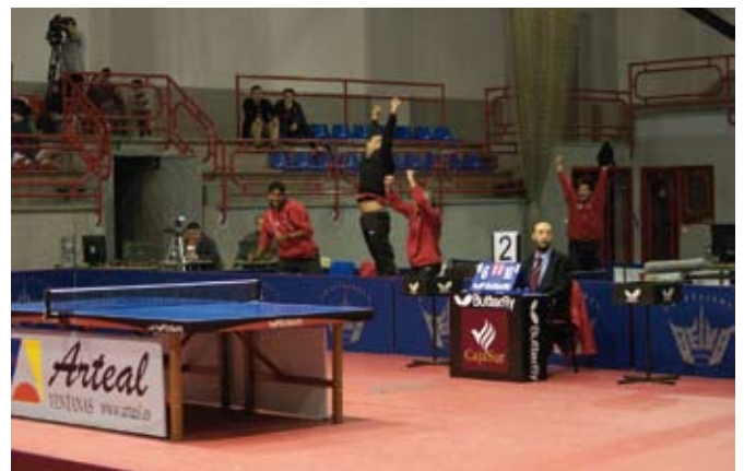
El júbilo estalló en el equipo sansero después del último punto.