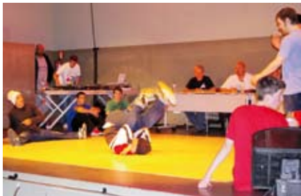
Actuación de uno de los participantes en el concurso de Break-Dance.

Los jóvenes de San Sebastián de los Reyes que participaron en el I Concurso de Cultura Urbana de la Red Joven Norte, celebrado el segundo fin de semana de mayo, dominaron en todas las pruebas salvo en la de Basket 3x3, en la que el equipo local quedó segundo.