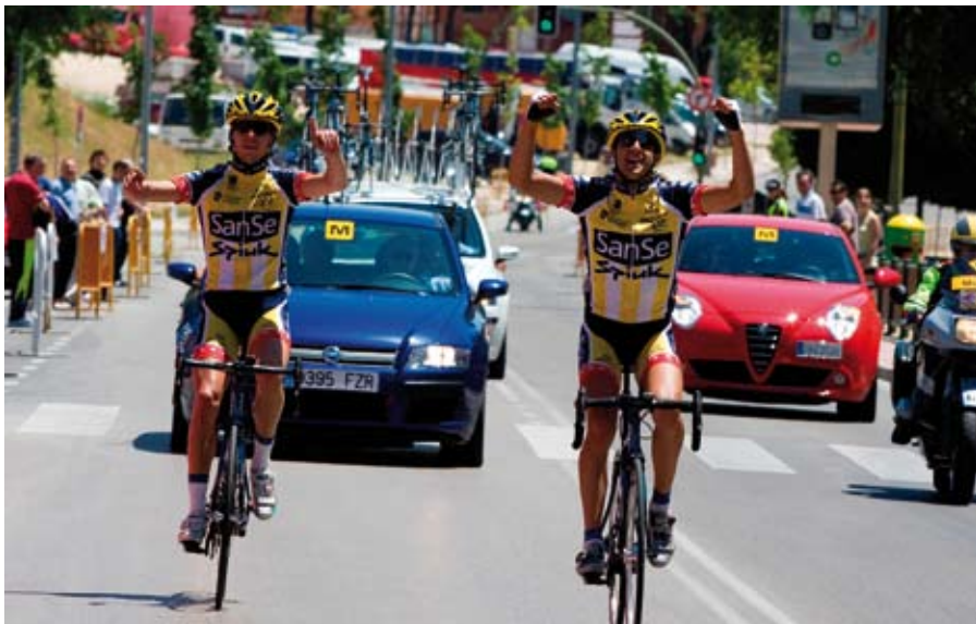
El día 12 se han organizado varias carreras con las que podrá disfrutar el público, además de una Marcha Cicloturista que está abierta a todo aquel que quiera participar.

San Sebastián de los Reyes se monta en bici el fin de semana del 12 y 13 de junio a través de diversas pruebas que tienen un denominador común: seguir fomentando este noble deporte entre los vecinos. No puedes faltar.