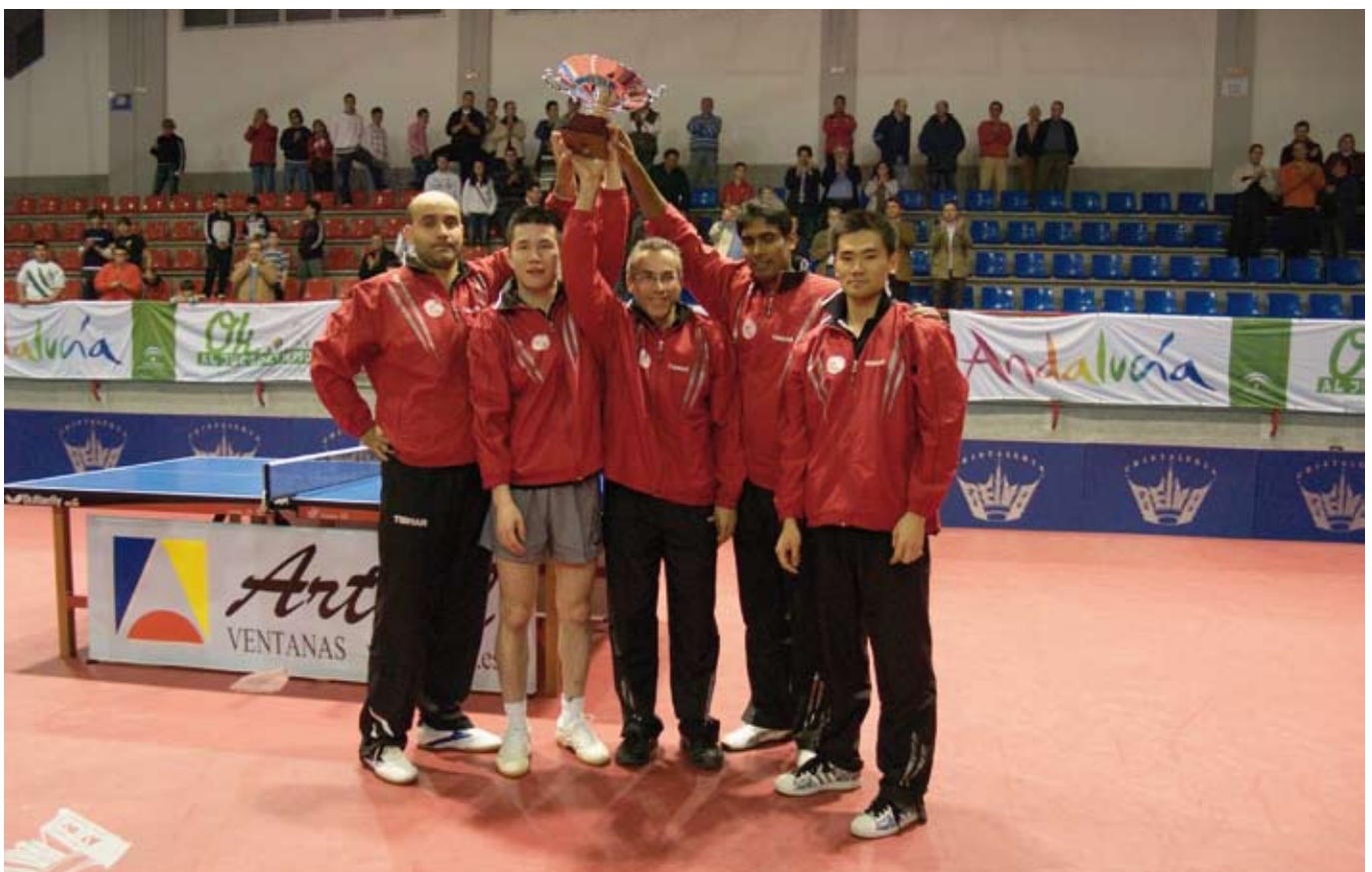
Los jugadores del equipo de Sanse levantan la copa de la Liga. Un triunfo para la historia.

Sanse pasa a formar parte de la leyenda con todos los honores después de imponerse contra todo pronóstico en la final al gran favorito, CajaSur Priego, en su casa y con un inapelable resultado final de 3-0. Ésta es la crónica de la hazaña.