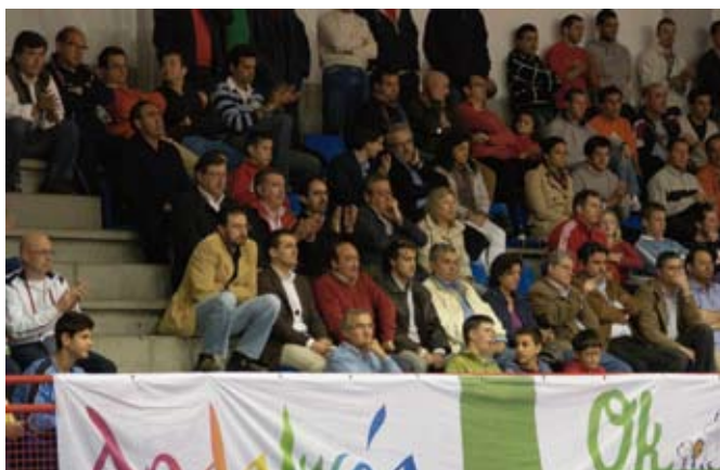
El público abarrotó las gradas para animar al Córdoba, pero tampoco la animación en contra pudo con el Sanse.