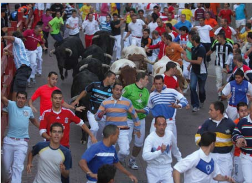
Entre los corredores de San Sebastián de los Reyes se cuentan los mejores de España.