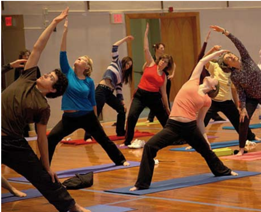
Con estas actividades se pretende facilitar el aprendizaje de técnicas sencillas para mejorar la salud.

El Ayuntamiento, a través de la Concejalía de Igualdad, organiza de nuevo unos talleres dirigidos tanto a hombres como a mujeres para favorecer la salud integral dado el gran interés que el curso ha suscitado.