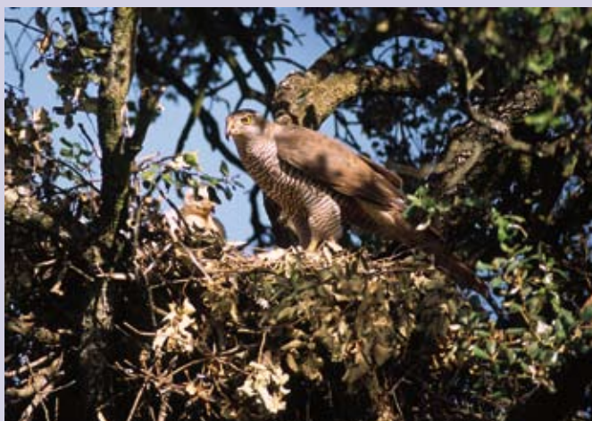
Esta muestra ofrece 60 espectaculares imágenes de fauna y flora autóctona.

Con motivo de la celebración del Día Mundial del Medio Ambiente, la asociación ecologista GEDEI inaugura el próximo 2 de junio una exposición fotográfica y una proyección de Juan Armendáriz con el título 'Las dehesas de Madrid', en la Biblioteca Central, Plaza de Andrés Caballero, 2.