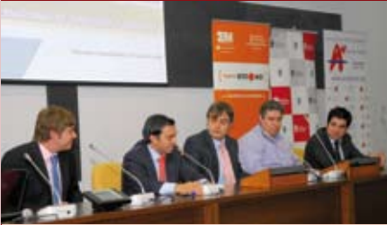
Ponentes de la II Jornada de Internet del Futuro, organizada por el Ayuntamiento y Acenoma.

Acenoma y el Ayuntamiento, a través de la Concejalía de Desarrollo Local, han organizado una jornada de Networking activo, enmarcada dentro del Programa Pyme Innova de la Comunidad de Madrid. En el acto, que ha tenido lugar en el Centro de Formación Ocupacional, también han colaborado el Instituto Madrileño de Desarrollo IMADE, la Cámara de Comercio y Cenor.