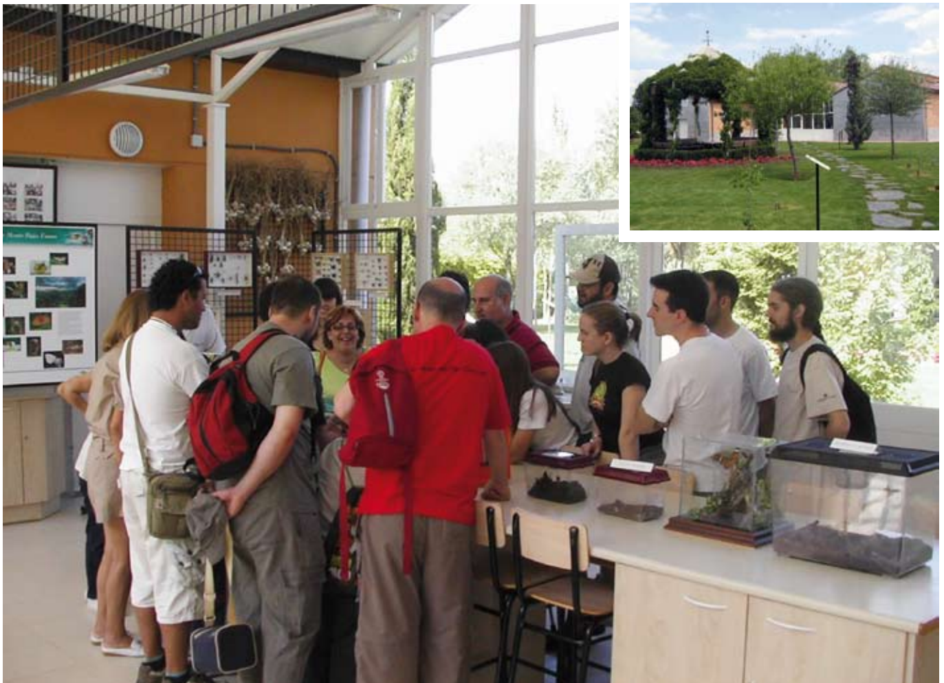
La realización de las Jornadas Monográficas para adultos y familias buscan que el Centro sea conocido y disfrutado por el mayor número de ciudadanos.

Es el centro escolar el encargado de elegir las actividades que van a realizar los chavales, en base a la documentación que cada año reciben en el mes de septiembre. Dicha documentación