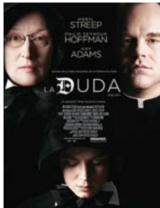
Cine para los jóvenes con este drama con intriga, el día 11 a las 20.00 h.

Cine Juvenil INDIANA JONES Y LA CALAVERA DE CRISTAL Dir. Steven Spielberg, EEUU, 2008, 117 min Todos los públicos