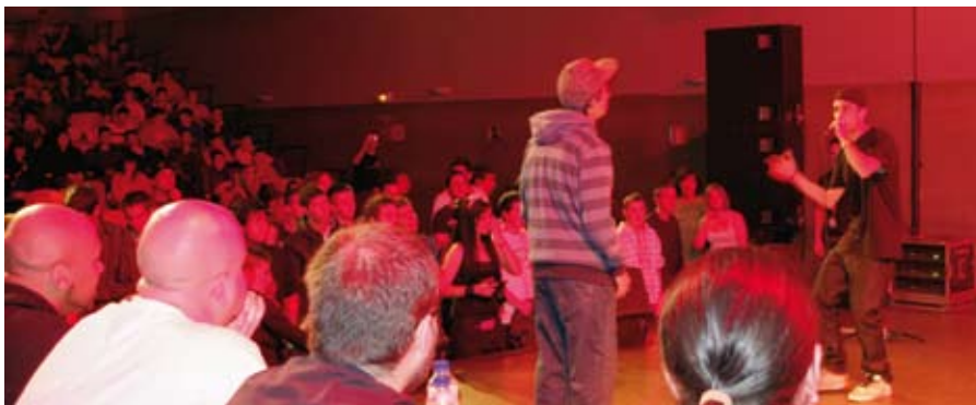
A la "Batalla de MCs" se presentaron 14 concursantes de los municipios de la Red Joven Norte.

Para la realización de estos talleres el Ayuntamiento cuenta con una subvención de la Consejería de Empleo y Mujer de la Comunidad de Madrid. ●●●