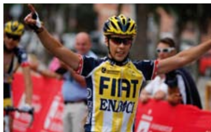
Nuestra ciudad vuelve a homenajear a uno de sus deportes con más tradición, el ciclismo.

Kilometraje previsto 137,9 km, hora prevista final de carrera 13,37 hrs. Inscripciones a través Federación Madrileña de Ciclismo. ●●●