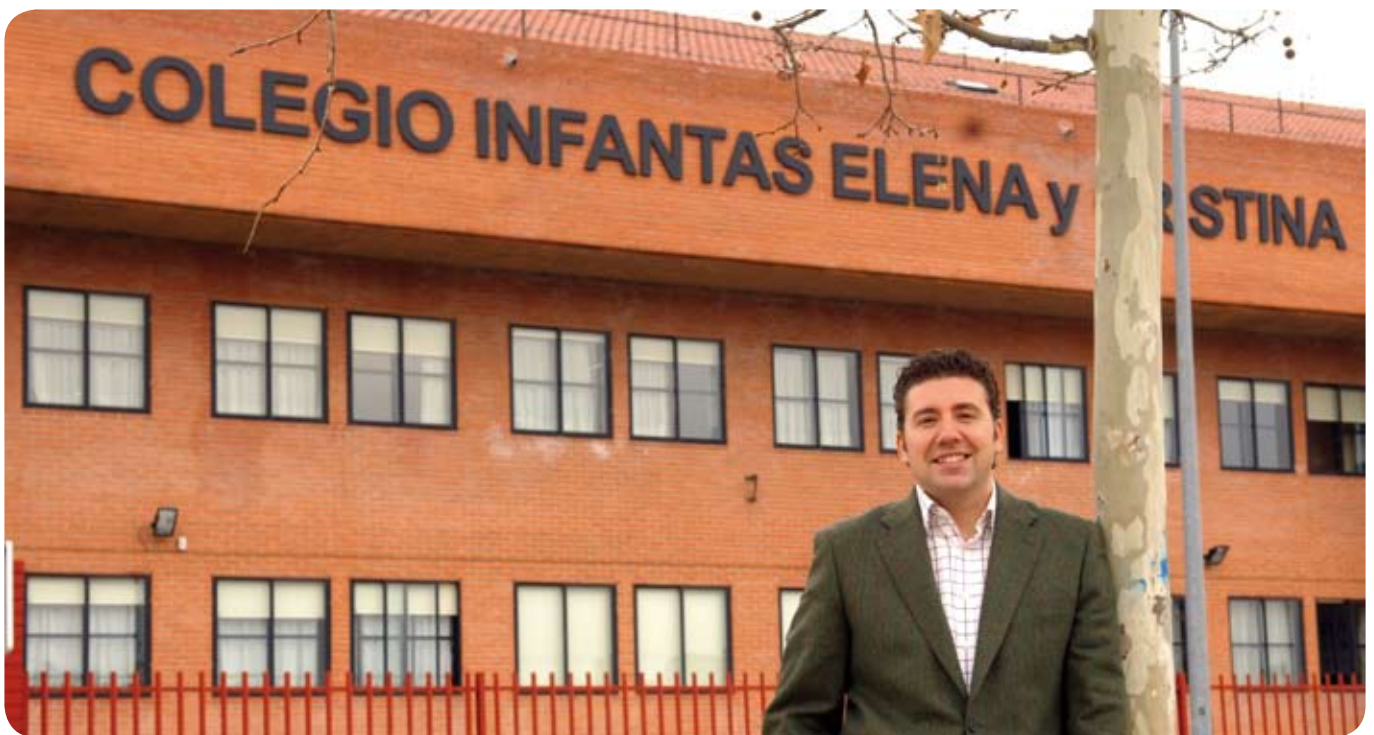
Tal como subraya el concejal de Obras, uno de los proyectos fundamentales es el nuevo pabellón polideportivo del colegio público “Infantas Elena y Cristina”, que incluirá una pista para la práctica de baloncesto y balonmano, y vestuarios, almacenes y aseos. Hay presupuestada una partida de 1.259.441 euros.

La Junta de Gobierno Local ha aprobado recientemente los nueve proyectos que promoverá el Ayuntamiento con el Fondo Estatal para el Empleo y la Sostenibilidad. Los proyectos suman 7.828.486 euros, de los cuales 6.259.651 se destinarán a Inversiones y el 15% restante –1.568.835–, a Gasto Social.