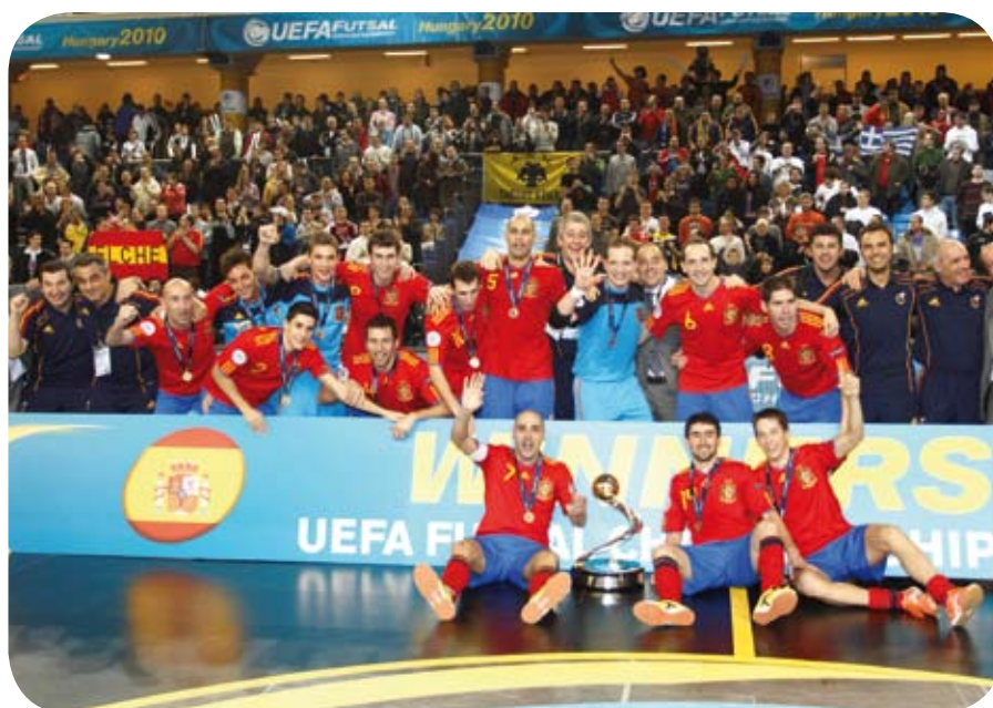
La Selección Española de Fútbol sala celebrando el título tras el partido