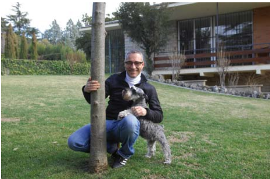
El periodista madrileño con "Alba", una cariñosa schnauzer que también ejerció de perfecta anfitriona.

No tanto. Me gusta la decoración, con cierto modesto afán coleccionista y la pintura. Lo que pasa es que para la pintura hay que meterte a tope. La verdad es que lo tengo un poco abandonado pero supongo que volveré a ello. Y la lectura. ●●●