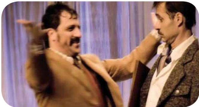
"No puede ser el guardar a una mujer", el sábado 20 en el TAM a las 20.00 h.

TAM Ciclo de Teatro Clásico No puede ser el guardar a una mujer Cía: Apata Teatro Día 20 de febrero de 2010 Hora: 20,00. Precio: 15 €