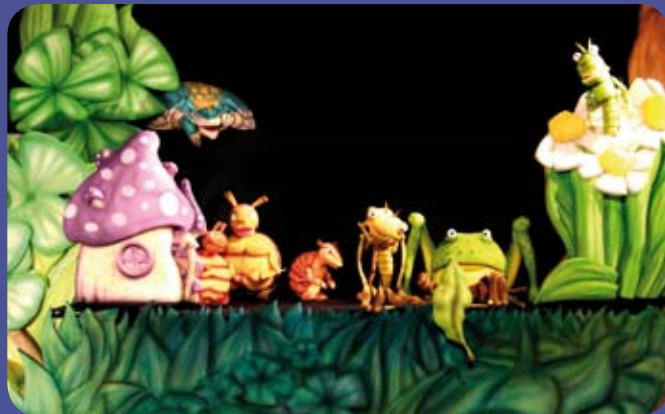
Pizzicatto teatro y Títeres lleva esta divertida fábula al TAM.

'S.O.S. Bichos', está ideada como una fábula en favor de la protección al medio ambiente que disfruta de algunos de los rasgos característico de la compañía Pizzicatto: humor, sutileza, picardía y la suma de inocencia e inteligencia. Gracias a estos ingredientes, obtuvo el premio al mejor espectáculo de la Feria de Teatro de Castilla y León de Ciudad