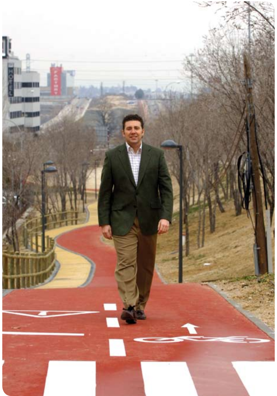
Una de las apuestas decididas de este Equipo de Gobierno es la promoción del deporte y el medio ambiente. Las Nuevas Vías Ciclistas son buena prueba de ello, y tienen como objetivo completar el Anillo Ciclista y promover la movilidad sostenible y reforzar los modos de transporte menos contaminantes. Para ello, se destinarán 498.066 euros.