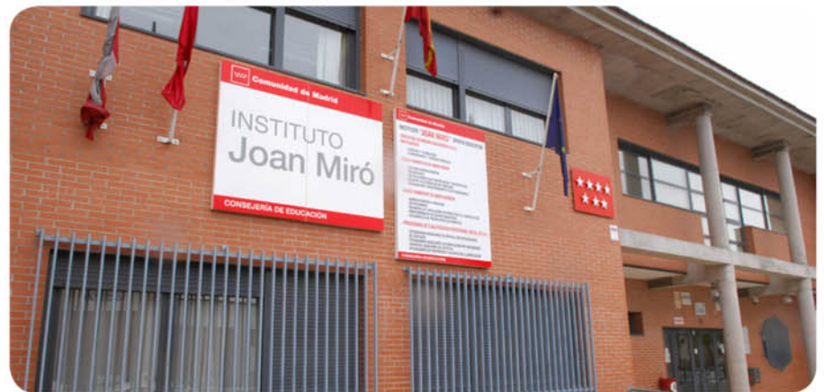
Fachada del Instituto de Educación Secundaria Joan Miró, pionero en el municipio por su carácter bilingüe.

La Comunidad de Madrid pondrá en marcha el próximo curso (2010-2011) los primeros institutos bilingües de la región; un total de 32, en esta primera fase. En San Sebastián de los Reyes, el centro educativo elegido para impartir sus clases en inglés ha sido el IES Joan Miró.