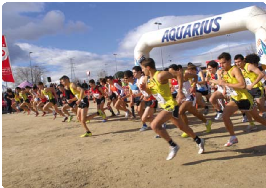
Salida de una de las carreras del cross popular que tuvo lugar el sábado y en la que hubo una masiva participación tanto de corredores como del público asistente que se acercó del Dehesa Boyal, lo que afianza cada vez más una competición que se ha convertido en uno de los grandes clásicos de la Comunidad de Madrid.

El sábado 30 de enero el circuito del Arroyo de los Quiñones en los alrededores del polideportivo Dehesa Boyal fue el escenario de la decimoctava edición del Cross de San Sebastián de los Reyes. En el cuadro adjunto están reflejados los primeros clasificados de las categorías más importantes en esta carrera que tiene un carácter popular y contó con una gran participación. Asimismo, el domingo se disputó en el mismo lugar el Campeonato de Madrid Absoluto de Clubes e Individual, campo a través. En esta competición participan los clubes más importantes el acceso al Campeonato de España absoluto, que