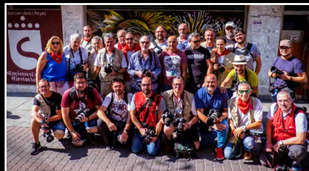
Grupo de fotógrafos del encierro de Sanse posando en la calle Postas (2019)