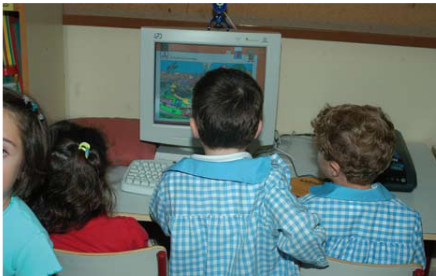
Los estudiantes de Educación Primaria y Secundaria han participado en el concurso de dibujo "Yo no falto".

• Jornada técnica, dirigida a técnicos y responsables directamente implicados en la prevención del Absentismo Escolar. Se presentarán distintas experiencias, desde una Mesa de Buenas Prácticas, y la labor de las Instituciones. Para la primera opción, 'Panel educativo 2010', que tendrá lugar en horario de tarde los días 10, 11 y 12 de mayo, la inscripción podrá hacerse hasta el 6 de mayo y por orden de llegada hasta cubrir aforo en el enlace que aparecerá en