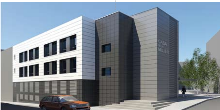
El nuevo edificio será un ejemplo vanguardista en cuanto a diseño y sostenibilidad.

tener la cimentación y estructura existente y la construcción de una nueva cubierta plana invertida. Contará con sistemas de ventilación que garanticen la renovación de aire y de un sistema de energía solar para cubrir parte de la demanda de agua caliente sanitaria del centro. Esta instalación se calculará y diseñará en función del consumo y la radiación solar que incida en el emplazamiento.