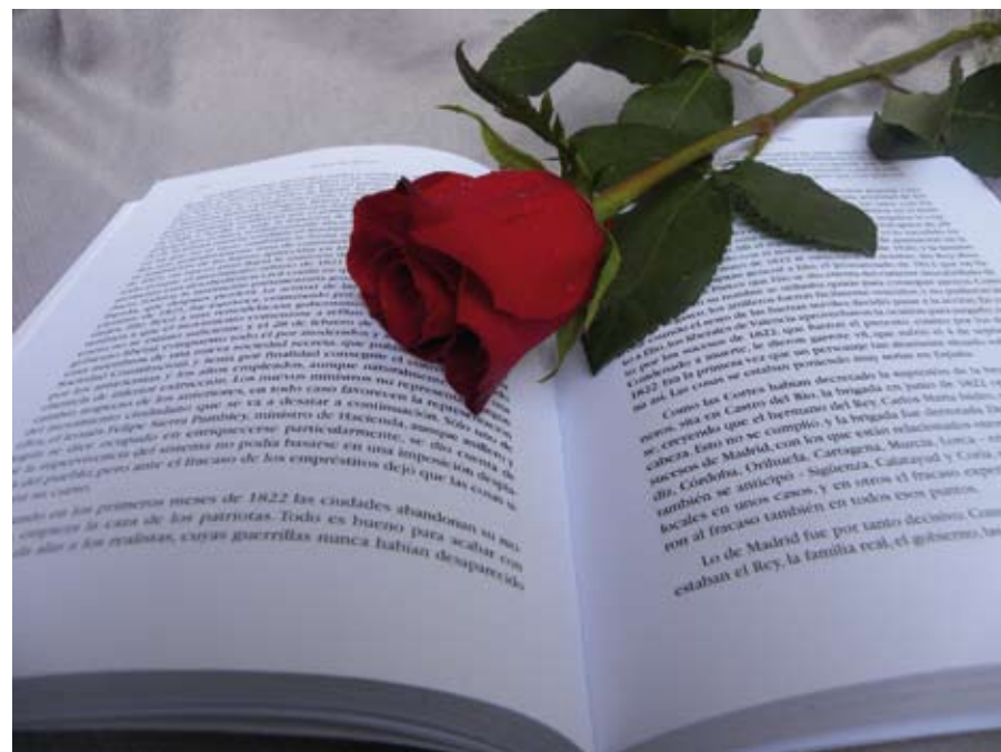
La rosa y el libro son los emblemas de una fecha que conmemora la lectura.

El día 23 de abril, fecha del aniversario del fallecimiento de Cervantes, de Shakespeare, de el 'Inca' Garcilaso de la Vega, Josep Pla o Manuel Mejía Vallejo, se celebra el Día Internacional del Libro. Por este motivo, el Ayuntamiento, a través de la Concejalía de Cultura, ha organizado un año más la Semana del Libro Infantil y Juvenil, que llega a su edición vigésimo séptima y tendrá lugar entre los días 19 y 23.