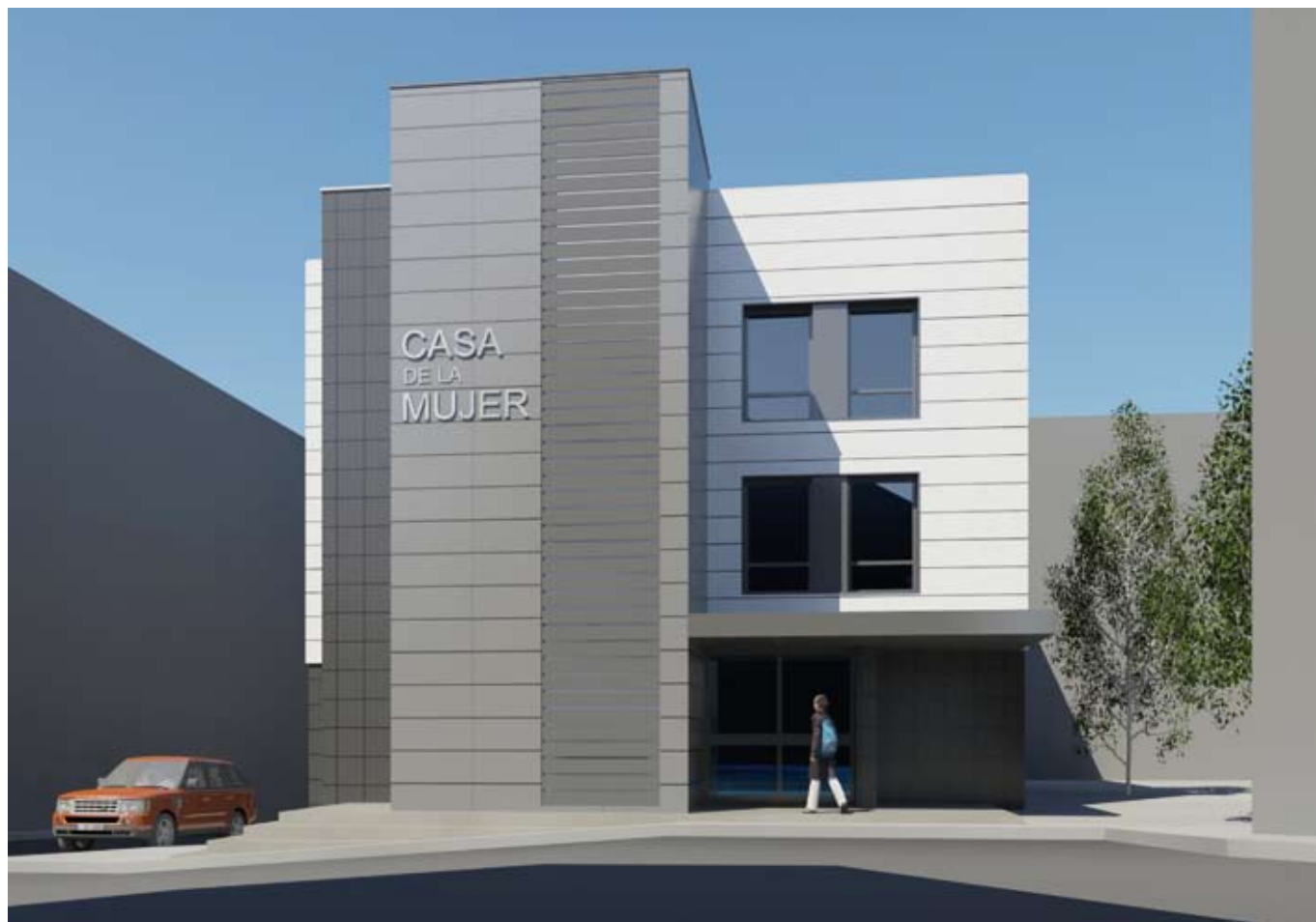
Vista frontal de lo que será la nueva Casa de la Mujer. En total, 760,47 metros recuperados con un presupuesto de 1.006.724 euros.

La Casa de la mujer' va a ser una realidad dentro de poco, gracias a la rehabilitación total del edificio de la calle Recreo, 2, actualmente en desuso y que originalmente era una escuela que fue remodelada para acoger el centro juvenil 'Inmaculada Concepción'; en total, 760,47 metros de superficie recuperados con un presupuesto de 1.006.724 euros.