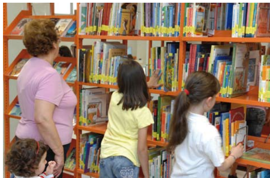
El Ayuntamiento ha preparado una gran cantidad de actividades para la Semana del Libro.

premios a los dos ganadores de cada una de las categorías (Primaria y ESO) tendrá lugar el viernes 23 de abril de 2010 al terminar la lectura compartida del Quijote. El acto tendrá lugar en las Bibliotecas Central, Plaza de Andrés Caballero, 2, y en la Claudio Rodríguez,