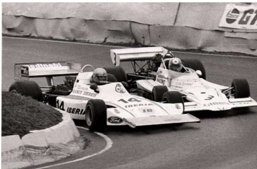
Lance de carrera de Emilio de Villota y otro competidor allá por los años 70.

Voy con mi mujer de compras al Centro Comercial Plaza Norte, al cine... Aunque la verdad es que cuando nos deja el calendario de carreras preferimos escaparnos al norte, a Cantabria.