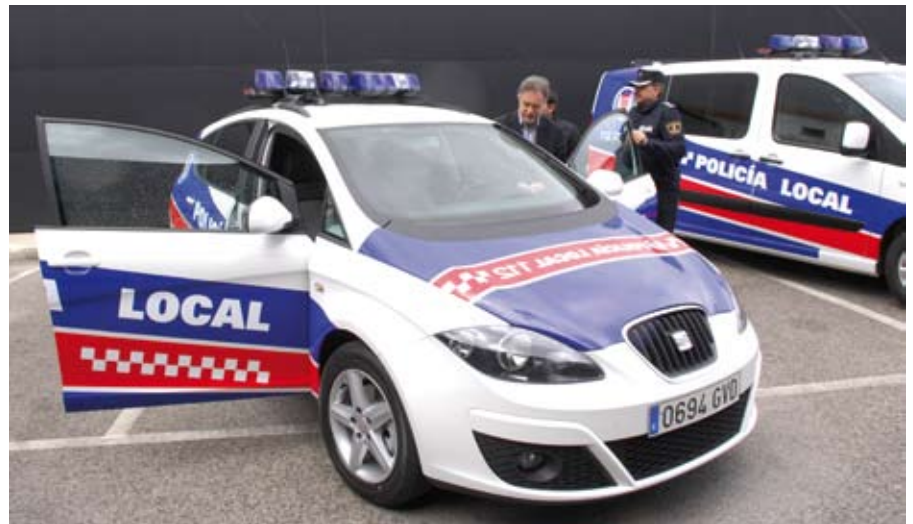
El alcalde se sube a uno de los nuevos vehículos de los cinco que reforzarán la flota para garantizar la seguridad y una policía cercana al vecino.

Los nuevos vehículos estarán dedicados al control del tráfico, tareas administrativas y traslado de efectivos, integrados en una flota, con 17 coches patrulla y 14 motocicletas, que cubre en la actualidad nuestro término municipal. Esta renovación forma parte de la modernización completa de la flota, cuyas motocicletas y coches se cam-