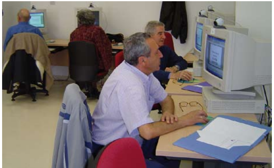
Los mayores tienen la oportunidad de ponerse al día con las nuevas tecnologías.

El Centro Municipal Gloria Fuertes ya ofrece acceso al sistema de teleservicios avanzados dirigidos a las personas mayores de nuestra ciudad. El Ayuntamiento y la Federación de Municipios y Provincias han unido esfuerzos para crear este nuevo servicio municipal que completa la programación de animación sociocultural con nuevos contenidos de información, comunicación y entretenimiento difundidos a través de Internet.