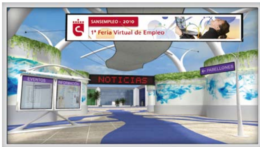
El portal del Ayuntamiento ( www.sansempresa.es ) es una valiosa oportunidad para los que buscan trabajo.

Paralelamente a la feria, se lanza una revista digital dedicada exclusivamente a la temática, donde se tratan temas de interés para el perfil de visitante y una guía rápida para hacer una visita virtual. En fechas posteriores se sumará a esta iniciativa la Feria Virtual Multisectorial en su segunda edición.