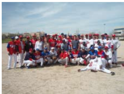
Los participantes del partido posan con

Durante la Semana Santa, el club de softball Latinos de Sanse - deporte novedoso en San Sebastián de los Reyes que practican principalmente este grupo de dominicanos - organizó un torneo de varios equipos de la zona norte de Madrid.