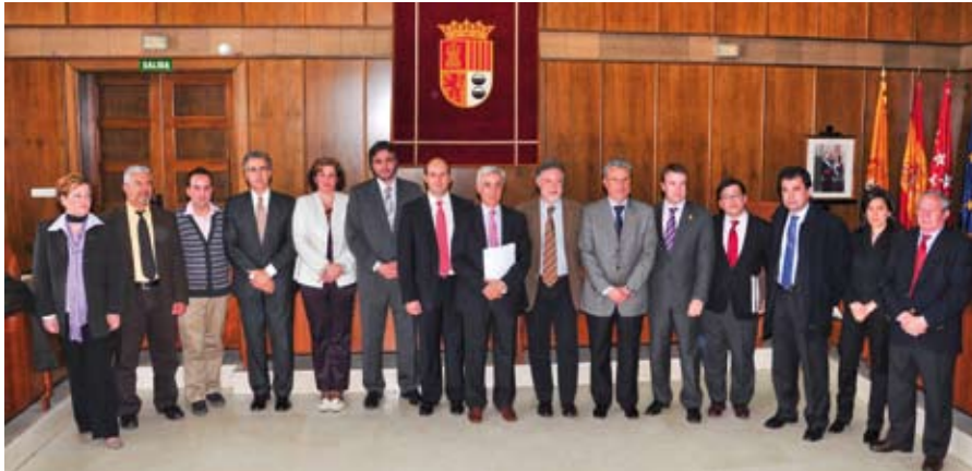
Foto de familia con los ediles de los ayuntamientos afectados por los ruidos de los aviones.