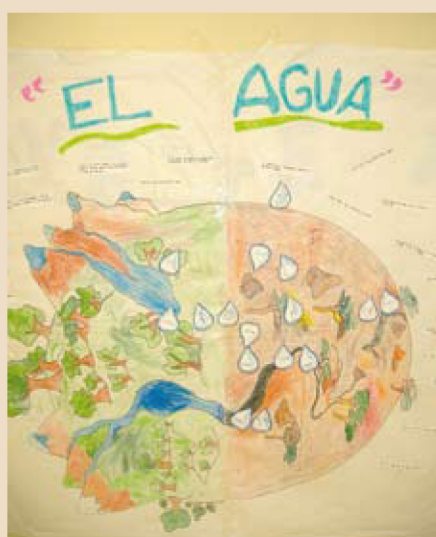
El agua ha sido protagonista de esta jornada.

Más de 500 menores del municipio participaron en actividades extraescolares lúdico-educativas (Ludoteca, Diverteca y Recréate, Las Tardes del Cole y Aulas de Estudio y en otros programas de asociaciones que trabajan con los menores en el Centro Joven), organizadas para tomar conciencia de que el agua es un bien necesario que se debe cuidar.