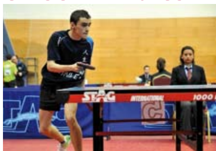
In in vel inibh eum incidui blam quat. Exeraes