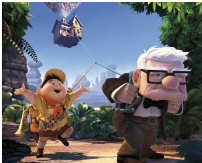
La película de animación 'Up' se proyectará en el Centro Joven Sanse el día 17 a las 17.00 h., dentro de la programación de Espacio Abierto.