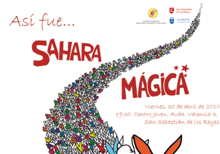
Cartel que recuerda la gala de magos que tuvo lugar en el sahara antes de Navidad.