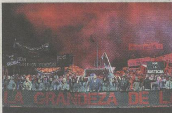
Imagen de la obra 'Mahagonny', / JAVIER DEL REAL

La familia del niño de 22 meses muerto a la puerta del 12 de Octubre denunciará al hospital /6