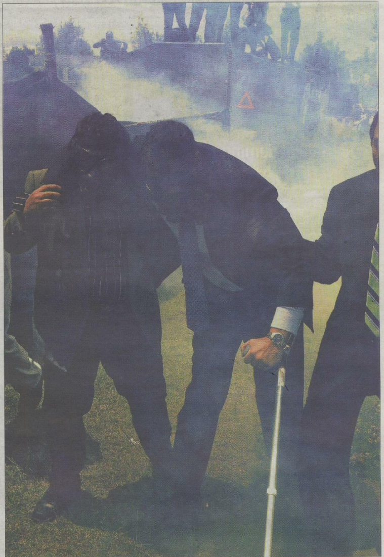
Correa, presidente de Ecuador, con máscara antigás y muleta, evacuado del Regimiento Quito.

Por su parte, el movimiento oficialista Alianza País, que lidera el presidente Correa, convocó a cientos de simpatizantes frente de la sede del Gobierno para respaldar al régimen. La organización social que el Ejecutivo ha venido tejiendo en los casi cuatro años de poder dio sus frutos