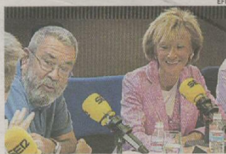
Méndez y Fernández de la Vega se mostraron dialogantes ayer en una entrevista radiofónica

CC OO culpa del fracaso del 29-S al «idilio» entre UGT y el Gobierno