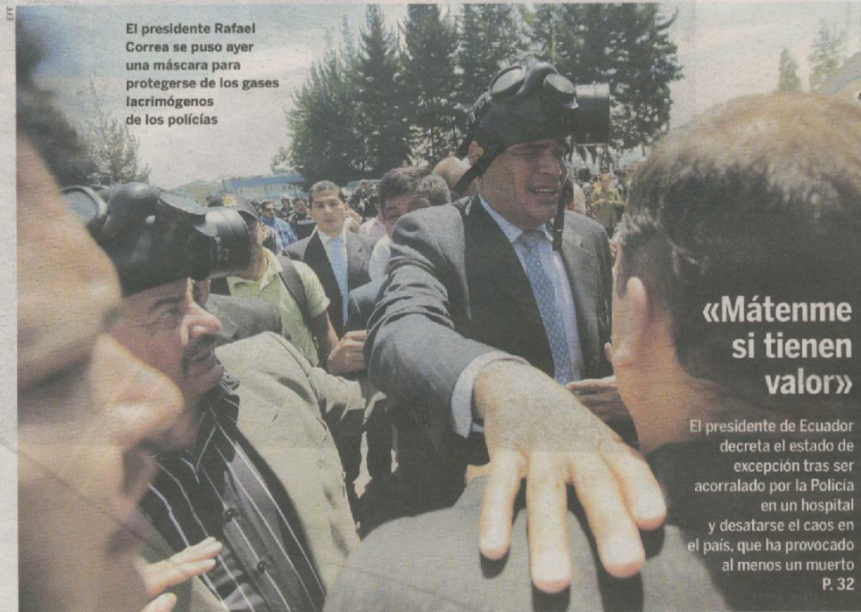
El presidente Rafael Correa se puso ayer una máscara para protegerse de los gases lacrimógenos de los policías

Desempleo: después de revisarlo al alza, Salgado augura 184.360 parados más de los previstos entre 2010 y 2011