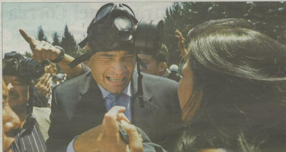
El presidente Rafael Correa, con máscara de gas tras resultar ligeramente herido en un intercambio de golpes en un cuartel de la policía.

Trinidad Jiménez, aspirante a candidata a la presidencia de la Comunidad de Madrid, sostiene en una entrevista concedida a EL PAÍS que "el resultado de las primarias no vincula a Zapatero". Jiménez asegura que nunca situaría a un imputado dentro de sus listas. PÁGINAS 14 Y 15