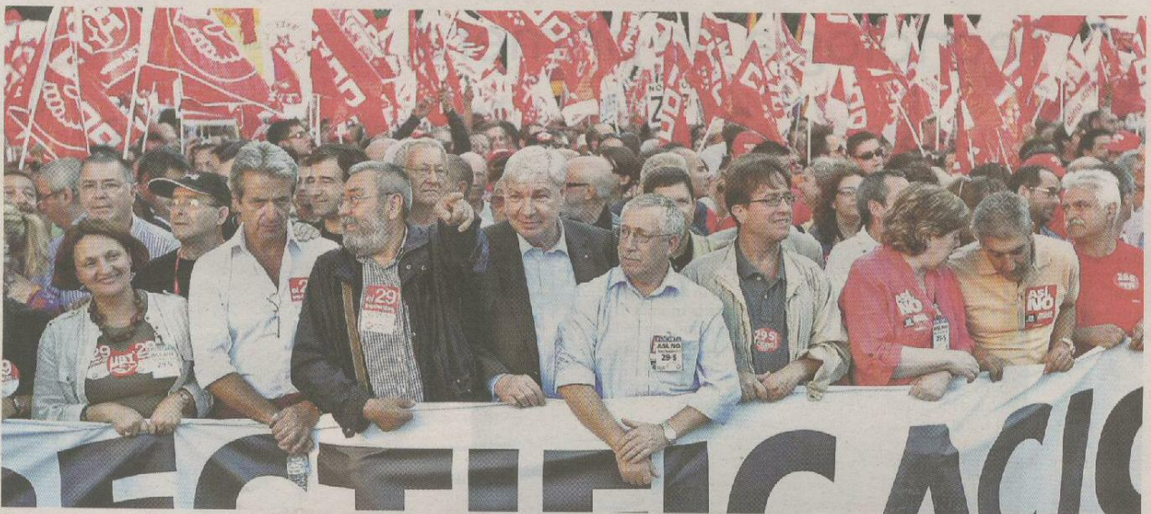
Imagen de la manifestación de Madrid convocada por los sindicatos como colofón a la huelga general del 29-S.

«La huelga no ha satisfecho ni al Gobierno, ni a los sindicatos, ni a la economía ni al país, a pesar de ser una respuesta social a una promesa rota (...) La gente se siente engañada»