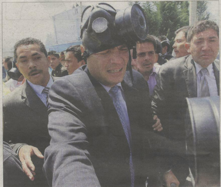
El presidente de Ecuador, Rafael Correa, con gesto de dolor y una máscara antigás, ayer en Quito.

Sigue en página 36 Editorial en página 3