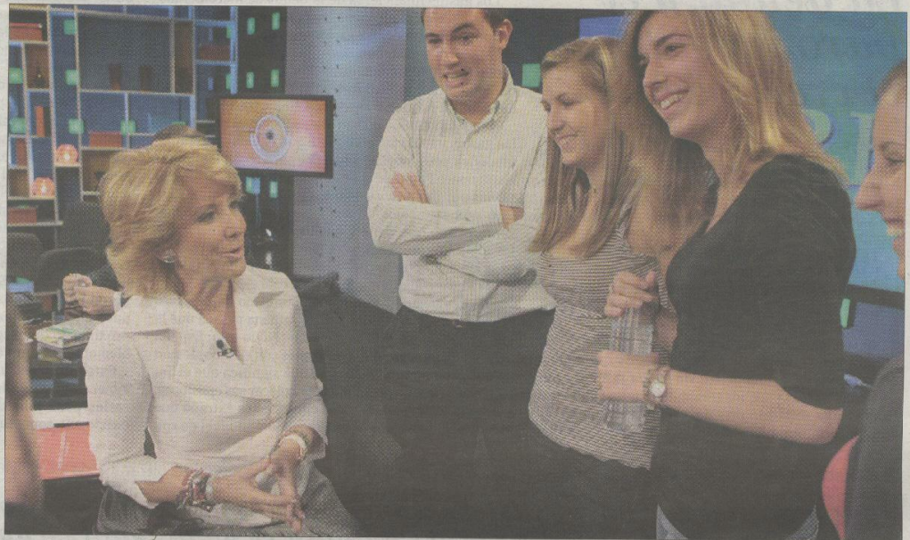
La presidenta de la Comunidad de Madrid, Esperanza Aguirre, charla anoche con algunos de los asistentes al programa 'La vuelta al Mundo en Orbyt'.