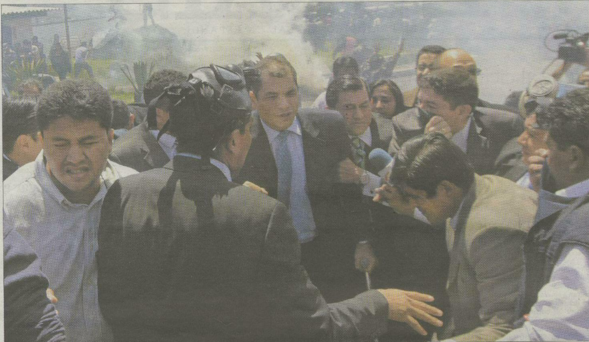
El presidente de Ecuador, Rafael Correa (en el centro, con corbata verde), sale junto con sus escoltas del cuartel de la policía de Quito tras la rebelión de los agentes.