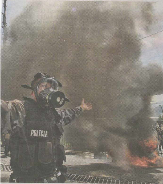
Un grupo de policías amotinados ayer en un cuartel de Quito.