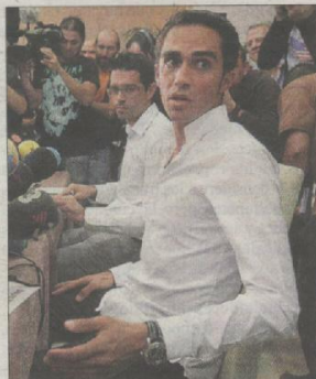
Contador da explicaciones, ayer en Pinto.

Armadas mostraron al mandatario ecuatoriano su lealtad, los policías se amotinaron y llegaron a lanzar gases lacrimógenos contra Rafael Correa, que tuvo que refugiarse en un hospital. Sigue en página 28