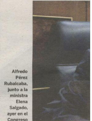
Alfredo Pérez Rubalcaba, junto a la ministra Elena Salgado, ayer en el Congreso

En este caso, el magistrado habría querido conocer de primera mano si, por parte del Gobierno, se indicó en algún momento a los responsables de las Fuerzas de Seguridad que debían cesar en la actividad antiterrorista contra ETA o, en su caso, amornar la presión.