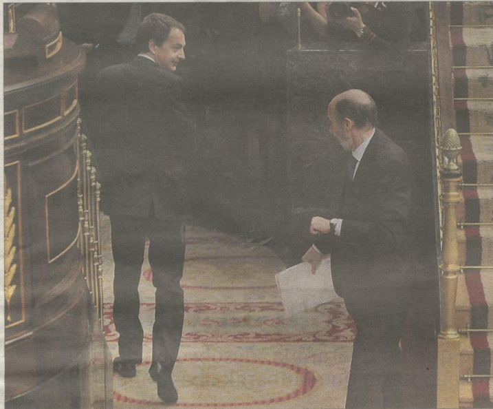
"HAY QUE ESPERAR". José Luis Rodríguez Zapatero, en la imagen junto a Alfredo Pérez Rubalcaba, se mostró ayer muy cauto. "Hay que esperar", contestó a la pregunta sobre el futuro de Sortu.