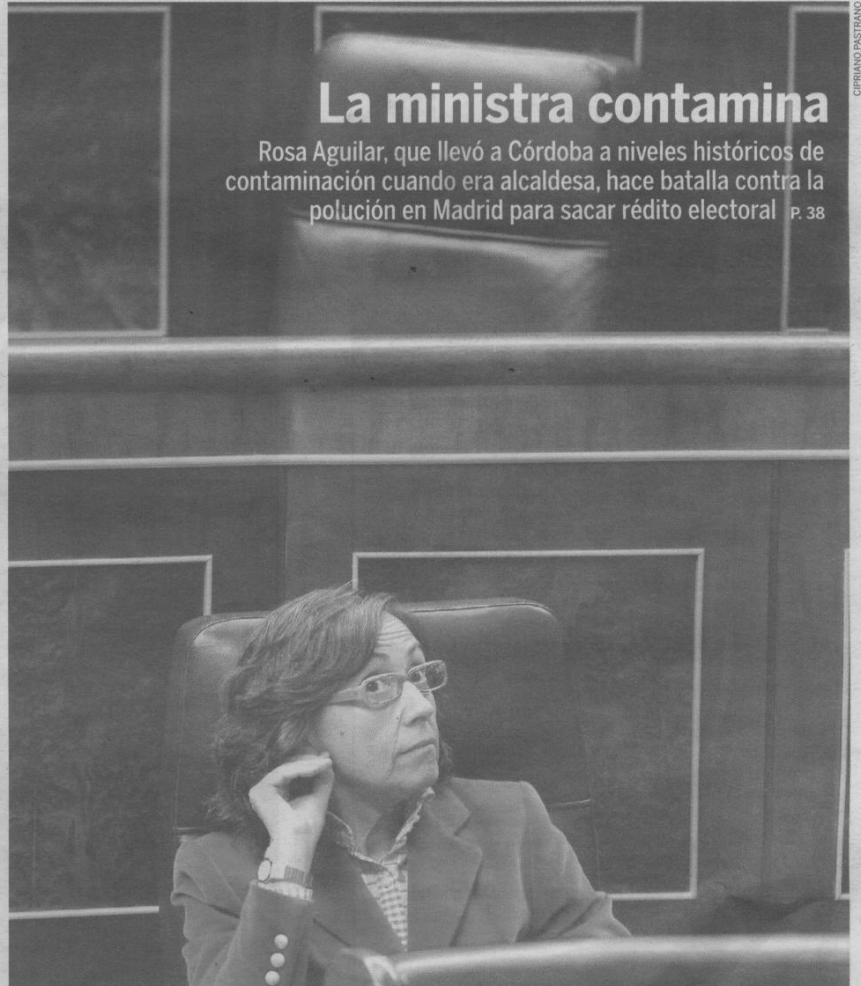
La ministra de Medio Ambiente, Rosa Aguilar, en imagen de ayer en el Congreso, quiere reunirse con las autonomías

Rosa Aguilar, que llevó a Córdoba a niveles históricos de contaminación cuando era alcaldesa, hace batalla contra la polución en Madrid para sacar rédito electoral p. 38