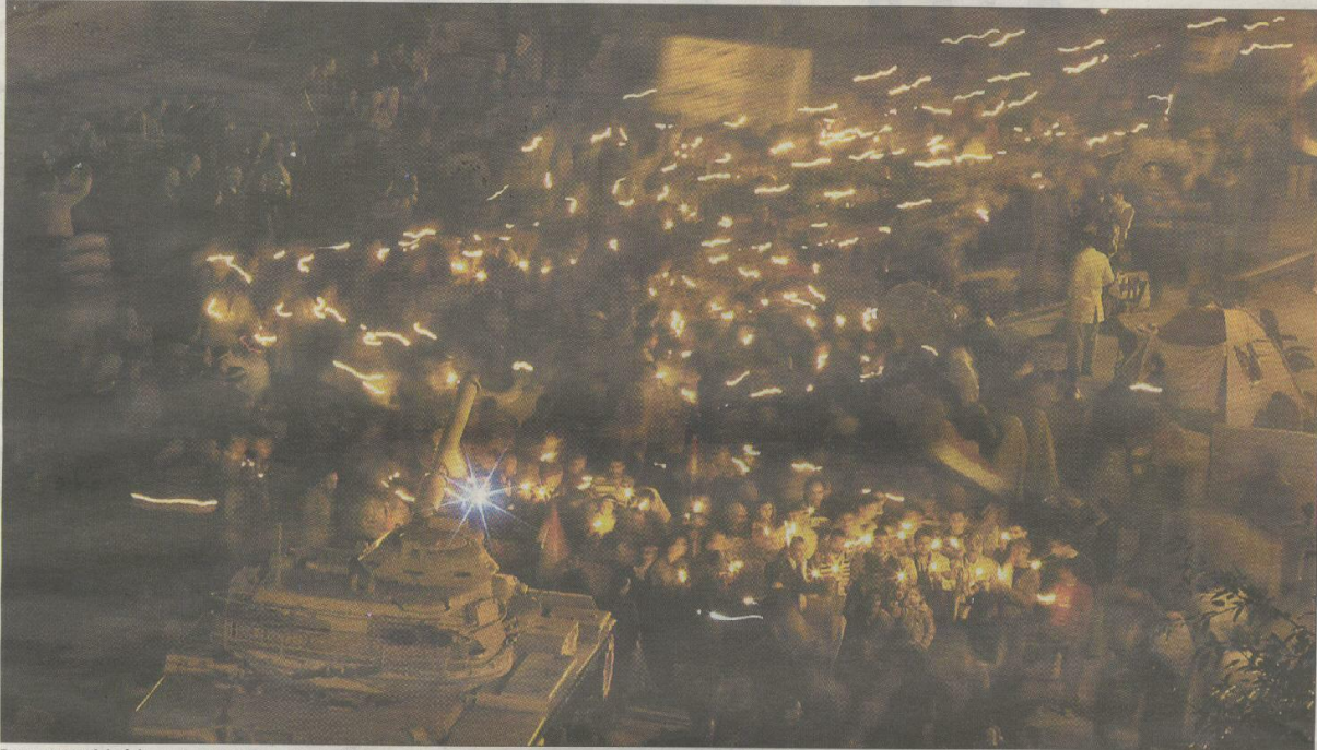
Detractores del régimen de Hosni Mubarak desfilan con velas ante un tanque en la plaza caiota de la Liberación.