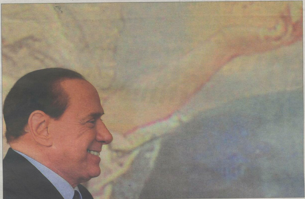
El primer ministro italiano, Silvio Berlusconi, al final de la rueda de prensa del Consejo de Ministros de ayer, en el Palacio Chigi de Roma.

Por su parte, Il Cavaliere reaccionaba con evidente cólera a la petición de los fiscales de Milán de pedir su procesamiento inmediato por un delito de prostitución de menores y otro de abuso de poder. «Se trata de prácticas que violan la ley, que van contra el Parlamento. La Fiscalía de Milán no tiene la competencia territorial ni funcional», se quejaba Berlusconi, quien