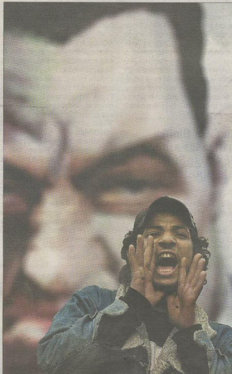
Un manifestante, ante una imagen de Mubarak en El Cairo.

Los soldados se limitaron a apostarse con sus armas detrás de las rejas de los edificios para protegerlos, pero la calle donde se alza el Legislativo fue conquistada para la causa contra Mubarak. Y no solo fue esa. Los manifestantes han dejado claro que su dominio se extiende ya desde la