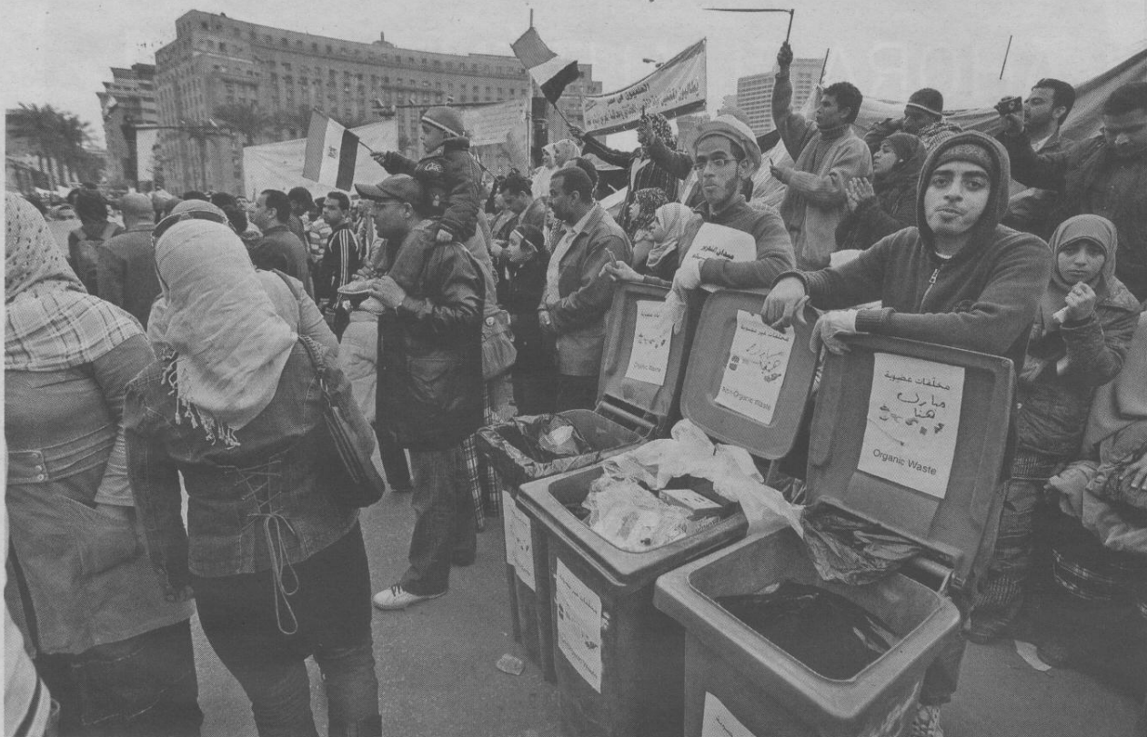
Manifestantes en la plaza Tahrir de El Cairo, con contenedores para separar la basura orgánica de la inorgánica