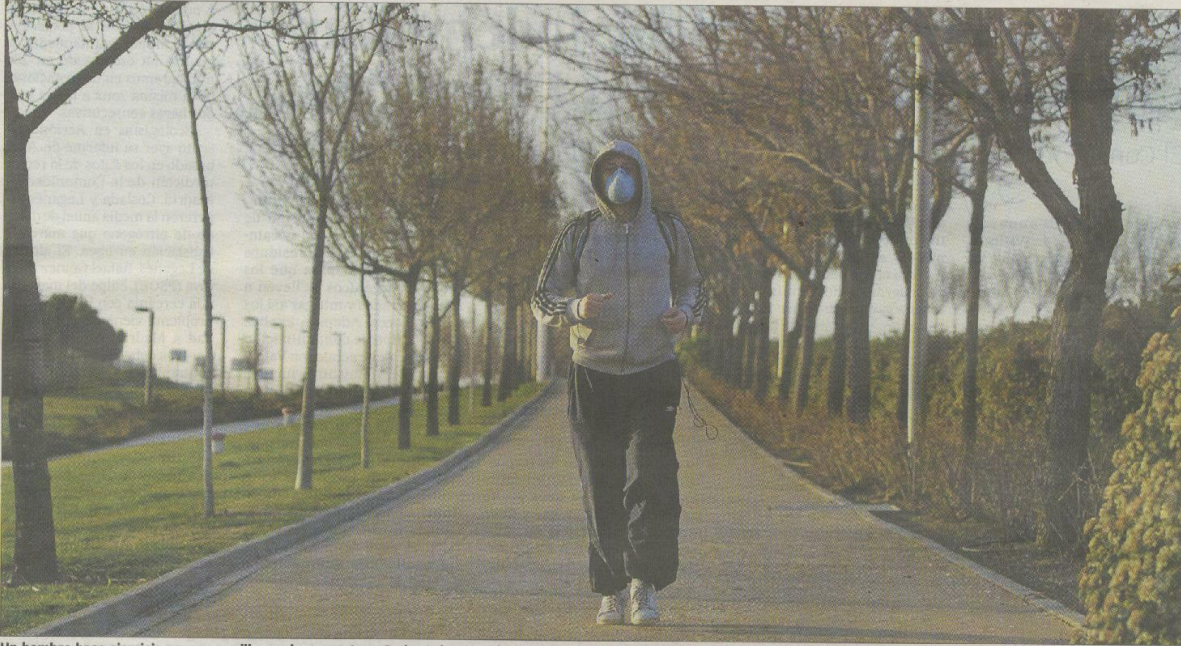
Un hombre hace ejercicio con mascarilla en el parque Juan Carlos I.