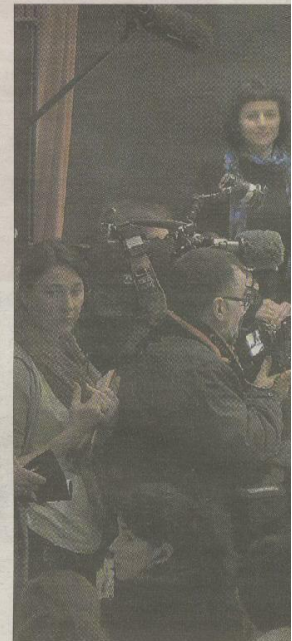
Integrantes de la nueva formación de la izquierda abertzale, durante su presentación ayer en el Club de Amigos de la Unesco, en Madrid.