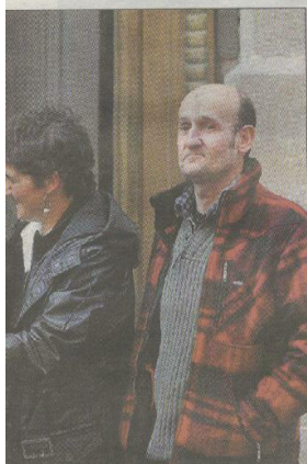
Miembros de Sortu enseñan la solicitud de inscripción del partido hecha en el registro de Interior.

» Artículo 16 (...) Para poder ser candidato/o en cualquiera de las listas electorales que presente SORTU se deberán asumir, previamente a la presentación de aquellas, las bases ideológicas de aquellas, las bases ideológicas contempladas en el Capítulo Preliminar y en el artículo 3º.