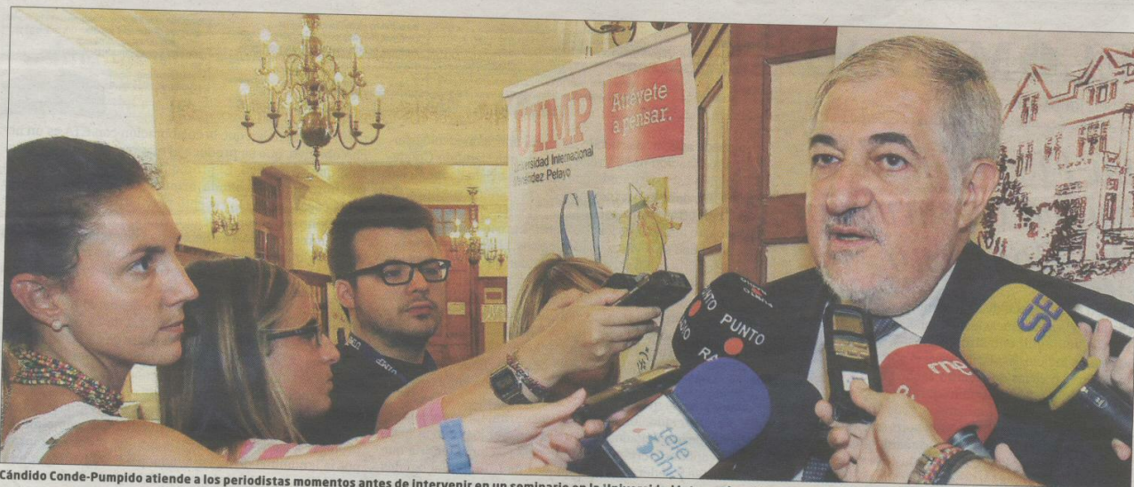
Cándido Conde-Pumpido atiende a los periodistas momentos antes de intervenir en un seminario en la Universidad Internacional Menéndez Pelayo.