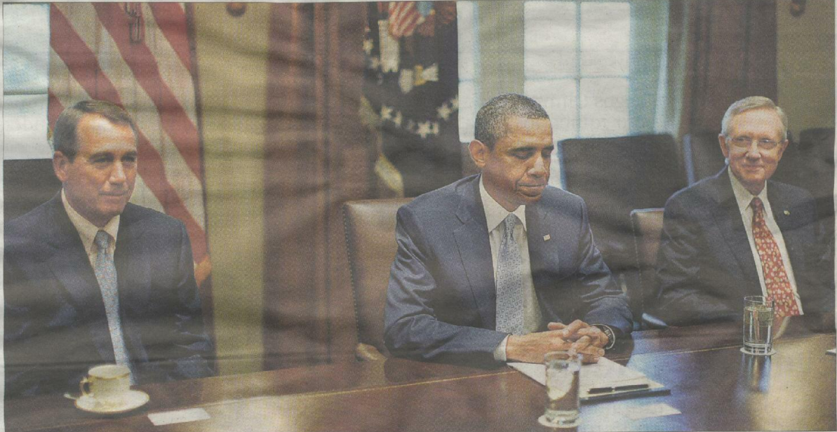
El portavoz de la Cámara de Representantes, John Boehner (izquierda), Barack Obama y el líder demócrata en el Senado, Harry Reid, en una reunión en la Casa Blanca.