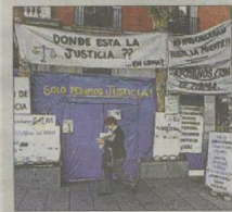
La caseta de los Meño.

Hoy es el primer día de una nueva vida para los Meño. Dejarán de ir a los juzgados, de atender a los medios y podrán dedicarse a atender a su hijo sabiendo que ahora están solo ellos.