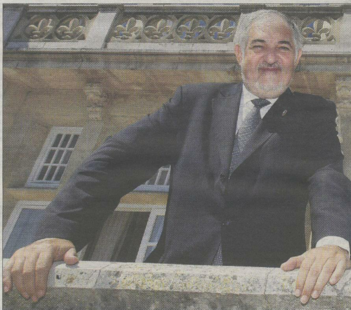
Cándido Conde-Pumpido, ayer, antes de participar en uno de los cursos de verano en Santander.

Así queda reflejado en la última circular de la Fiscalía General, dictada el pasado 2 de junio. Se trata de la «circular 2/2011 de la Fiscalía General del Estado sobre la reforma del Código Penal por ley orgánica 5/2010 en relación con las organizaciones y grupos criminales». Editorial en página 3