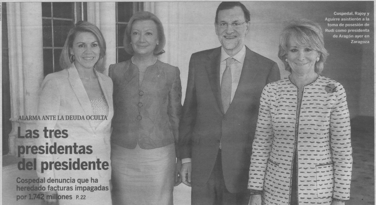
Cospedal, Rajoy y Aguirre asistieron a la toma de posesión de Rudi como presidenta de Aragón ayer en Zaragoza