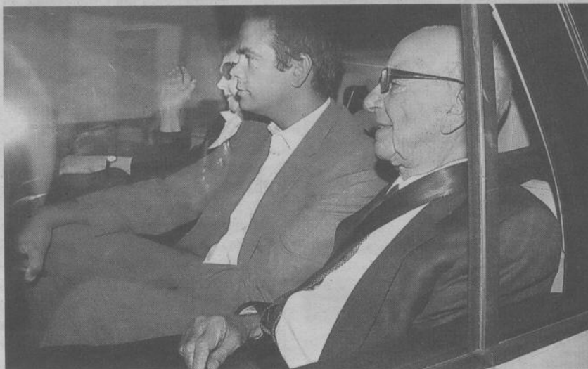
Rupert Murdoch ayer, a la salida de su residencia en Londres

Abi Titmuss, una «celebrity» famosa por... sus portadas en «top less» en revistas para hombres, demandó ayer a News International después de conocer que también la habían espiado