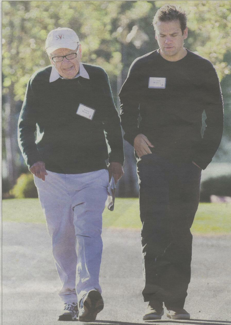
El magnate Rupert Murdoch camina junto a su hijo Lachlan en Sun Valley (Idaho).

En el Reino Unido, el magnate de la prensa y su hijo James tendrán que comparecer el próximo martes ante el Parlamento británico para declarar sobre el escándalo de las escuchas telefónicas.