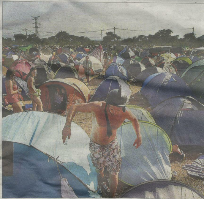
Zona de acampada en el amplio recinto del Festival de Benicàssim.