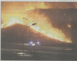
Valdebebas, durante el incendio de anoche.

EL MUNDO / LA REVISTA DIARIA DE MADRID VIERNES 15 DE JULIO DE 2011