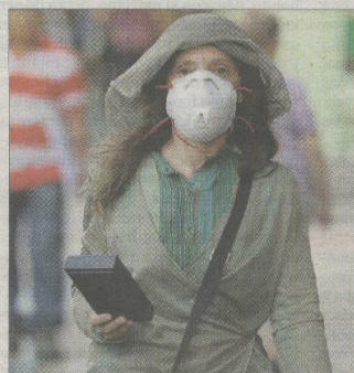
Minerva, con un medidor de frecuencia.