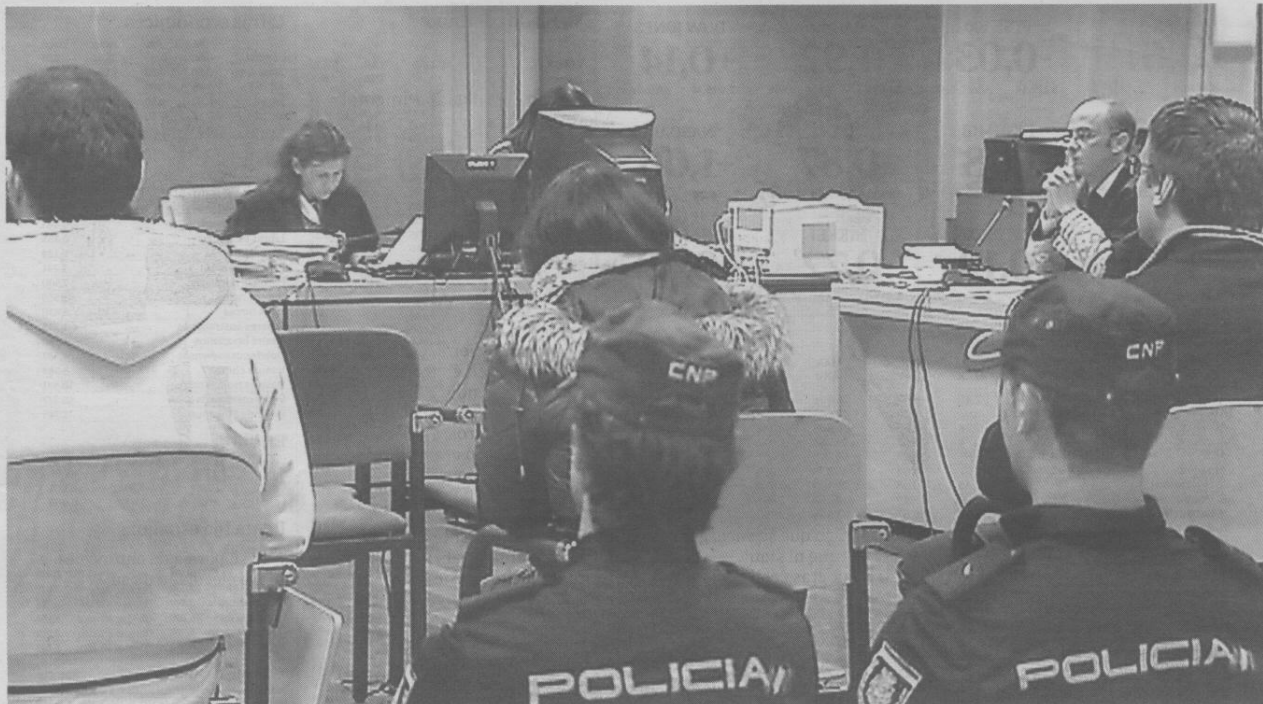
El juicio arrancó ayer con tres acusados en el banquillo: el presunto sicario (izquierda), la ex mujer (centro) y el intermediario (derecha)