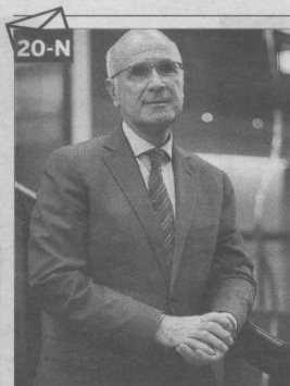
DURAN LLEIDA CANDIDATO DE CIU A LAS ELECCIONES GENERALES

La jueza apunta a Griñán en la trama corrupta de los ERE y dice que tuvo que autorizar subvenciones de más de 1.2 millones P.17