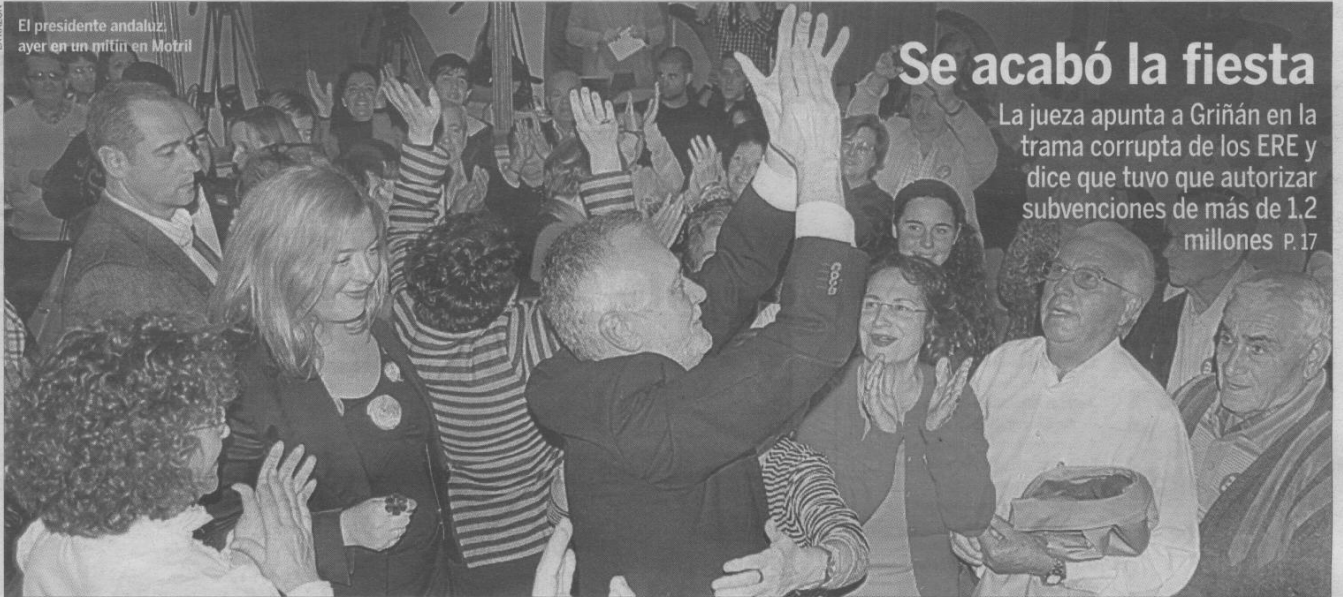
El presidente andaluz, ayer en un mitin en Motril

● Si vence el 20-N convocará una reunión urgente con los grupos políticos Edit. y P. 14