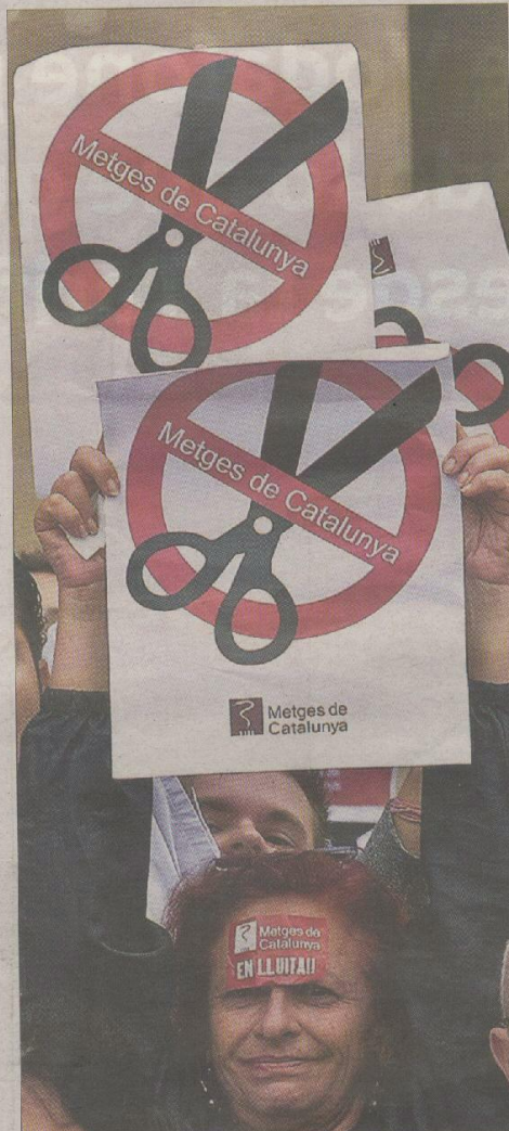
HUELGA A MEDIO GAS EN LA SANIDAD CATALANA. La primera jornada de huelga de los médicos contra los recortes en Cataluña transcurrió con un seguimiento desigual. El sindicato convocante cifró la participación en el 71%, la Generalitat lo rebajó al 21%. Los centros funcionaron como en un día festivo. PÁGINA 46

Resucita el 'caso Matsa' que archivó el Supremo