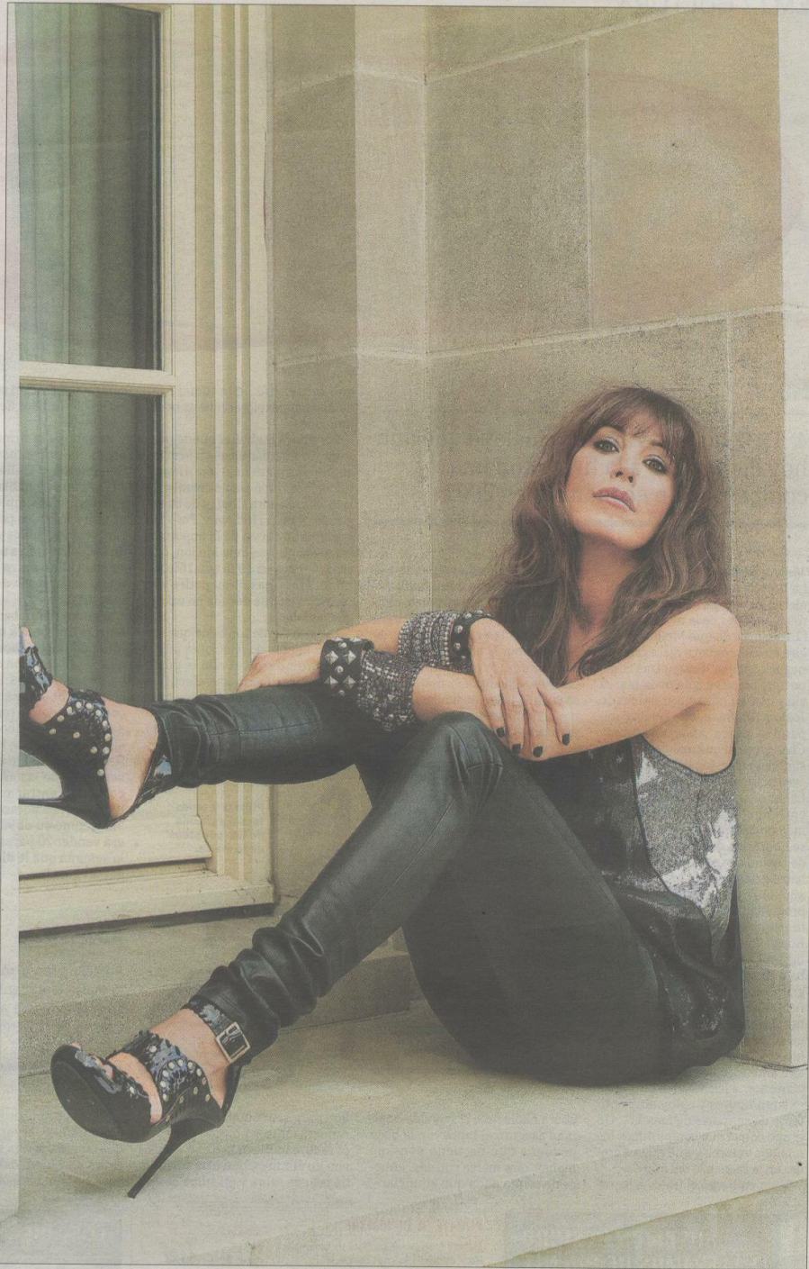
Tamara Mellon, en una imagen de 2009, posando con motivo del lanzamiento de una línea de zapatos para la firma H&M.