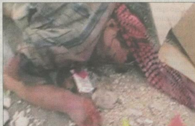
Un cadáver yace en una calle de Homs.

Bashar Asad continúa enroscado en su posición, apoyándose en el sostén que todavía le presta principalmente Rusia, que pese a recibir a una delegación del CNS liderada por el propio Galiot se negó a cambiar su alianza política con Damasco.