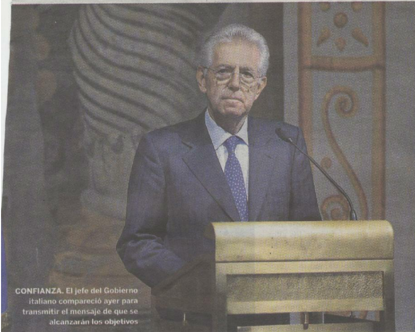
CONFIANZA. El jefe del Gobierno italiano compareció ayer para transmitir el mensaje de que se alcanzarán los objetivos

El presidente del Consejo Europeo señaló que la situación italiana es el ejemplo de que «los problemas de un país son los de toda la zona euro».