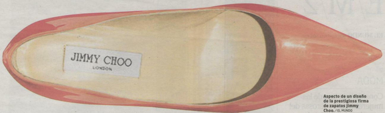
Aspecto de un diseño de la prestigiosa firma de zapatos Jimmy Choo.