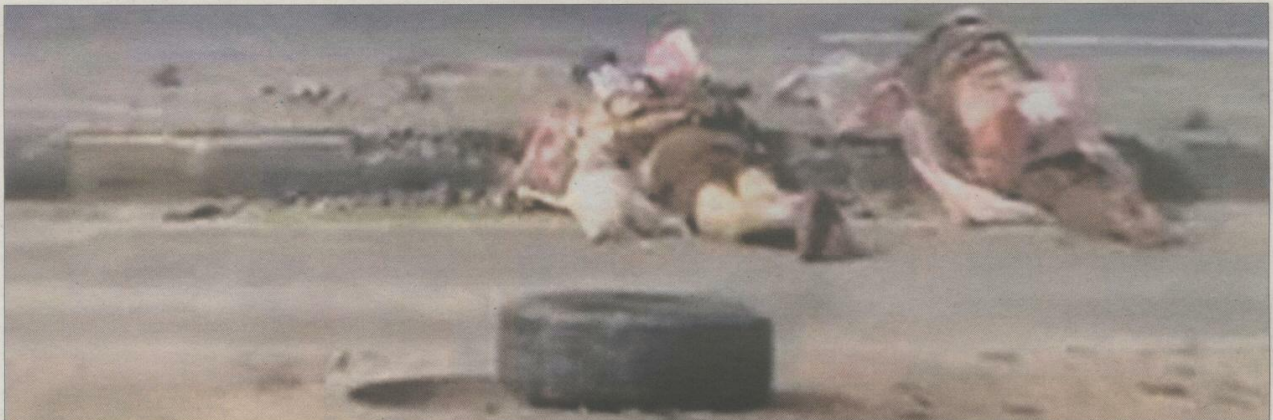
Captura de un vídeo colgado en YouTube en el que dos hombres muertos yacen con las manos atadas a la espalda, en el barrio de Deir Balbah de la ciudad siria de Homs.