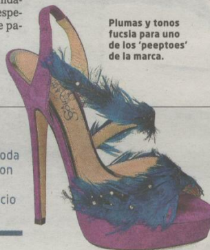
Plumas y tonos fucsia para uno de los 'peep-toes' de la marca.

contrar inspiración para sus zapatos en mercadillos de Goa, Oaxaca o Marsella.