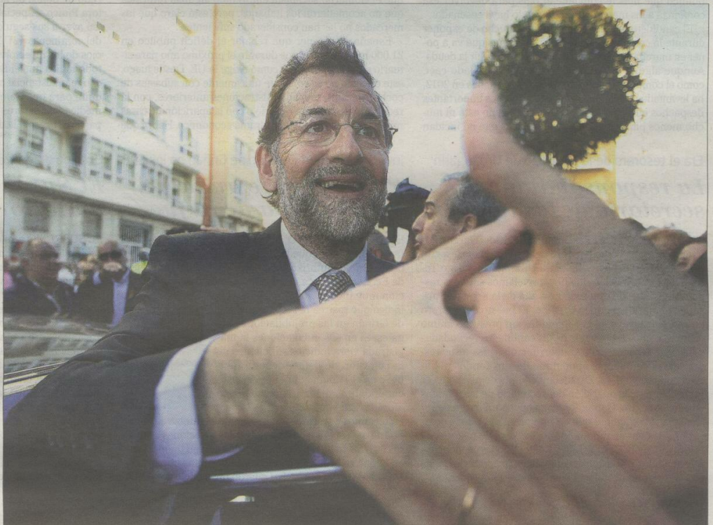
Mariano Rajoy saluda ayer a un simpatizante a su llegada al palacio de festivales de Santander, donde celebró un mitin.

«Hay desconfianza dentro y fuera; menos gente invirtiendo; créditos más caros... y eso es lo que nosotros vamos a romper cambiando las políticas, los equipos y las actitudes