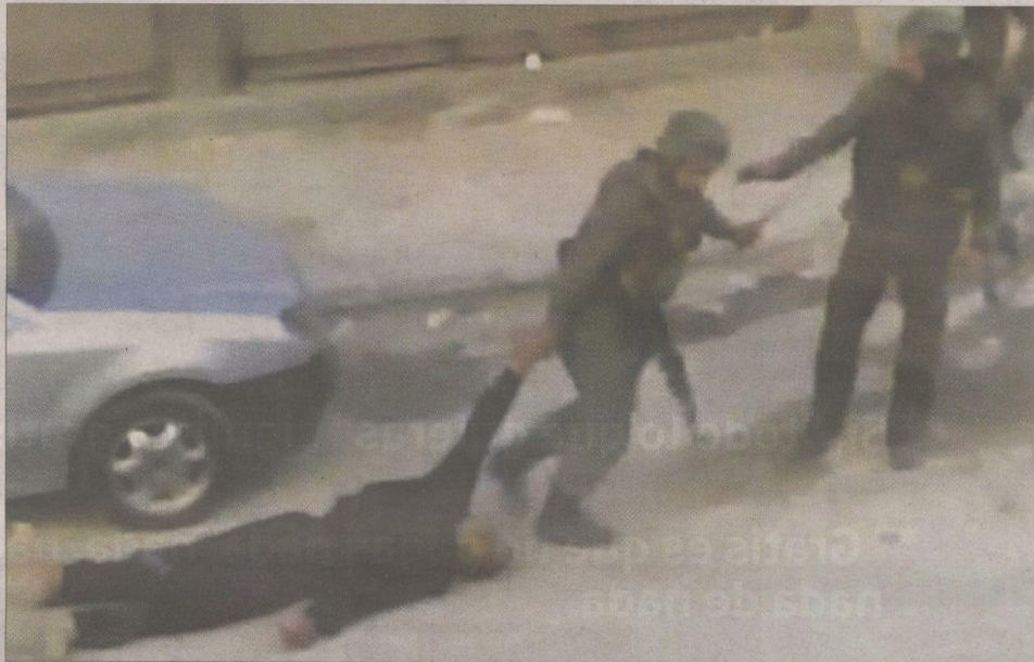
Una captura de un vídeo que muestra a un militar sirio arrastrando el cuerpo de un civil en una calle de Damasco.

El país más dependiente de Siria, Líbano, se ha visto engullido por la crisis tras la votación celebrada el sábado en El Cairo por la Liga Árabe, un organismo que vuelve a reunirse hoy en Rabat para analizar nuevas medidas. Líbano fue uno de los tres países que votaron contra la expulsión, junto a Yemen y la propia Siria, mientras Irak se abstuvo y los otros 18 miembros votaron a favor. El voto libanés no solo escandalizó a la oposición, sino también a una parte del Gobierno, dominado por la milicia chií Hezbolá. El ministro druso Wael Abu Faour declaró que la opinión pública libanesa estaba dividida al 50% a favor y en contra de El Asad