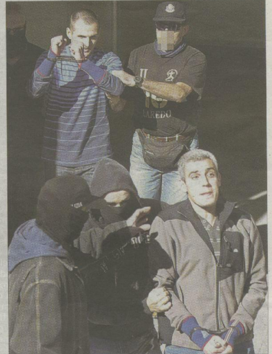
Los etarras Portu y Sarasola, en el momento de su detención el 6 de enero de 2008, en la localidad guipuzcoana de Arrate

La banda «sacará testigos» Igual sucedió con los informes de cuatro forenses, quienes coincidieron en que las lesiones pudieron tener su origen en el forcejeo entre agentes y terroristas producido cuando éstos intentaban evitar la detención.