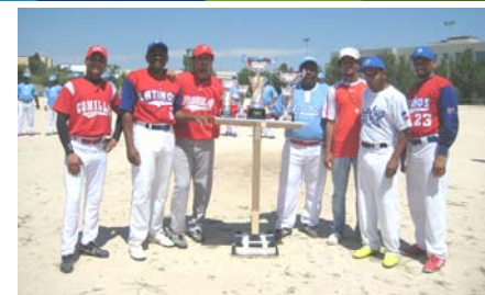
Los representantes de los equipos integrantes del torneo con los trofeos que serán entregados en la final del 4 de Septiembre.

El pasado 24 de Julio la Concejala Delegada de Inmigración Dña. Mar Escudero dio el pistoletazo de salida al 1 er Torneo de verano de softbol el cual tiene lugar todos los sábados hasta el 4 de Septiembre en los campos de fútbol del parque de La Marina de San Sebastián de los Reyes. Este torneo está integrado por los equipos: Los latinos de Sanse, Getafe, Parla, Marqués de Vadillo, Explosión (la latina).