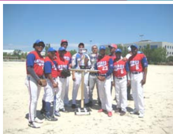
Miembros de Los latinos de Sanse