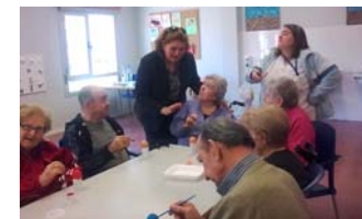
Abajo: Taller de huevos de Pascua realizado en centros de mayores.