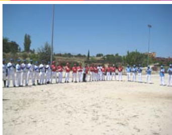
Presentación de los equipos.