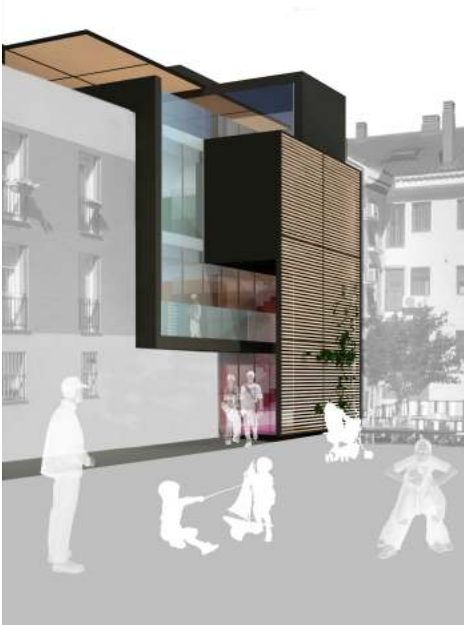
Edificio de diseño singular