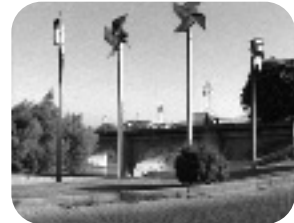
CAMINO DEL VIENTO. Martes, 21,40 h.