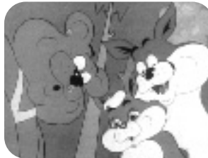
BLUFFERS. Lunes a viernes, 20,00 h.