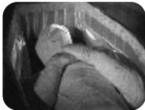
LA CASA DEL TERROR. Viernes, 21,30 h.