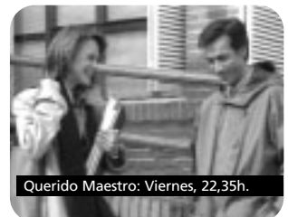
Querido Maestro: Viernes, 22,35h.