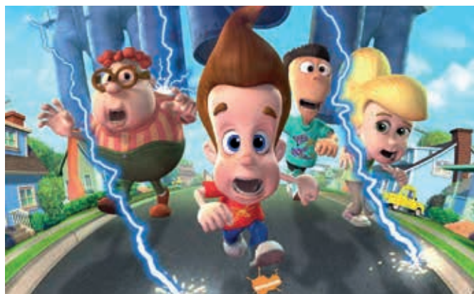
Cine para los más pequeños con "Jimmy Neutrón. El niño inventor", el sábado 3 a las 17.30 h. en el Centro-sociocultural Club de Campo.