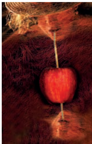
Las obra pictórica de Xenxo Sánchez recrea un universo urbano desde un perspectiva personal..