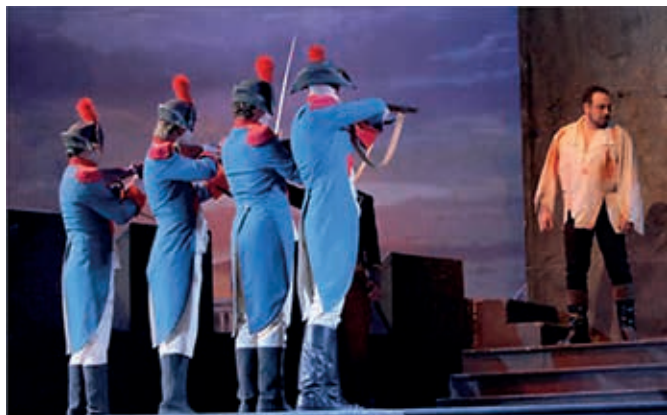
La ópera "Tosca" llega al Marsillach el sábado 10 de noviembre a las 20 h.