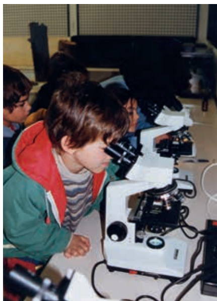
Con las actividades programadas por el Centro los niños se lo pasan en grande además de aprender muchos secretos relacionados con la Naturaleza.

Todas las actividades programadas se articulan sobre visitas colectivas al Centro de Naturaleza, que alcanzarán los 155 grupos este año. Escolares locales o grupos organizados son visitantes asiduos de esta instalación que, además, organiza otras actividades en fechas festivas para ampliar su oferta y sus servicios, desde los secretos de la fabricación de telas o papel hasta la manufactura del jabón y otros productos; usar materiales naturales o conocer los principales procesos que caracterizan el desarrollo sostenible. Este Centro reúne un amplio número de recursos, espacios para exposiciones, muestras audiovisuales y una sala polivalente para talleres, además de un laboratorio de campo, un huerto, un invernadero y una senda ecológica. ●●●