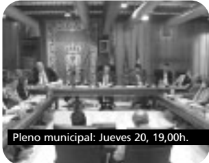
Pleno municipal: Jueves 20, 19,00h.