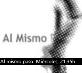
Al mismo paso: Miércoles, 21,35h.