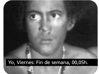
Yo, Viernes: Fin de semana, 00,05h.