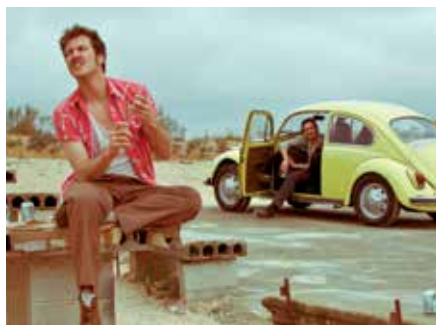
'Wade in the water', de Stefano Ridolfi.

El sábado 14 de junio el Pequeño Teatro del TAM acogerá la última sesión de la temporada 2013-2104 de 'Sanse Cortos en Abierto', con la proyección de los títulos más votados por el público.