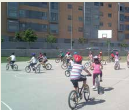
El objetivo de este proyecto es animar a los alumnos a desplazarse al colegio en bicicleta.

U n año más, los alumnos del CEIP Teresa de Calcuta ponen en marcha la actividad ¡Al Cole en Bici! dentro de la programación del área de Educación Física. Esta actividad está dirigida al segundo y tercer ciclo de Educación Primaria y tiene como objetivo animar a los alumnos para que realicen sus desplazamientos al colegio en bicicleta y así vayan adquiriendo durante las sesiones seguridad, destreza y autonomía.