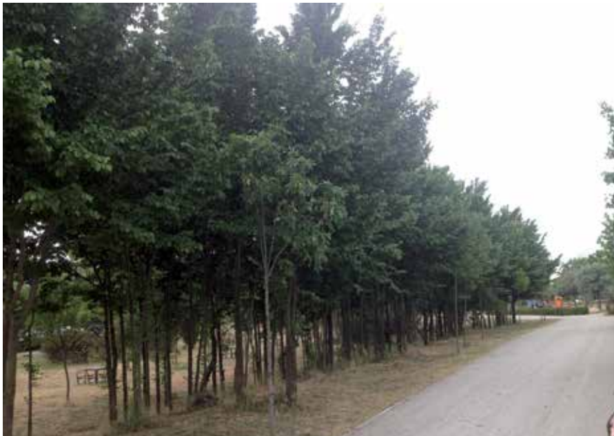
Nuestro municipio es, junto a Aranjuez, las únicas dos ciudades beneficiarias de esta iniciativa.

S an Sebastián de los Reyes es, junto a Aranjuez, las únicas dos ciudades españolas beneficiarias del proyecto "Life+Biodiversidad", una iniciativa medioambiental cuyo objetivo es restablecer el papel que ha desempeñado el