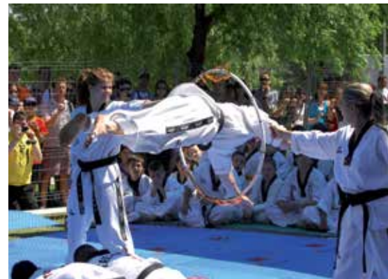
El taekwondo, uno de los muchos deportes de Sanse.