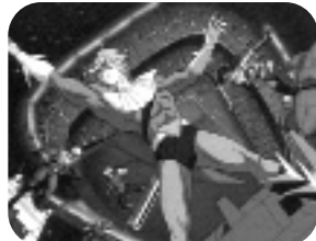
AEROSURFERS. Lunes a viernes, 20.30 h.