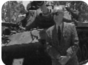
COMBATIENTES DE ULTRAMAR. Martes, 22.20