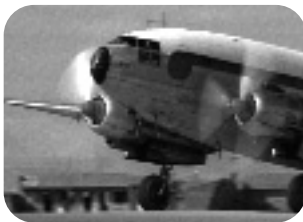
AVIONES CARNICEROS. Lunes 5, 22.20