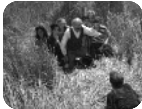
LA NOCHE DE SAN LORENZO. Fin de semana, 00.20