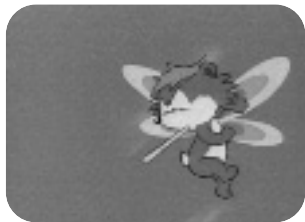
LOS OSOS VOLADORES. Lunes a viernes, 20.05