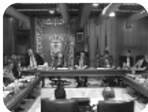
PLENO MUNICIPAL ORDINARIO. Jueves, 19.00