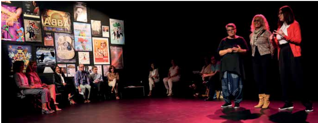
▲ Momento del acto de presentación, que contó con la presencia de la concejala de Cultura, y de técnicos de los departamentos de la Concejalía.

La Agenda Cultural de San Sebastián de los Reyes, editada por la Concejalía de Cultura, presentada en el Pequeño Teatro del Adolfo Marsillach, recoge todas las actividades culturales de la nueva temporada. También incluye varias fechas del mes de enero correspondientes al periodo navideño.