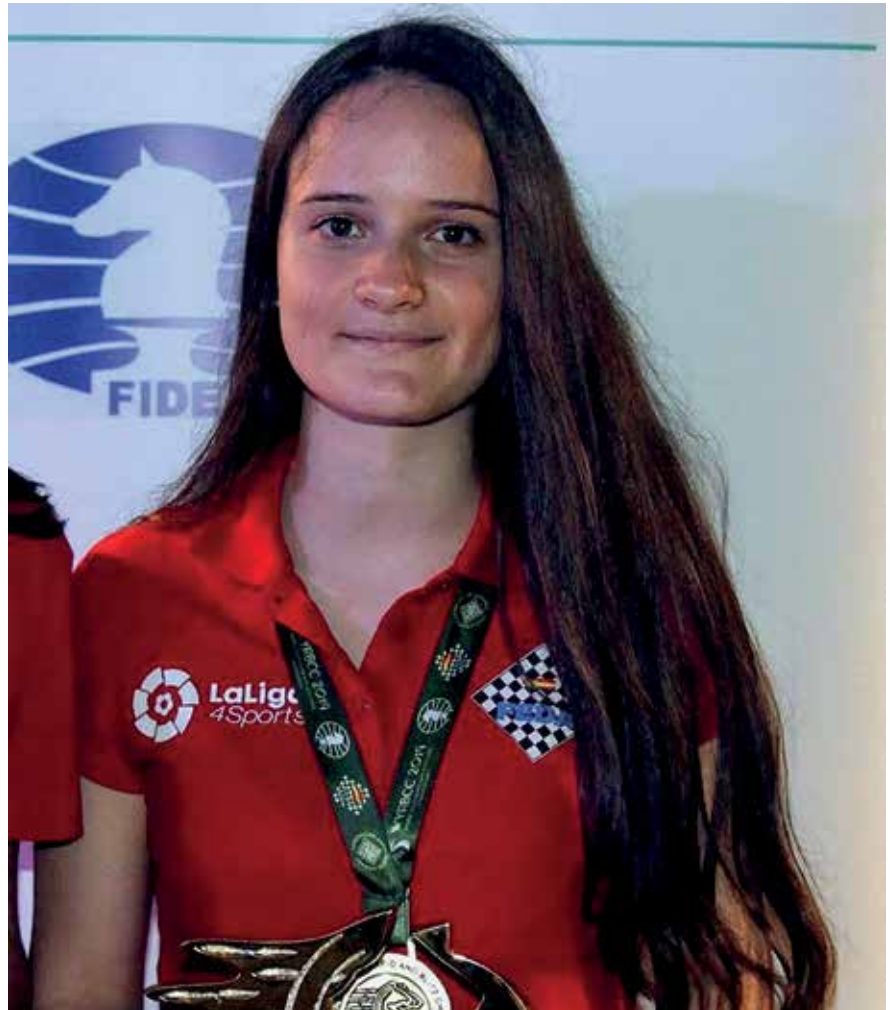
▲ La ajedrecista de Sanse, con la medalla de oro que la acredita como campeona del Mundo.

Les diría que se acerquen al club a informarse de los grupos que hay sin miedo, se puede empezar desde cero a cualquier edad. Aparte de lo que se sabe sobre la mejora en memoria y concentración, te permite hacer muchas amistades y cuando vas a los torneos además de jugar las partidas te lo pasas bien con ellos.