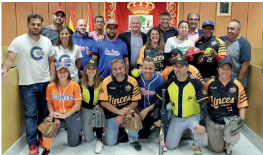
▲ Representantes de los equipos de la Liga Mixta fueron recibidos en el Ayuntamiento.

Linces de Sanse, reunió a los 14 equipos convocados. Los partidos fueron acompañados con música, además de con clases de 'bailoterapia' para los asistentes del público, una disciplina impartida por la asociación '@bailaconnigomadrid'. Varios representantes de los equipos visitaron la misma semana el Ayuntamiento, donde fueron recibidos por miembros del Equipo de Gobierno.