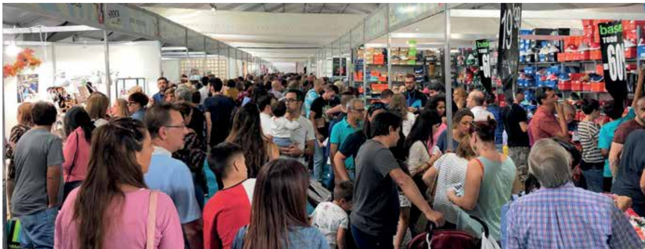
▲ La feria del pequeño comercio local ha batido records de asistencia de público, en comparación con ediciones anteriores.

La feria del estocaje del pequeño comercio ‘Sansesstock 2019’, organizada por el Ayuntamiento, a través de la Concejalía de Desarrollo Local, y las asociaciones empresariales ACENOMA y ANOME y la colaboración de la Comunidad de Madrid, ha ratificado su compromiso con el pequeño comercio local con 24.851 visitas.