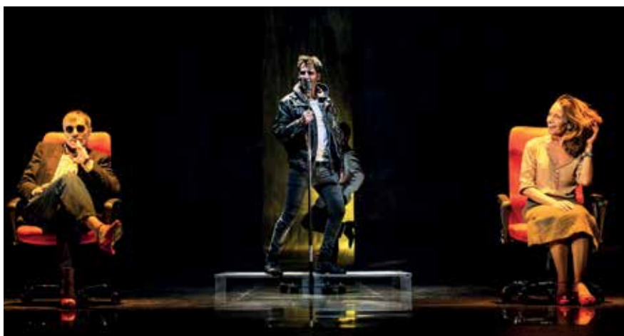
▲ Un fragmento del musical 'A 10 pasos de la fama' fue interpretado durante la presentación.

'Cortos en Abierto' entra ya en la 8ª temporada, lo que ha convertido a este espacio en una referencia obligada para todos los aficionados al cine que sesión tras sesión llenan el salón de proyecciones del Centro Municipal de Formación Marcelino Camacho.