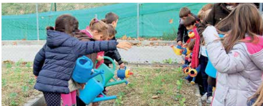
▲ Los niños y niñas del Teresa de Calcuta han sido protagonistas del proyecto premiado.

Se propusieron aumentar la biodiversidad mediante la realización de diversas acciones. Para atraer a los insectos construyeron un tremendo hotel de insectos y en las cercanías colocaron rosales que también ayudan a que los insectos se acerquen. Además, han añadido dos terrazas de plantas aromáticas que les prestan su olor y riqueza para disfrute de los sentidos. La acción más representativa que han conseguido llevar a