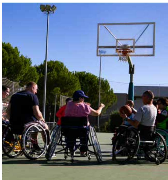
▲ Todos los asistentes pudieron disfrutar de una mañana soleada llena de actividades. Las personas discapacitadas de Sanse forman un buen equipo.