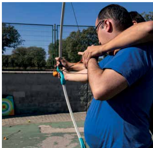
▲ Tiro con arco: dar en la diana se hace más fácil si te ayudan.