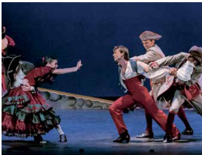
▲ 'El sombrero de tres picos', el sábado 19, a las 20 h. en el TAM.