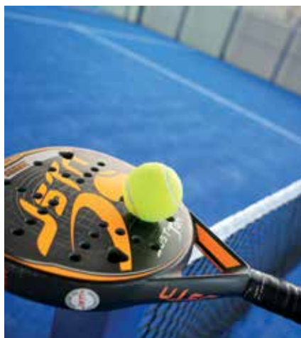
▲ IX Torneo de pádel benéfico, el sábado 19.

Esta Asociación comienza un nuevo curso de teatro musical que termina en junio de 2020. Las clases se impartirán en el Centro Socio Cultural Pablo Iglesias de San Sebastián de