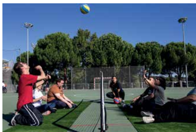
▲ El 'sitting voley' recibió una gran acogida entre los participantes.