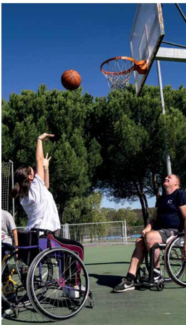
▲ Lanzamiento a canasta durante un partido de Baloncesto en silla de ruedas.

El Ayuntamiento, en colaboración con la Asociación de Clubes Deportivos de Sanse y la Fundación FDI, organizó el día 3 las Miniolimpiadas por la Integración, en el Polideportivo Dehesa Boyal, que proponía a los ciudadanos que acudieron al complejo municipal ponerse por un rato en el lugar de las personas con discapacidad física e intelectual. La experiencia fue todo un éxito, tanto de participación como de concienciación.