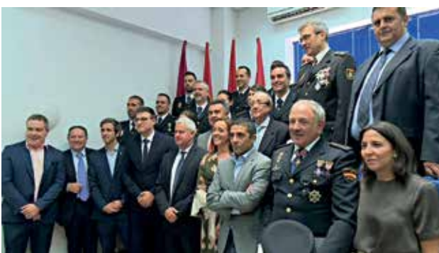
▲ Los agentes condecorados, con las autoridades municipales.

La Comisaría de San Sebastián de los Reyes y Alcobendas albergó la celebración del día de los Ángeles