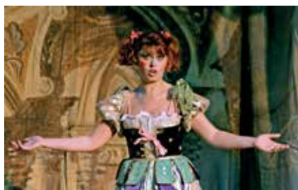
▲ Momento de la ópera italiana.

De hecho, el libreto lo escribió el propio Leoncavallo, basado en un suceso que ocurrió en Calabria siendo el padre del compositor el juez encargado de esclarecer un crimen por celos.