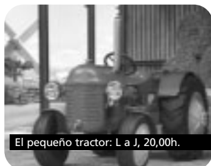
El pequeño tractor: L a J, 20,00h.