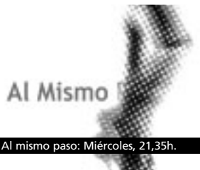
Al mismo paso: Miércoles, 21,35h.