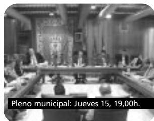
Pleno municipal: Jueves 15, 19,00h.