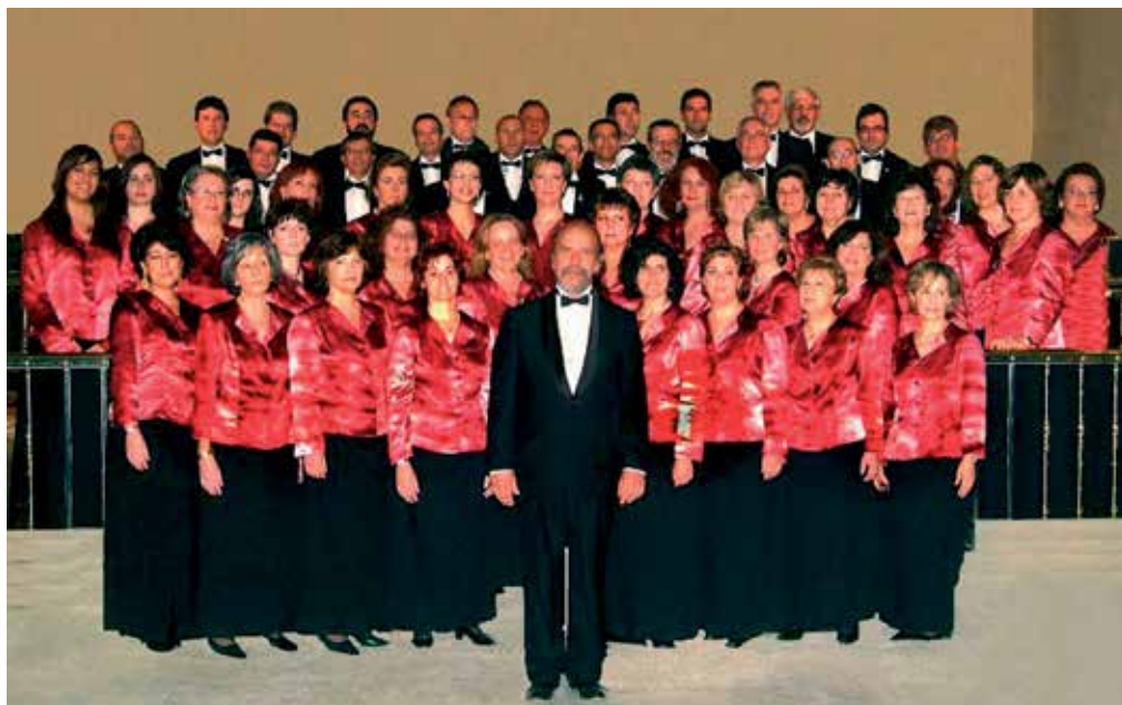
La coral de Sanse celebra su XX aniversario con el espectáculo "20 años no es nada", el domingo 12 a las 20 h. en el TAM.