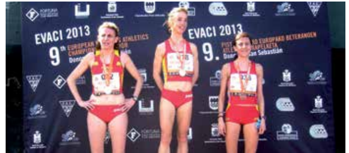
La atleta sansera con la medalla de oro colgada al cuello que la certifica como campeona de Europa de cross en su categoría.

Este verano me centraré fundamentalmente en pruebas de ruta y pista (desde el 1.500 m.l. hasta el