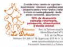
Veterinaria La Dehesa