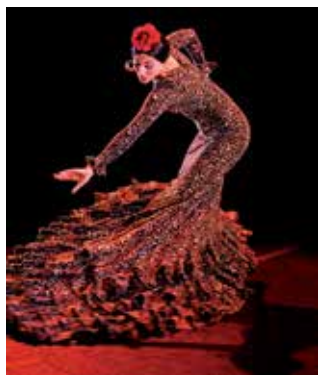
Una revisitación a los orígenes del flamenco, el sábado 11 en el TAM.