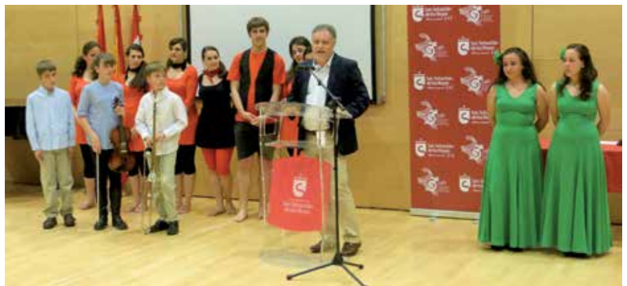
El alcalde felicitó a los responsables del centro por el buen trabajo realizado durante todos estos años.

También se proyectó un vídeo, elaborado por Canal Norte TV. Digit@!, en el que se recogen los momentos más importantes de la institución, por la que ya han pasado 14.000 alumnos, en su mayoría niños y adolescentes que han disfrutado de los fines educativos, culturales y musicales de la escuela además de aprender el valor del esfuerzo y del trabajo colectivo. Este trabajo incluye testimonios de antiguos y actuales profesores, padres y alumnos que explican el crecimiento de la Escuela desde 1993, cuando comenzó sus actividades en el edificio de la Universidad Popular, hasta la sede