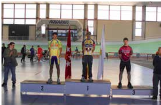
Los chicos del Sanse-Spiuk han brillado a gran altura en Galapagar.

La UCSSReyes comenzó su temporada de competición en Pista en el velódromo de Galapagar, escenario de los Campeonatos de Madrid de categoría Junior, Elite-Sub23 y el ensayo de los Cadetes y las Escuelas.