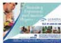
La Marina Centro de día y Residencia