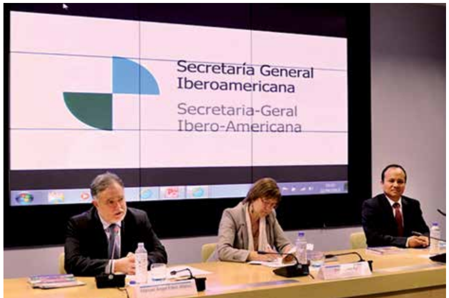
El alcalde subrayó la aportación que viene haciendo nuestra ciudad a los proyectos de cohesión social y territorial en municipios de países en vías de desarrollo.

La intermunicipalidad se sitúa en el libro como una forma innovadora de organización política, social y administrativa para la transformación del territorio a través de la participación. La estrategia de la go-