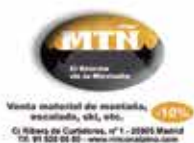
El Rincón de la Montaña