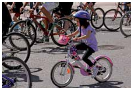
La fiesta de la bici está abierta a un público de todas las edades y condición.

Familias al completo, como la edición anterior, están invitadas el domingo 12 de mayo para tomar la salida al mediodía en el parking de