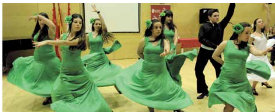
Una representación de las alumnas y alumnos de la Escuela Municipal de Danza llevó a cabo un número que hizo disfrutar a todos los que acudieron al acto conmemorativo.