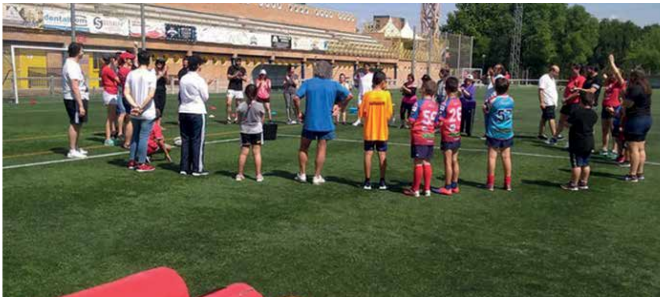
▲ Las instalaciones del Dehesa Boyal sirvieron como escenario para multitud de juegos y actividades organizadas por el Club XV Sanse Scrum Rugby.

Jornada inclusiva en el Polideportivo Municipal Dehesa Boyal, el 22 de junio