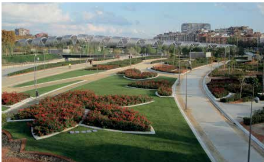
▲ Visitas a Madrid Río, norte y sur, el jueves 4 y el martes 9.

España hasta Metro Lago. Distancia 7 km. 20 plazas. Transporte público en Metro. Salida desde Metro Baunatal a las 18:00 h, vuelta a las 23:00 h. Inscripciones a partir del 8 de julio hasta completar plazas. Precio teleférico: 5 euros.