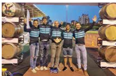
▲ Componentes del equipo.

El equipo Trientrenos, que cuenta con una treintena de miembros, destaca por