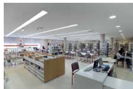
▲ Biblioteca Claudio Rodríguez.