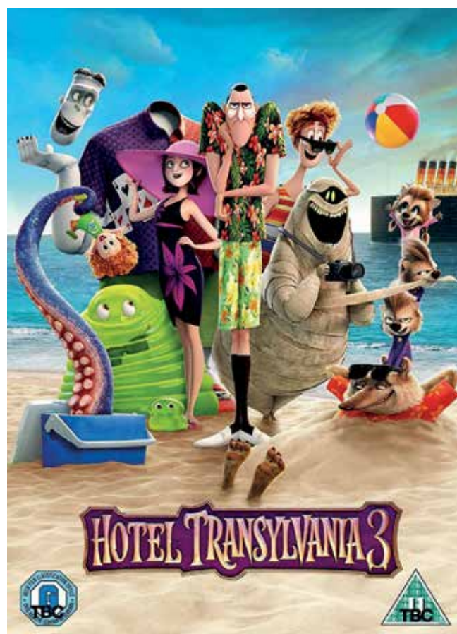
▲ 'Hotel Transilvania 3', el sábado día 20 a las 22:00 h. en el Anfiteatro.

Bibliotecas municipales Julio y agosto 2019