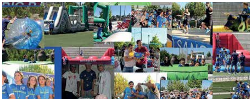
▲ Los campos de fútbol Dehesa Vieja se llenaron con juegos, actividades y muchos premios.

El sábado 15 de junio el Club Juventud Sanse de fútbol celebró la fiesta de final de temporada 2018/19. En esta ocasión, la entidad deportiva sustituyó el tradicional torneo final por categorías, por una fiesta para todos los que forman parte del Juventud Sanse. El fútbol se combinó con juegos, actividades, entrega de premios, etc, para que los participantes disfrutaran de un gran día.