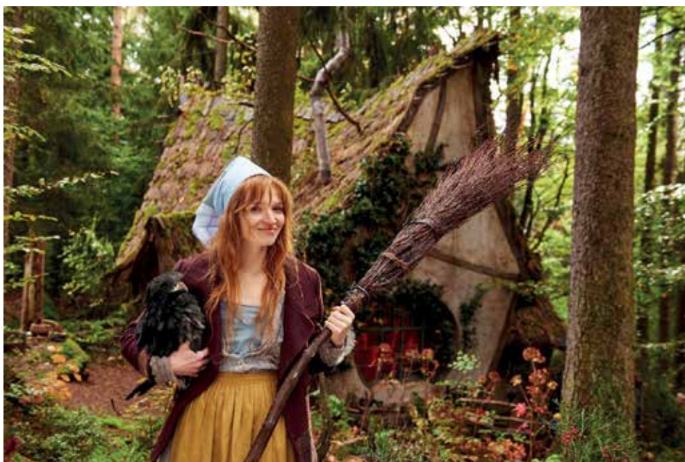
▲ 'La pequeña bruja', cine de verano el sábado día 13 a las 22:30 h. en el Anfiteatro de La Marina.