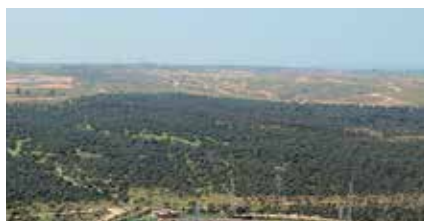
▲ Vista aérea de la Dehesa Boyal.

De clima continental, y con una cota máxima de 717 metros de altitud, nuestro encinar fue declarado de utilidad pública en 1931. Aunque su uso recreativo haya hecho que disminuya la fauna, todavía se observa en ella una gran cantidad de especies que la convierten en un bosque singularmente rico. La Reserva de la Biosfera de la Cuenca Alta del Manzanares hasta ahora tenía una superficie total de 46.778 hectáreas, siendo la mayor de las dos Reservas de la Biosfera de esta región (la segunda es la Sierra del Rincón, declarada por la UNESCO en 2005 y con una superficie de 15.230