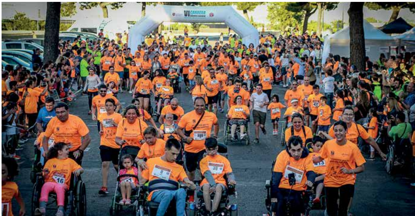
▲ Salida de la carrera, un evento social que sirve cada año para visibilizar a un colectivo que reivindica así la inclusión a través del deporte.

Casi 1.000 vecinos se dieron cita en el Parque de La Marina, el 14 de junio