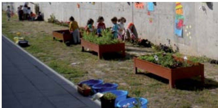
Los niños desarrollan, con estas actividades, una actitud de respeto hacia el medio ambiente y además aprenden y se divierten.

El programa municipal "Ecoescuelas" continúa incrementando los seguidores para la causa de la educación medioambiental en los colegios de San Sebastián de los Reyes. La escuela infantil Sanserito y el colegio concertado Trinity College clausuran estas actividades escolares, organizadas por la Fundación Europea para la Educación Medioambiental (FEEM) y la Concejalía de Medio Ambiente.