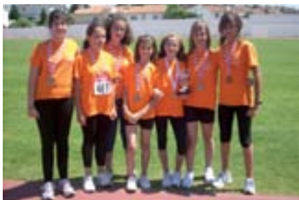
Las chicas alevines del CEIP Enrique Tierno Galván.

T ras quedar campeones en los Juegos Municipales de Atletismo Escolares, todos los equipos que participaron en el Campeonato de Atletismo por Equipos (Serie Básica) de la Comunidad de Madrid tuvieron una muy buena actuación. Destacando el primer puesto del I.E.S. Torrente Ballester en cadete masculino y las segundas posiciones del CEIP Enrique Tierno Galván en alevín femenino y del I.E.S. Joan Miró en cadete femenino. ●●●