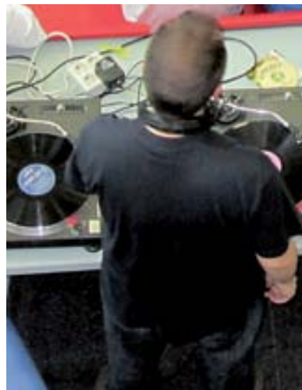
Entre los cursos y talleres ofertados, hay uno muy interesante de Dj's.