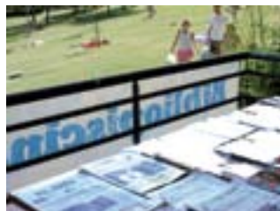
Disfruta de la lectura en la piscina del Polideportivo Dehesa Boyal.

Hasta el 30 de junio Hall Biblioteca Central Proyección audiovisual a cargo de GEDEI.