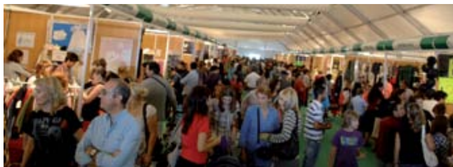
Esta feria se ha convertido en el encuentro multisectorial urbano más importante de la Comunidad de Madrid.

El Ayuntamiento ya prepara la que va a ser la quinta edición de Sansestock que, como todos los años, se celebra durante el primer fin de semana de octubre, del 30 de septiembre al 2 de octubre, en el Recinto Ferial del Parque de la Marina.