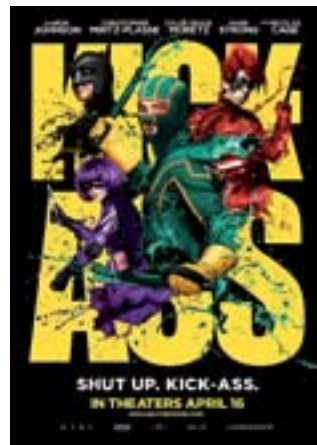
"Kick ass", en el Centro Joven.