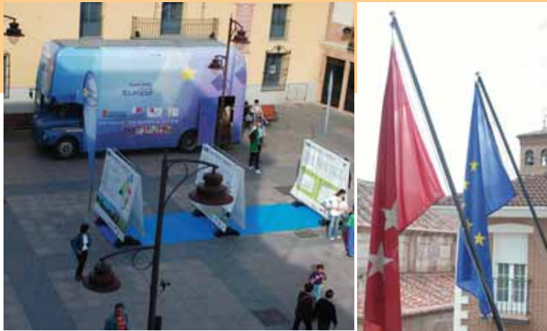
La Plaza de la Constitución se convirtió en el centro de operaciones de un autobús que informó sobre las instituciones de la Unión Europea.