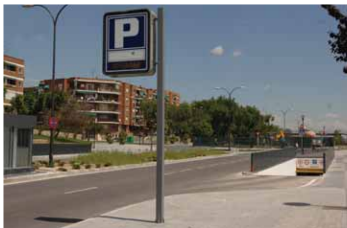
El Ayuntamiento ha puesto el empeño en facilitar los estacionamientos en la zona centro con este aparcamiento en el paseo de Europa.