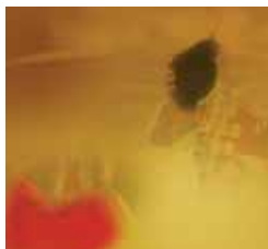
El Trincherazo. Lunes 9, 20,15 h.

13,00 Felices para siempre 13,30 La casa de Gloria 14,00 La cocina de M. Bermejo 14,15 Amarte es mi pecado 15,00 Matrícula 16,00 Atei 20,00 Boletín informativo 20,10 Agenda Municipal 20,15 El Trincherazo 21,20 Dkda, sueños de juventud 21,40 Matrícula 22,15 Boletín informativo 22,25 Culturalia 22,55 Historias del otro lado