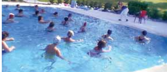
Los usuarios que no tengan el superabono podrán optar por la entrada diaria o por bonos de temporada.

LA TEMPORADA EMPIEZA EL 31 DE MAYO Y ACABA EL 31 DE AGOSTO