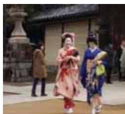
Diario de Japón Miércoles, 23,20 h.