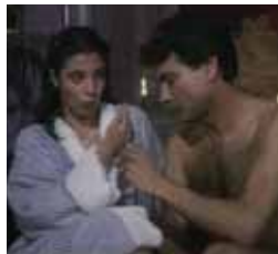
Historias del otro lado Lunes, 23,10 h.

13,00 Felices para siempre 13,30 La casa de Gloria 14,00 La cocina de M. Bermejo 14,15 Amarte es mi pecado 15,00 Matrícula 16,00 Atei 20,00 Boletín informativo 20,10 Agenda municipal 20,15 Felices para siempre 20,40 La casa de Gloria 21,10 La cocina de M. Bermejo 21,35 Dkda, sueños de juventud 22,00 Matrícula 22,30 Boletín Informativo 22,40 Culturalia 23,10 Historias del otro lado