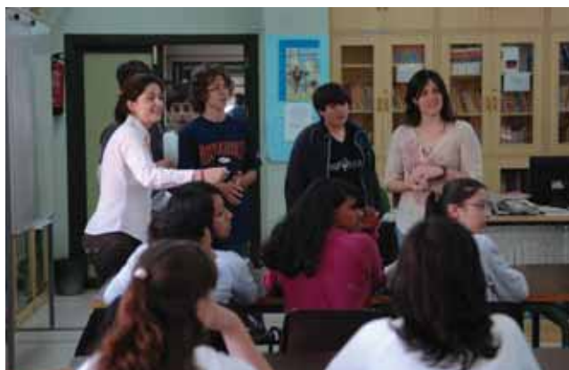
Los alumnos del centro Julio Palacios han conocido directamente la realidad del fenómeno migratorio con chavales extranjeros de su edad.

Estos conocimientos indispensables para comprender el fenómeno migratorio son complementados con los que describen el papel de la admi-