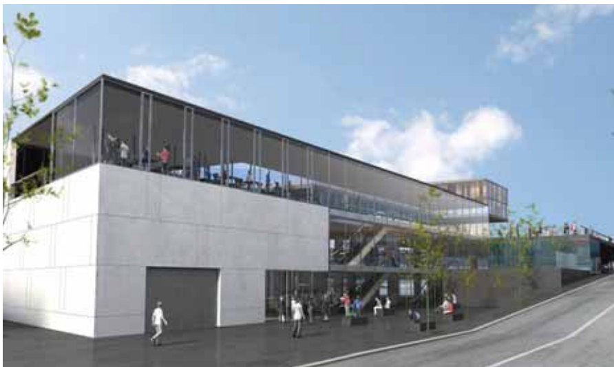
El polideportivo de 'La Viña' contará, entre otros servicios, con una piscina cubierta con SPA.

'LA VIÑA', APARCAMIENTO DEL PASEO DE EUROPA Y REGULACIÓN DE LOFTS