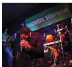
Agenda municipal Lunes a Viernes, 20,10 h.

13,00 Felices para siempre 13,30 La casa de Gloria 14,00 La cocina de M. Bermejo 14,15 Amarte es mi pecado 15,00 Matrícula 16,00 Atei 20,00 Boletín informativo 20,10 Agenda municipal 20,15 Felices para siempre 20,45 La casa de Gloria 21,10 La cocina de M. Bermejo 21,35 Dkda, sueños de juventud 22,00 Matrícula 22,35 Boletín informativo 22,45 La Cajablanca Live 23,15 Diario de Japón 23,45 Jangal