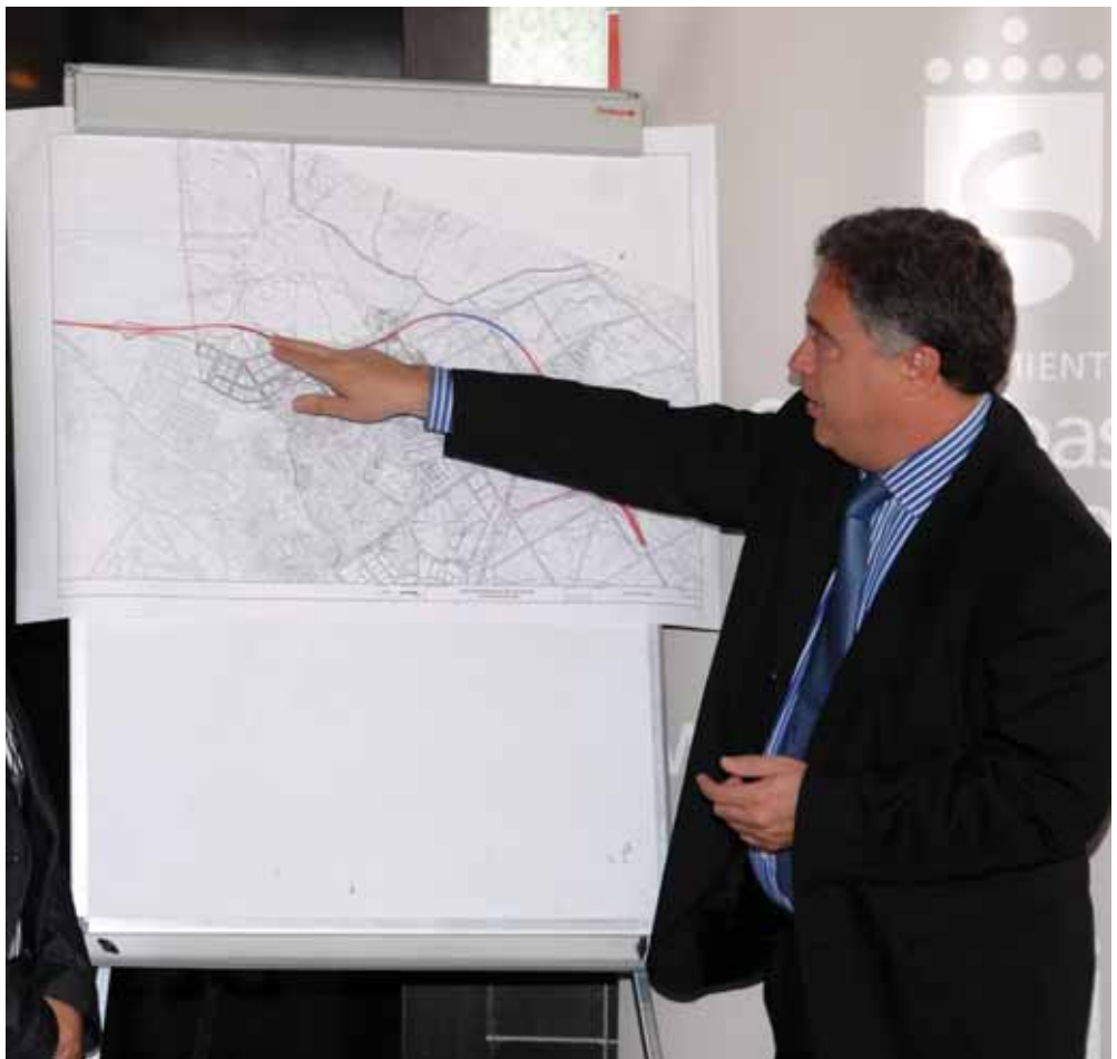
El alcalde señala y explica el trazado de la futura M-61, es decir, del segmento del cierre norte de la M-50 que discurrirá por el término municipal de San Sebastián de los Reyes.

Asimismo, la M-61 evitará la afeción a los acuíferos, que en esta zona son muy importantes. “Hemos de conjugar un trazado complejo, con el respeto a los flujos de agua subterráneos, fundamentales para la vegetación y la riqueza arbórea de la Dehesa Boyal”. Por otro lado, el alcalde estimó necesaria la nueva vía de circunvalación, que unirá la A-1, la M-607 y la A-6, “con lo cual nos ahorraremos tiempo y consumo de combustible, aspectos ambos