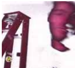
La pandereta eléctrica Viernes, 00,10 h.