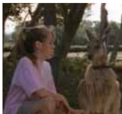
Skippy. Martes, 22,45 h..