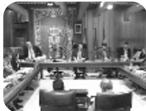
PLENO DE INVESTIDURA Viernes, 20,00