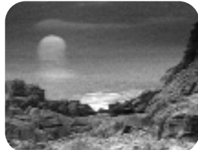
OCÉANOS. LUNES 22,30