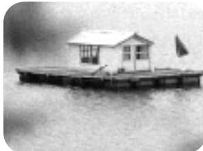
LA ISLA. Viernes, 00,25