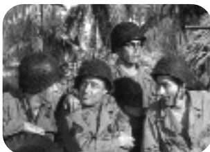
BATALLÓN SUICIDA. Fin de semana, 16,30