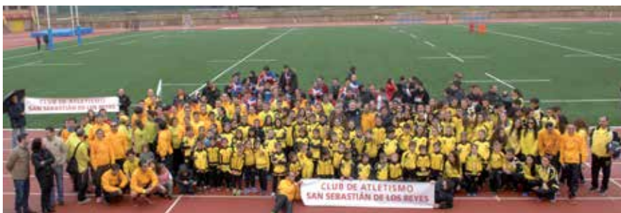
El Club de Atletismo S.S. Reyes-Centros Clínicos Menorca, en el recién reformado estado de atletismo.

El último fin de semana de noviembre se inauguraron oficialmente las nuevas instalaciones de atletismo y del campo de rugby en el Polideportivo Municipal Dehesa Boyal. El acto estuvo presidido por el alcalde de San Sebastián de los Reyes, Manuel Fernández Mateo, y varios concejales del equipo de Gobierno que participaron junto a los miembros del Club de Atletismo S.S. Reyes-Centros Clínicos Menorca y del equipo de XV Rugby Sanse Scrum, de una gran cita deportiva en el que, arropados por familiares, amigos,