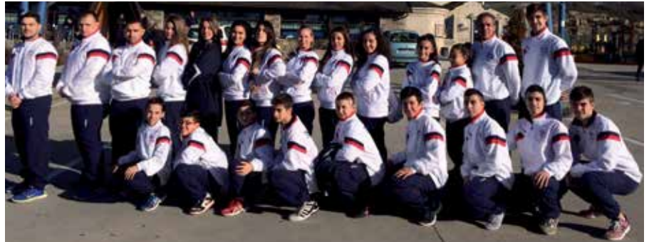
El equipo del Hankuk en el reciente Campeonato de España, donde el club cosechó 11 medallas.

Como en las dos ediciones anteriores, el Club Hankuk International School, con escuela de Taekwondo en el Centro Municipal La Viña, realizará entre Navidad y Año Nuevo un evento internacional donde los deportistas de Sanse tienen la oportunidad de realizar un intercambio con taekwondistas de todo el mundo. En esta ocasión participarán deportistas y entrenadores de 18 países, 26 clubes y alrededor de 200 competidores de reconocido prestigio internacional. El espectáculo, que tiene como principal objetivo promover el taekwondo en nuestra ciudad, ha sido diseñado para enseñar y divertir al público asistente. Los entrenamientos se realizarán durante cuatro días en el Pabellón Deportivo Municipal Valvanera (Avenida de la Sierra, s/n). También, y en paralelo, se desarrollarán actividades en las instalaciones del Centro Deportivo Municipal Viña Fitness. Como antesala de este evento, el 6 y 7 de