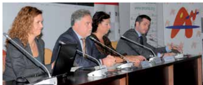
Representantes municipales y de las organizaciones empresariales inauguraron un encuentro que se está consolidando edición tras edición.

El Centro de Formación Municipal acogió la IV Semana del Emprendedor y el Empleo de San Sebastián de los Reyes, organizada por el Ayuntamiento, la Asociación de Empresarios de la Zona Norte, (ACENOMA), la Asociación Norte de Mujeres empresarias (ANOME) y la Cámara de Comercio de Madrid.