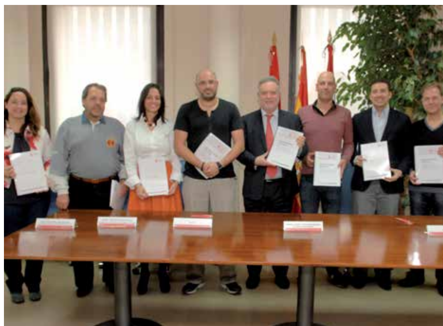
Los firmantes del Acuerdo/Convenio 2015/2018 que garantiza los derechos de los empleados públicos municipales.

“Se trata de un acuerdo alcanzado después de un largo trabajo, más de dos años, y un esfuerzo de acercamiento muy importante de todas las partes firmantes”, explica el alcalde, Manuel Ángel Fernández Mateo, tras firmar el nuevo Acuerdo-Convenio con los sindicatos.