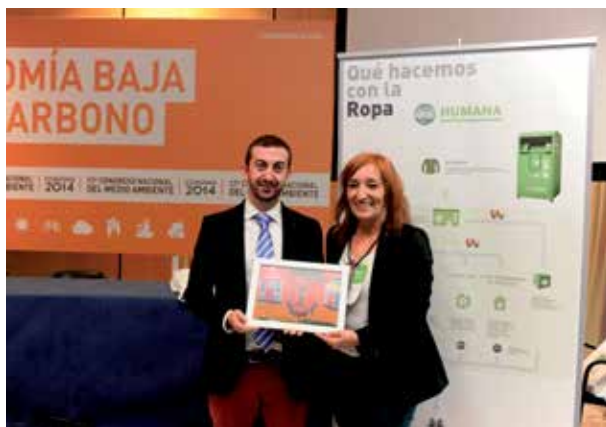
El concejal de Medio Ambiente recibe el premio de la responsable de 'Humana'.

'Humana Fundación Pueblo para Pueblo' promueve la protección del medio ambiente y lleva a cabo programas de cooperación en África, América Latina y Asia. En España mantiene un proyecto de ayuda social financiado con la comercialización de unas 18.000 toneladas de textil usado. Utiliza para su recogida una