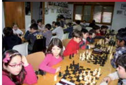
El ajedrez, una actividad muy buena para los niños.

Los sábados 17 y 24 de enero se celebrarán los Juegos Municipales de Ajedrez. Los niños y niñas ajedrecistas de nuestra localidad, distribuidos en varias categorías, lucharán por ser los mejores del tablero. El sistema es suizo a seis rondas. Los prebenjamines y benjamines jugarán el día 17 a las 10 horas. Los alevines, infantiles y cadetes, el día 24 a las 10 horas. El lugar es el Centro Sociocultural Claudio Rodríguez (C/ Maximiliano Puerro del Tell s/n). Los cuatro primeros clasificados, tanto masculinos como femeninos, pasarán a disputar la fase de Área 5, fase previa al Campeonato de la Comunidad. ●●●