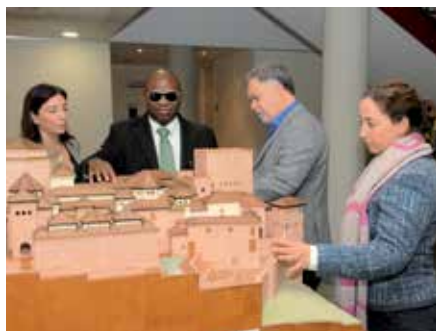
El alcalde, las concejalas y el responsable de la ONCE en el municipio.

Este es un espacio concebido para que sus visitantes puedan ver y tocar las piezas expuestas. Lo que realmente hace original y único a este museo es su origen: la decisión de sus usuarios, personas invidentes de satisfacer las necesidades culturales de las personas con discapacidad visual grave. Para lograrlo, se diseña un museo a la medida de sus necesidades, como muestra de los esfuerzos de integración y normalización perseguidos por la ONCE.