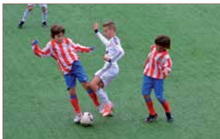
Participarán los mejores equipos de la Comunidad.

La Unión Deportiva San Sebastián de los Reyes y el C.D. Carranza han organizado sendos torneos solidarios para las fiestas navideñas, que tienen como fin común ayudar para que los más pequeños puedan cumplir su ilusión en estas fiestas.