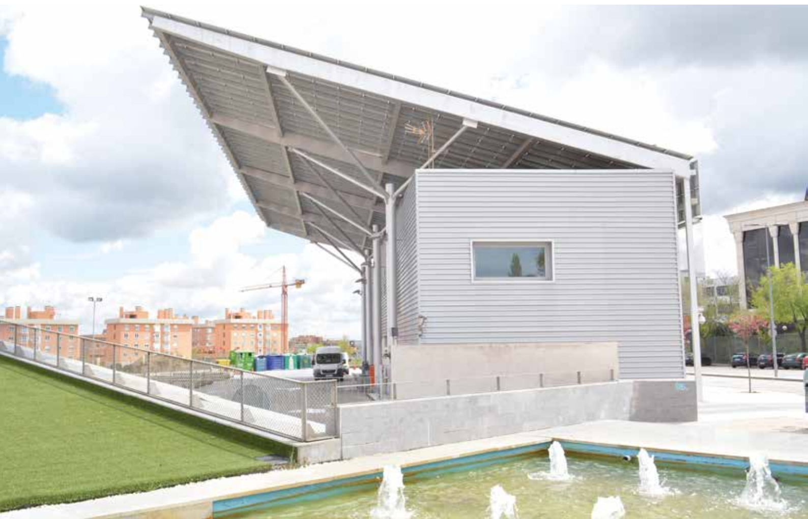
▲ El nuevo centro va a suponer un aumento del aprovechamiento del espacio público en Dehesa Vieja.

Inauguración del Centro Cívico en Dehesa Vieja y estreno del auditorio y la terraza del Centro de Formación