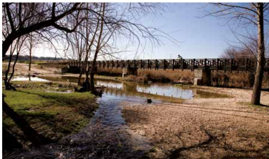
▲ La jornada del 25 de septiembre está dirigida a familias en la zona del Arroyo de Viñuelas.

La cooperación entre la Concejalía de Medio Ambiente y Decathlon ha hecho posible una jornada de 'geoca-