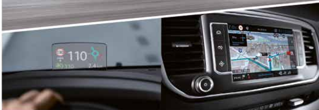
HEAD UP DISPLAY