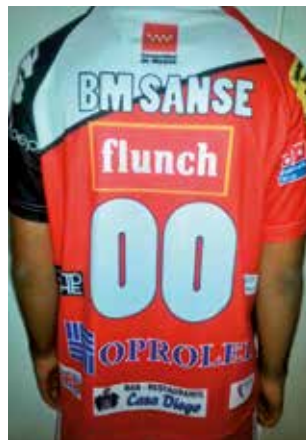
▲ Vista trasera de cómo será la equipación para esta nueva temporada.

El fin de semana del 24 y 25 de septiembre se presentarán los 19 equipos de la estructura de tecnificación del Club. Todos estos conjuntos iniciarán su preparación con los encuentros de esta