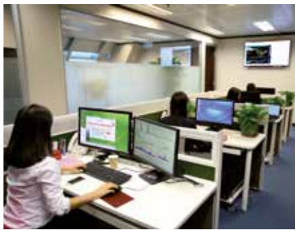
▲ Sanse ha disminuido el paro en agosto.

El incremento del desempleo en España durante el mes de agosto no parece haber afectado sustancialmente a San Sebastián de los Reyes, que ha disminuido en 21 personas su cifra de paro. Dicha reducción sitúa el número total de parados en 4.942. Además de este descenso mensual, el paro baja en 455 personas con respecto al mes de agosto de 2015, lo que supone un descenso interanual de un 8,43%.