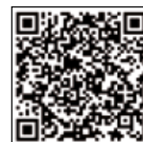
"Sigue el video en Canal Norte con tu móvil"

El recinto ferial se transforma en la gran terraza del street food con 15 gastronetas que ofrecen las últimas tendencias nacionales e internacionales de la comida callejera, con especial atención a su vertiente más saludable. Bollos de pan chino al vapor, chicharrones de pescado y papas cocidas con crema de galleta. Será una oportunidad para probar la hamburguesa vegetal de garbanzo y a la de pulpo a que se suman las de bisonne americano, vaca retinta andaluza y buey gallego, entre otras especialidades 'street'.