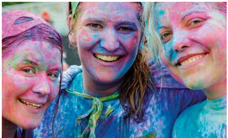
▲ La fiesta de inauguración ofrecerá multitud de divertidas actividades.

La inauguración terminará con el escrutinio de la urna de votación y la proclamación del nombre con el que se designará el centro, una vez sumados los votos presenciales y los votos electrónicos.