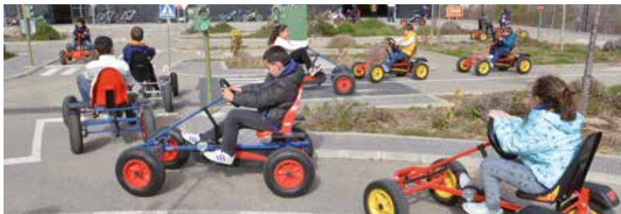
▲ Los talleres formativos tienen como objetivo que los más pequeños se introduzcan en la educación vial.

A la constitución de la mencionada comisión se añade como iniciativa el reparto de una carta elaborada por la Policía Local entre colegios, AMPAS y directores. Esta misiva expone consejos prácticos de movilidad dirigidos fundamentalmente al entorno escolar con la finalidad de reducir la concentración de vehículos en las inmediaciones de los colegios, de facilitar