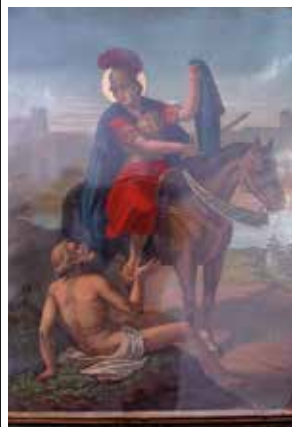
▲ San Martín de Tours ofrece la mitad de su capa a un mendigo.

Una de las representaciones iconográficas más populares de tiempos ya muy pretéritos, es esta que reseñamos: San Martín de Tours ofreciendo la mitad de su clámide (capa) a un mendigo. Cuenta la leyenda, que a la noche siguiente se le apareció Jesucristo vestido con la media capa de la que se desprendió para agradecerle su gesto. Martín, soldado romano a la sazón, decide abandonar el ejército del César para convertirse al cristianismo (año 371).