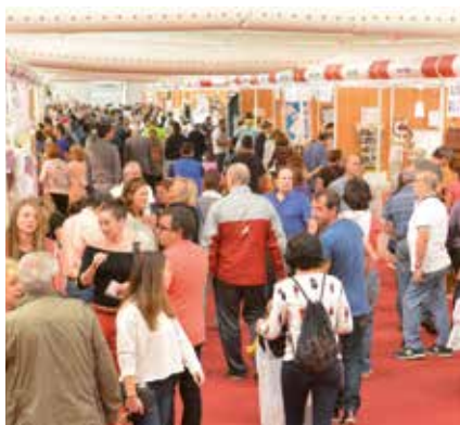
▲ 'Sansestock' es la feria de comercio local referencia en la zona norte de Madrid.

D el viernes 30 de septiembre al domingo 2 de octubre, el recinto ferial del Parque La Marina acoge la feria Sansestock 2016, en la que 52 comercios locales participan en el que está considerado como el encuentro multisectorial de referencia de la zona Norte de la Comunidad de Madrid. En su décimo aniversario, se convierte en un evento para toda la familia, con la ampliación de su oferta de ocio y programa de actividades con food trucks, música y demostraciones interactivas.