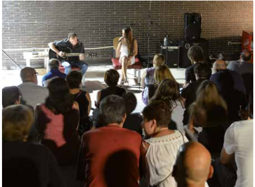
▲ La terraza es un espacio abierto de 161 m2 que puede ser utilizado para una entrega de premios, zona chill out o presentaciones.

Ambos espacios fueron inaugurados con la actuación de SIVANA, grupo que