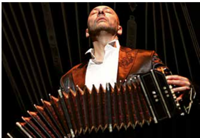
▲ 'Che Bandoneón', un homenaje a los grandes bandoneístas, el domingo 25 en el TAM.