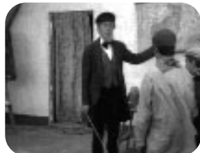
LA BARRACA Viernes, 22,40 h.