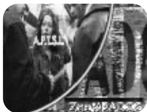
ZOOMBADOS. Viernes, 23,35 h.