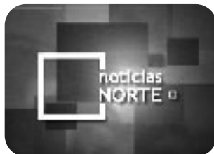
BOLETIN INFORMATIVO Lunes a viernes, 20,00 h.