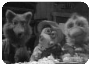
LA GALLINA Y SU PANDILLA Lunes a viernes, 20,10 h.