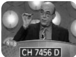
MATRICULA Lunes a viernes, 22,00 h.