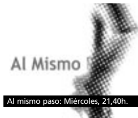
Al mismo paso: Miércoles, 21,40h.