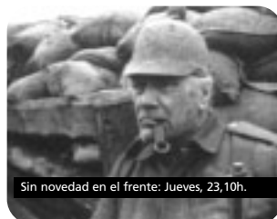
Sin novedad en el frente: Jueves, 23,10h.