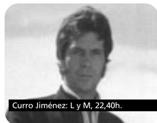
Curro Jiménez: L y M, 22,40h.

13,30 EL PEQUEÑO TRACTOR ROJO 13,40 PEQUEÑO HIPO 14,00 SABER RAIDER 14,30 LA COCINA DE PEDRO SUBIJANA 14,40 LOS PINCHEIRA 16,00 EL PUEBLO ES LA CULTURA 16,30 LOS IMPRESCINDIBLES 17,00 CINE EN LA ESCUELA RABIA INTERIOR 18,30 EL PEQUEÑO TRACTOR ROJO 18,40 PEQUEÑO HIPO 19,10 SABER RAIDER 19,30 MISIÓN SOS 19,55 LOS PINCHEIRA 20,40 LA COCINA DE PEDRO SUBIJANA 20,50 BOLETÍN INFORMATIVO 20,55 AL MISMO PASO 21,30 UN MUNDO APARTE 21,55 CURRO JIMÉNEZ