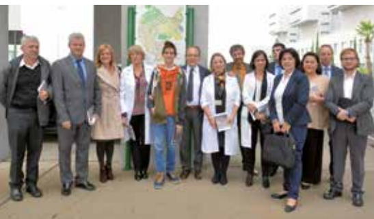
▲ Responsables municipales y del Hospital.

El Ayuntamiento y los Servicios de Neumología, Rehabilitación y Endocrinología del Hospital Infanta Sofía han diseñado, en colaboración con Oximesa, los 'Paseos terapéuticos', un programa integral de rehabilitación de pacientes con afecciones respiratorias en el que interviene el tratamiento neumológico, un adecuado nivel nutricional y la fisioterapia respiratoria.