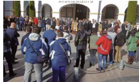
▲ Minuto de silencio por la víctima fallecida.