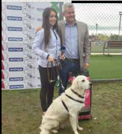
▲ El alcalde con una de las participantes.

Un domingo de lluvia pero también de diversión. Así transcurrió en nuestra ciudad la segunda edición del Canicross Benéfico en favor de la Fundación Benjamín Mehnert, que recoge, recupera y da en adopción animales abandonados. A primera hora fueron llegando los participantes de la carrera profesional. Un minuto después de dar la salida, empezó a diluviar. Durante la carrera popular e infantil, la lluvia cesó, aunque era difícil esquivar los charcos. Todos los participantes llegaron con una sonrisa a la meta, a pesar de haberse mojado, pisado charcos o mancharse de barro. El ambiente, en definitiva, fue estupendo. Este evento ha contado con el apoyo del Ayuntamiento y la colaboración de Vías Pecuarias de la Comunidad de Madrid, Hospital Veterinario Madrid Norte, Decathlon, Santalucía Seguros, Vallekanino, Raposo, Tiendanimal (Alcobendas) y Heineken.