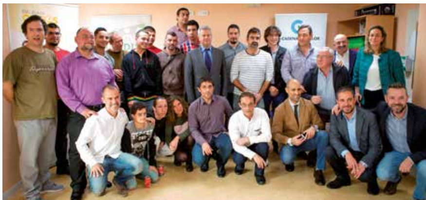
▲ Los 15 nuevos titulados junto al alcalde y otros representantes municipales.

La sede de la Asociación APADIS ha acogido la entrega de diplomas a los 15 jóvenes con discapacidad intelectual que han participado en la Escuela de Oficios desarrollada por Ferroviario Servicios, tras el acuerdo suscrito con el Ayuntamiento, ACENOMA y Cadena de Valor. Los 15 diplomados han recibido una formación reglada en un oficio, lo que aumenta sus posibilidades de lograr un empleo en el futuro.