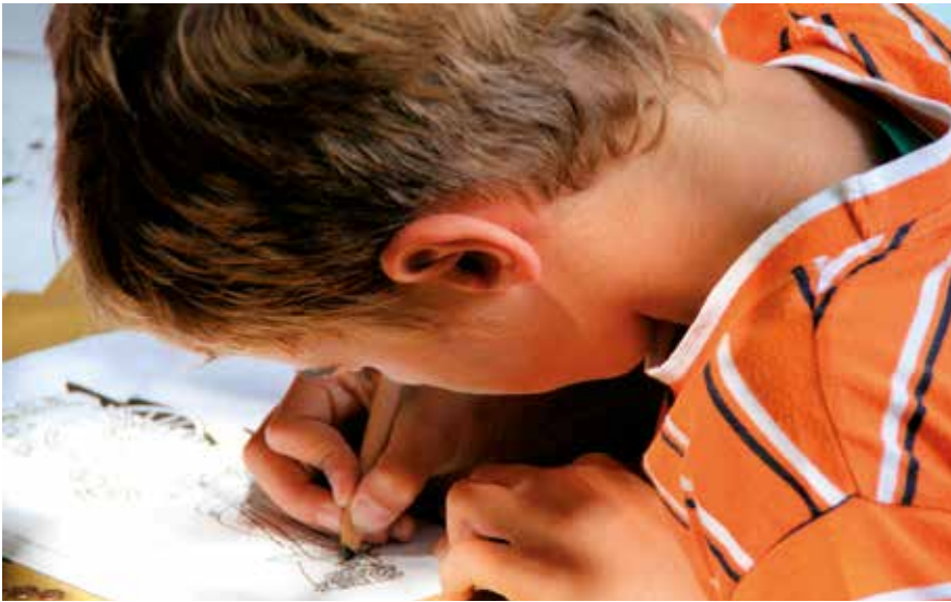
▲ Este concurso está enfocado para sensibilizar a niños y padres sobre un consumo responsable.

El Ayuntamiento, a través de las concejalías de Infancia y Consumo, organiza el concurso infantil 'Dibuja tu juguete favorito y etiquétalo', dirigido a niños de 6 a 14 años. Se elegirán 12 dibujos que decorarán un calendario de 2017 con consejos de consumo y que se distribuirá con la revista La Plaza.