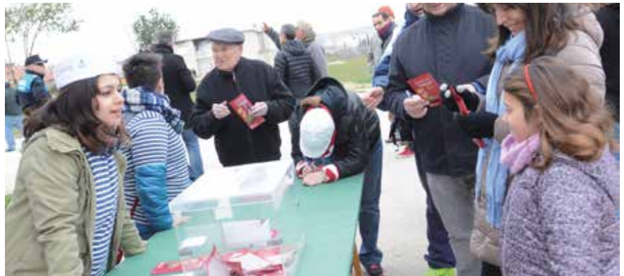
▲ Este proyecto ha estado abierto a la participación de todos los ciudadanos.

Dicho taller busca analizar proyectos que supongan un impacto positivo en el de-