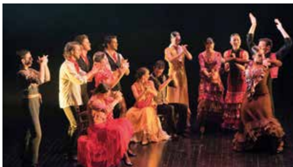
▲ 'Arat, De Fellah-Mangú a Flamenco', el sábado, 25, en el TAM.