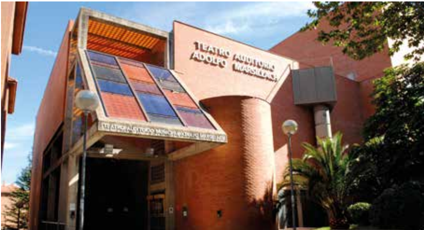
▲ Fachada del Teatro Adolfo Marsillach (TAM).

El Ayuntamiento ha renovado recientemente el contrato del servicio del personal de sala del Teatro Auditorio Municipal 'Adolfo Marsillach' (TAM), gracias al cual el salario de los empleados que atienden al público se ha incrementado una media del 22,5 por ciento.