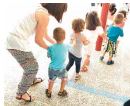
▲ Una de las ciudadanas, con los niños y niñas.

poniendo a disposición de las familias y de los centros escolares este servicio durante el horario lectivo y a lo largo de todo el curso escolar. Esta iniciativa atiende los casos en el menor tiempo posible y deriva al servicio adecuado a las familias de los niños y niñas que no controlen los esfínteres de forma regular. Más información, en la Sección de Educación, Av. Baunatal 18, Tel. 91 658 89 93/99; educacion@ssreyes.org. De lunes a jueves, de 9:00 a 14:00 h y de 16:45 a 18:45 h.