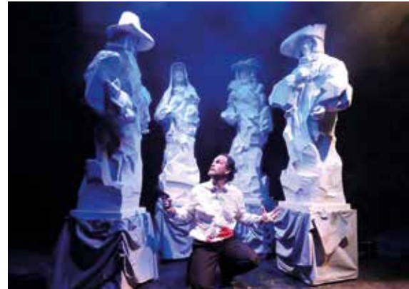
▲ Una versión vanguardista del Don Juan.

PEQUEÑO TEATRO, AV. BAUNATAL, 18 VIERNES, 17 NOVIEMBRE // 20,30 HORAS 10 EUROS, PRECIO ÚNICO // 60 MIN. APROX