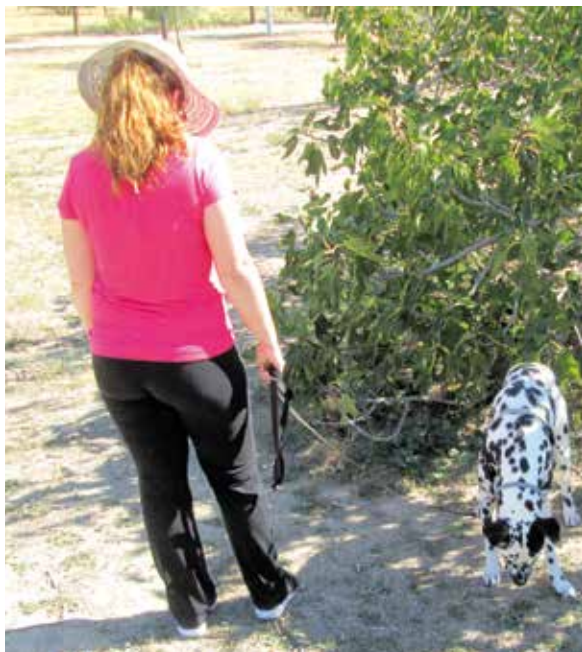
▲ Los animales de compañía, una responsabilidad de todos.

Son numerosas las intervenciones realizadas por la Policía Local relacionadas con la Ordenanza Reguladora de la Tenencia y Protección Animal. Lo que, en un principio, por el incumplimiento de la normativa termina en una simple sanción, puede concluir judicializado por un incidente con uno o varios perros, con reyertas, lesiones, caídas y enfrentamientos entre el propietario y el afectado.