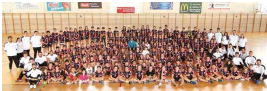
▲ Foto de familia con los colegios del club.

es una iniciativa del Club Balonmano San Sebastián de los Reyes para generar recursos económicos e involucrar al tejido social y económico de nuestra entidad en estos aspectos. El proyecto consiste en la "venta" de pegatinas de "Comercio Amigo" a empresas, comercios, autónomos, franquiciadores e incluso personas físicas que quieren unirse e identificarse con el proyecto de una forma sencilla y vinculada a los deportistas de la entidad.