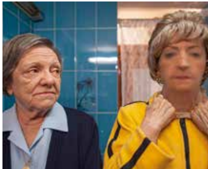
▲ ‘Ni una sola línea’, de Víctor E.D. Somoza.

está en gran batalla, en otro tiempo, en otra galaxia, en otro universo. (15 min.)