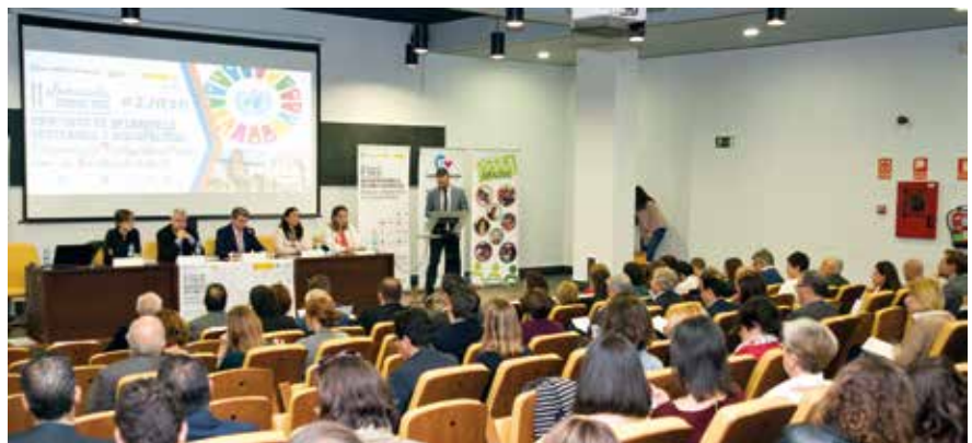
▲ Fotografía de Ángel Moreno, 'Imagen en Acción'.

El final del evento ha corrido a cargo de