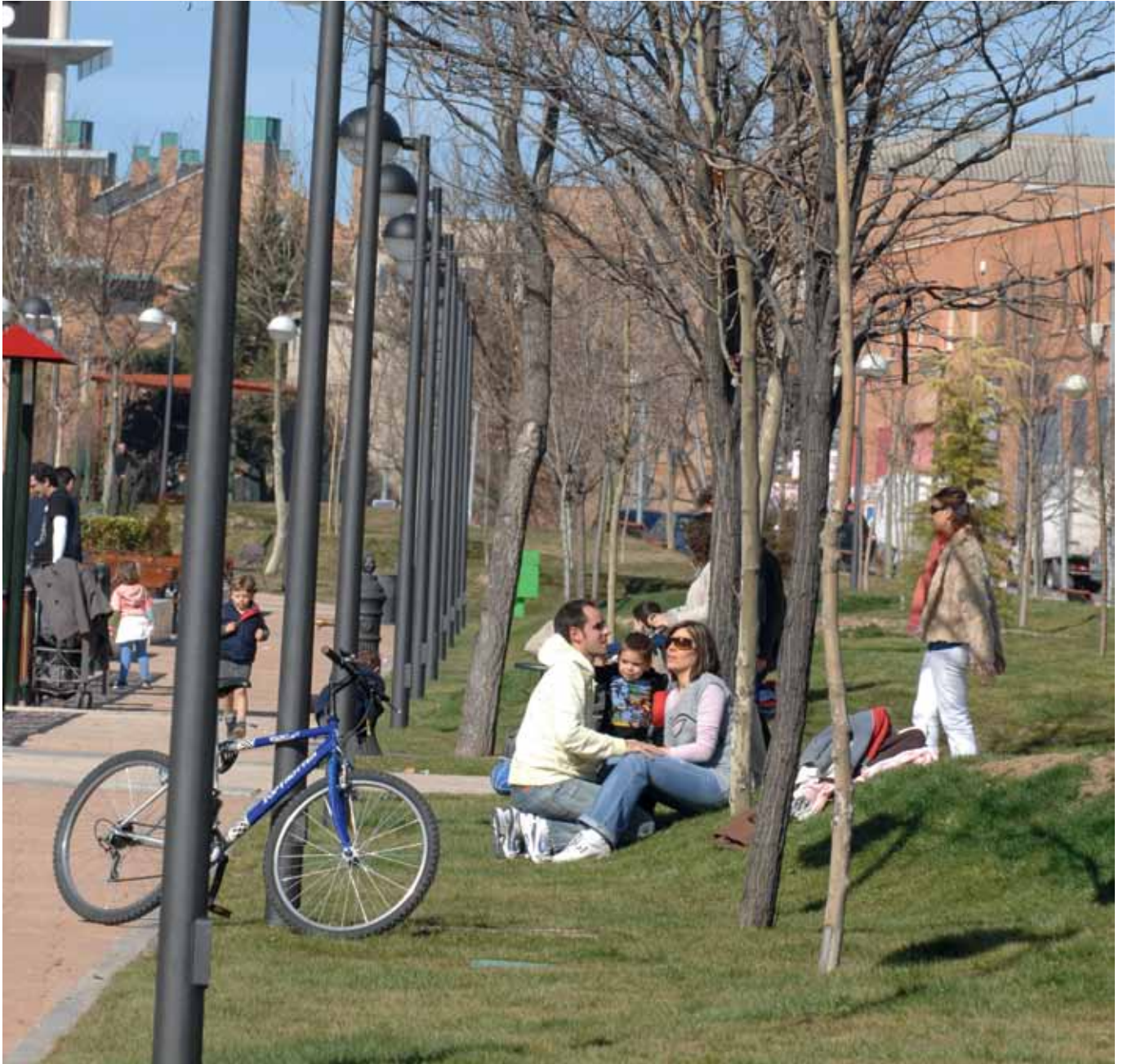
La remodelación incluye el repintado y la reparación de 36 farolas. El nuevo espacio reforzará el bienestar de los vecinos de la zona.

gración en el nuevo tras su remodelación, reforzando los espacios de sombra con nue-