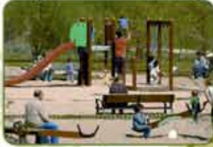
Parque Infantil Dehesa Vieja