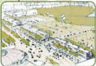
Parque de la Marina