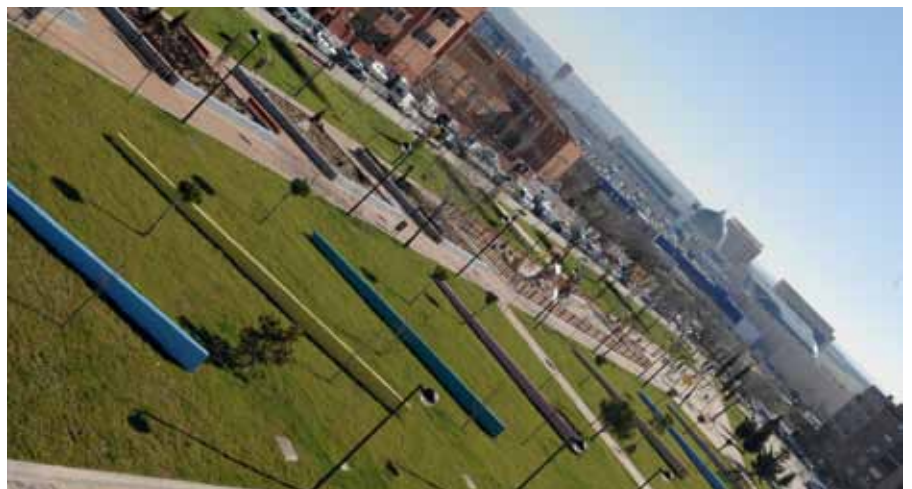
Vista panorámica del parque tal como ha quedado después de la remodelación emprendida.