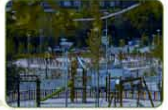
Avda. Reyes Católicos