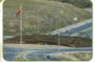
Parque Fuente Santa