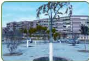
Rotonda "La Fuente"