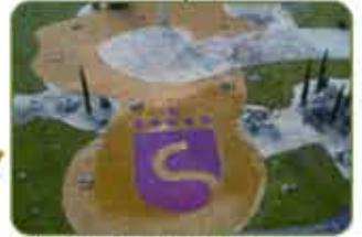
Rotonda Monumento Victimas del Terrorismo