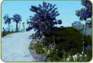
Parque Dehesa Vieja