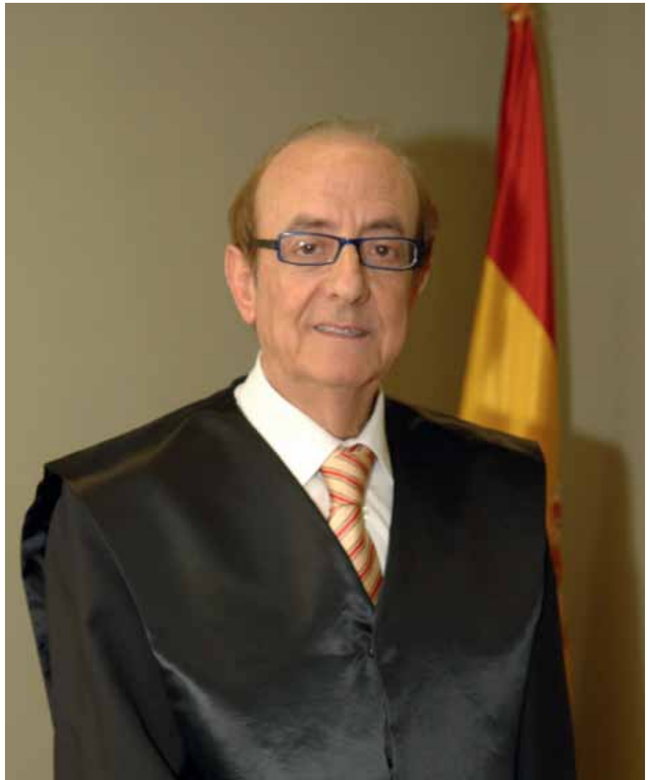
El Jefe de Paz de San Sebastián de los Reyes vino a nuestro municipio en el año 1963 y se ha quedado aquí para siempre.

Creo que se ha profesionalizado mucho. Tengo un bonito recuerdo de aquellos años. Yo formaba parte de UCD. La verdad es que estábamos en pañales pero con una gran ilusión. Queríamos hacer muchas cosas en muy poco tiempo.