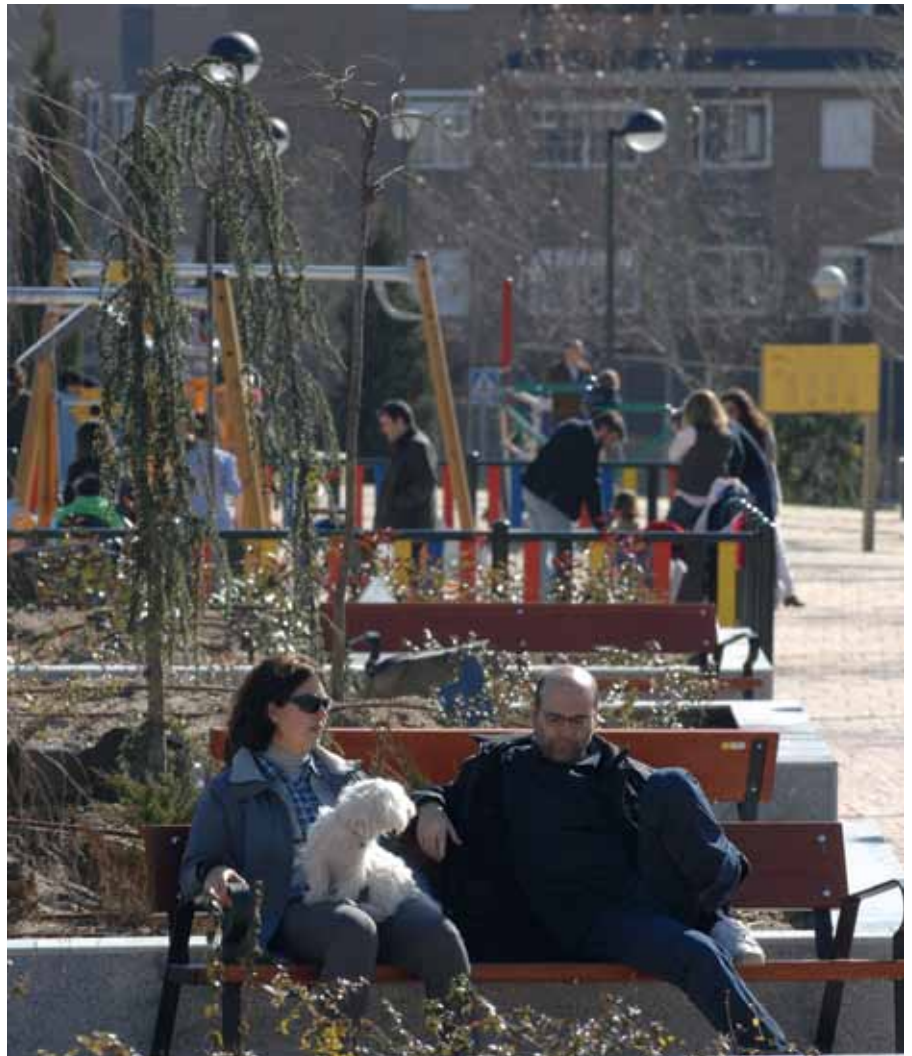
Se han instalado 22 papeleras nuevas, 17 bancos, dos fuentes de agua potable para refrescarse y se ha creado un sistema de riego automático.