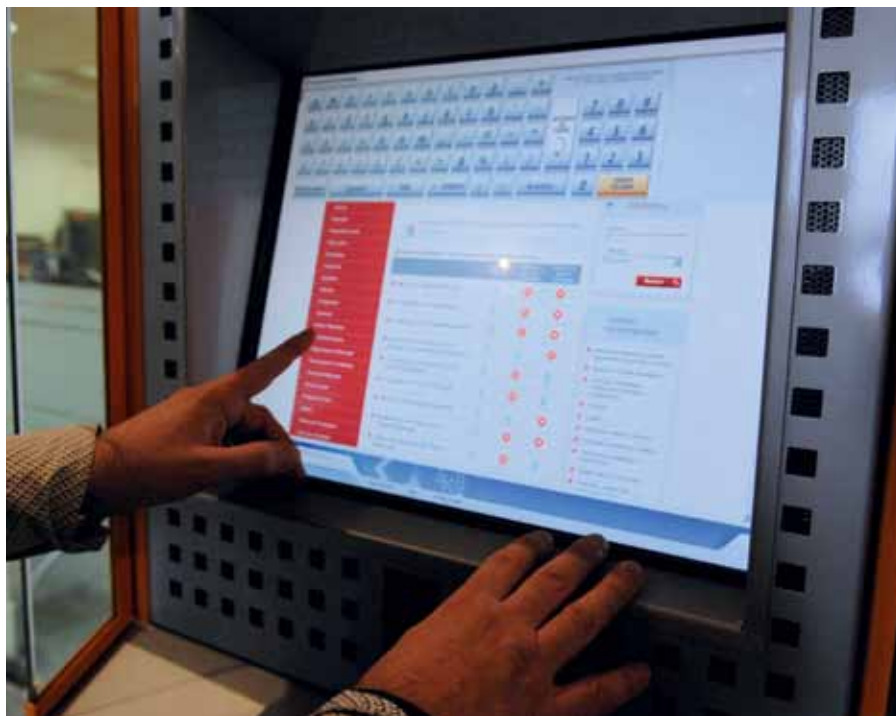
Esta nueva herramienta agilizará los trámites de los vecinos y vecinas cómodamente, desde casa.

Cada ciudadano de San Sebastián de los Reyes cuenta ya con la posibilidad de disponer de un espacio electrónico personal para efectuar los trámites municipales desde su domicilio. La nueva herramienta desarrollada por el Ayuntamiento, concretamente por la Concejalía de Nuevas Tecnologías, está integrada en la web municipal –ssreyes.org- y amplía el número de los trámites en línea.