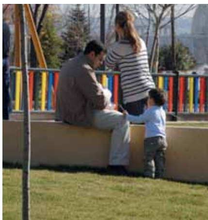
El parque ofrece también un área infantil de 225 metros cuadrados, en el que se han instalado nueve elementos de juegos rodeados de una valla perimetral de seguridad de diversos colores.

vas plantas para la creación de masas arbóreas", matiza el concejal. Además, se han creado en el parque 12 medias lunas elevadas en el césped. La remodelación incluye