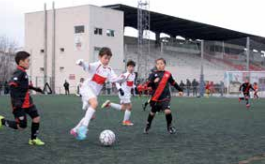
Los futbolistas pusieron al mal tiempo buena cara.

N i la lluvia, ni el viento, ni el frío pudieron con la ilusión de los 48 equipos de las categorías prebenjamín, benjamín y alevín que participaron en la primera edición del Torneo de Navidad que organizó la Unión Deportiva San Sebastián de los Reyes entre el viernes 3 y el domingo 5 de enero. El torneo fue un éxito en lo deportivo, con más de 400 emergentes futbolistas de 15 clu-