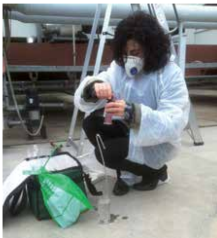
Las inspecciones periódicas son importantes para prevenir enfermedades como la Legionelosis.

Un total de 80 técnicos de la Dirección General de Ordenación e Inspección participan en este programa de control, que prevé un total de 3246 inspecciones durante el año 2014. "Gracias a estas inspecciones, Madrid se encuentra por debajo de la media nacio-