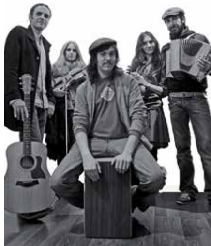
'Martina quiere bailar', un grupo de influencia ecléctica de reciente creación.