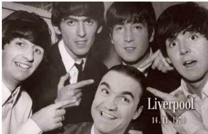
La Muestra 'Sanse, cortos en abierto', el viernes 17 a las 21 h. Entrada libre.