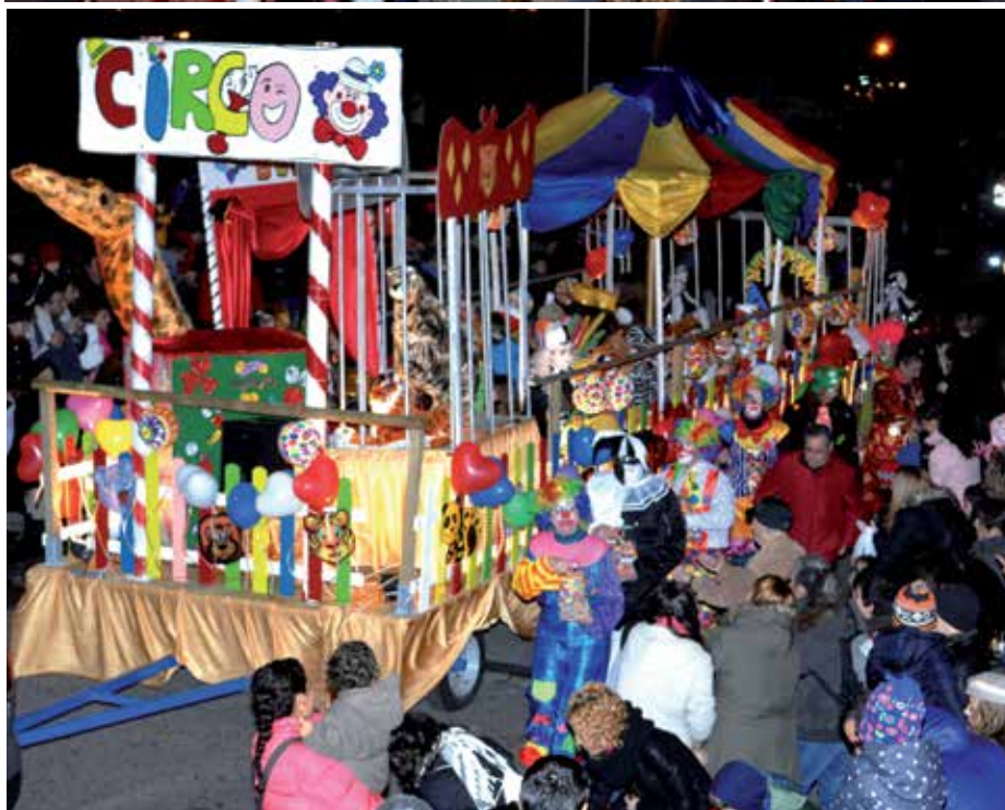
Los personajes entrañables de Walt Disney, el circo... grandes y pequeños disfrutaron de la mágica comitiva real.