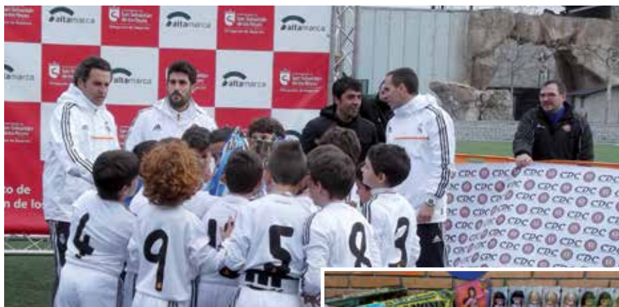
El Real Madrid ganó esta competición donde se recaudaron casi 400 juguetes para los más necesitados.

Todos los aficionados y jugadores mostraron su apoyo con la causa "Un Niño un Juguete" y hasta 302 juguetes nuevos y 90 usados fueron recepcionados en las instalaciones de Dehesa