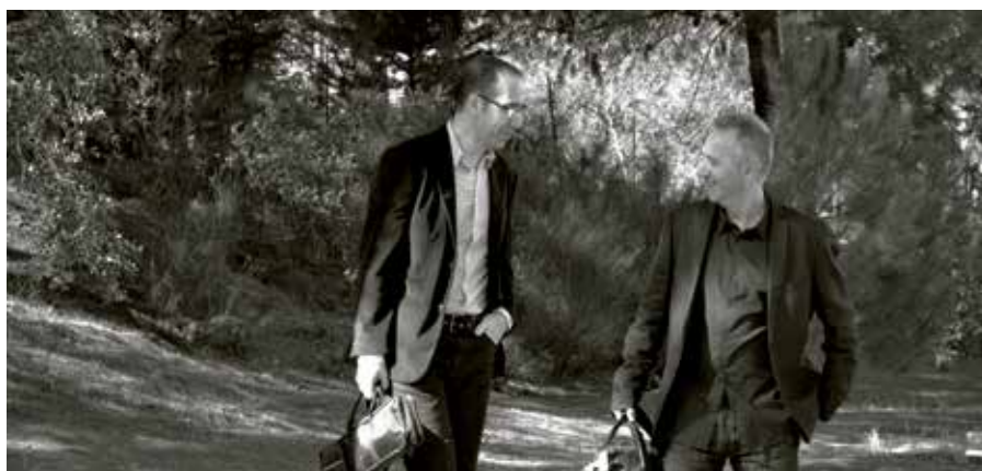
La Musgaña llevan más de 25 años interpretando música tradicional de la meseta.

Del 7 de febrero al 23 de mayo se va desarrollar el XVII Ciclo de los Viernes de la Tradición, organizado por la Universidad Popular José Hierro. Como es habitual, todas las actuaciones tendrán lugar en el edificio El Caserón los viernes señalados y la entrada será libre hasta completar el aforo.