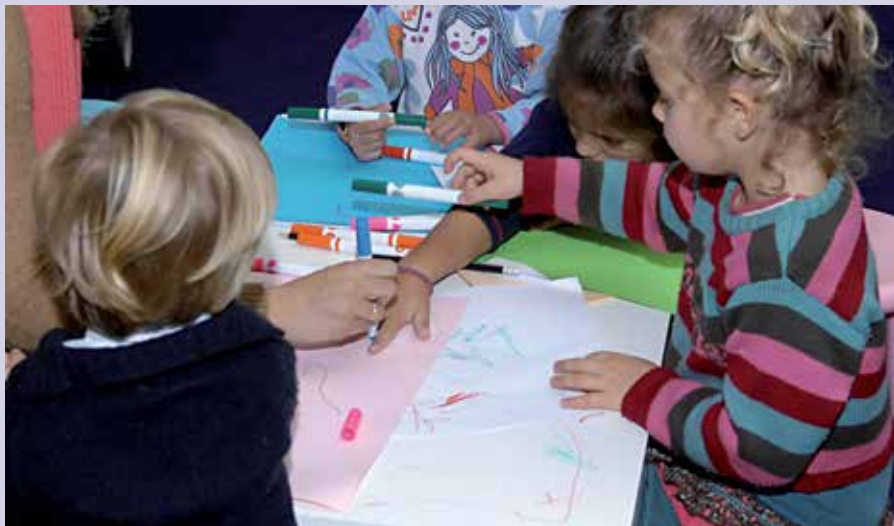
En la Diverteca los niños pasan un buen rato además de aprender.

L a Diverteca es un espacio donde los niños nacidos entre los años 2006 y 2010 pueden acudir a pasar un buen rato mientras se divierten con los juegos, talleres y otras actividades. La Diverteca del Centro Cívico de Barrio Los Arroyos (Paseo de Guadalajara, 5) abre los martes y jueves y la Diverteca del Centro Socio-cultural Club de Campo (c/ Federico Chueca, s/n) lo hace los lunes y miércoles. En ambos casos el horario es de 17:30 horas a 19:30 horas, con una flexibilidad de 15 minutos a la entrada y la salida y con la posibilidad de entrar o salir también a las 18:30 horas. Se recomienda que los niños acudan desde el inicio hasta el final de la sesión para así poder disfrutar al máximo de las actividades y completar los talleres y dinámicas que se realicen.