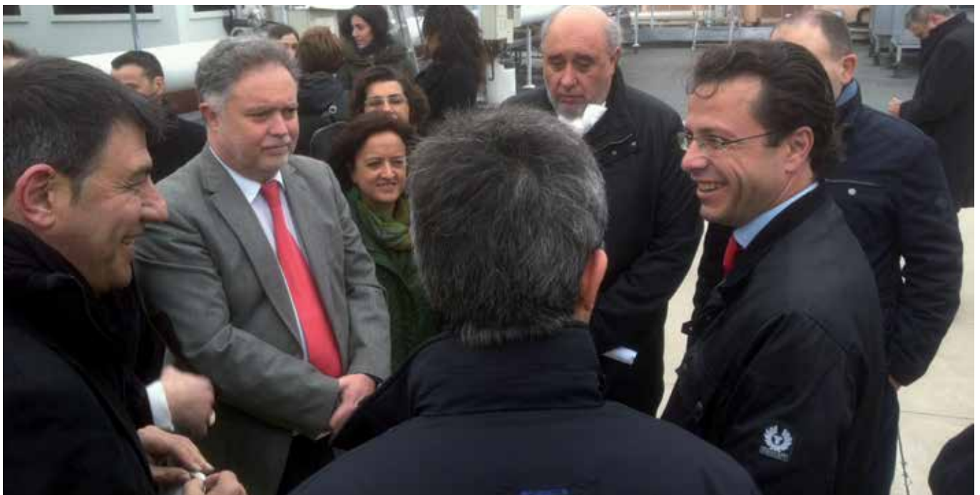
El alcalde y el consejero de Sanidad atienden a las explicaciones de los técnicos durante la visita.