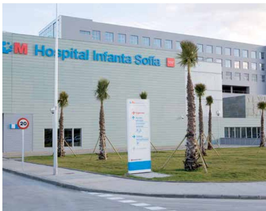
El Hospital Infanta Sofía, un ejemplo de sostenibilidad medioambiental.

El Hospital Universitario Infanta Sofía es el primer hospital de España en conseguir la certificación Breeam por su gestión medioambiental, gracias al conjunto de actuaciones de mejora llevadas a cabo durante el año pasado. El Sistema Breeam (BRE Environmental Assessment Method) es el método de evaluación medioambiental de mayor aplicación en todo el mundo.