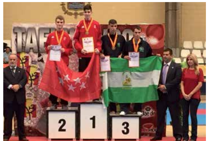
El taekwondista sansero en lo más alto del pódium.

El taekwondista de la Escuela de Taekwondo 'Jesús Tortosa' y vecino de Sanse ha logrado la medalla de oro en el Campeonato de España Junior de Taekwondo disputado el 26 de septiembre en Alicante. Para subir a lo más alto del pódium tuvo que vencer a los