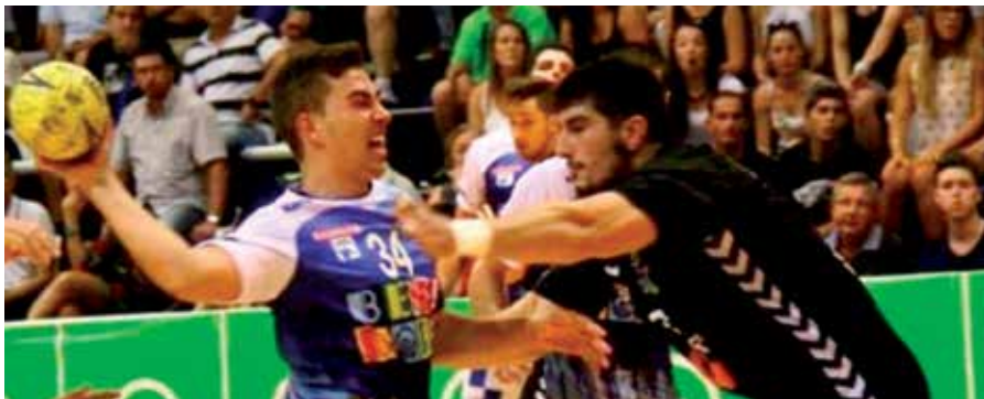
El jugador de Sanse en una acción de juego con su nuevo equipo.

El joven central se ha formado en la escuela del Club Balonmano San Sebastián de los Reyes, primeramente en la escuela del colegio Buero Vallejo, para más tarde incorporarse a las categorías inferiores del Club, con el que ha llegado a disputar tres fases finales de Campeonato de España. Aunque tiene ficha en el equipo filial, ya ha disputado los cinco primeros partidos en la Liga ASOBAL, y ha estrenado su casillero goleador con 4 tantos en