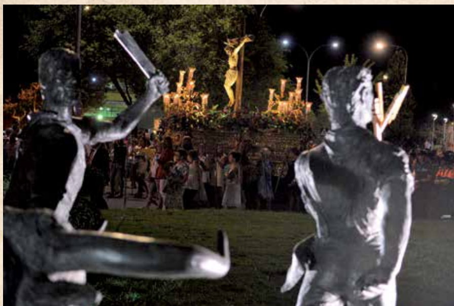
Procesión del Santísimo Cristo de los Remedios.