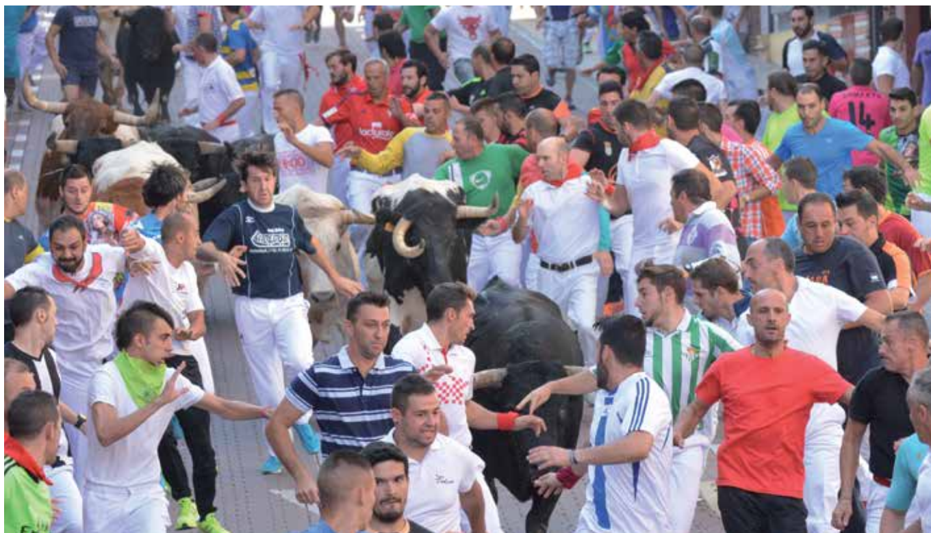
El conjunto de espectáculos taurinos supuso un coste de 307.266,32 euros, lejos de los ingresos que reportan los Encierros Tradicionales a nuestra ciudad.

Por primera vez en democracia, el Ayuntamiento publica el coste de las Fiestas en Honor al Santísimo Cristo de los Remedios; cumpliendo así el compromiso de transparencia que adquirió el nuevo equipo de Gobierno municipal. En total, las fiestas supusieron a las arcas municipales un gasto de 970.731,18 euros.