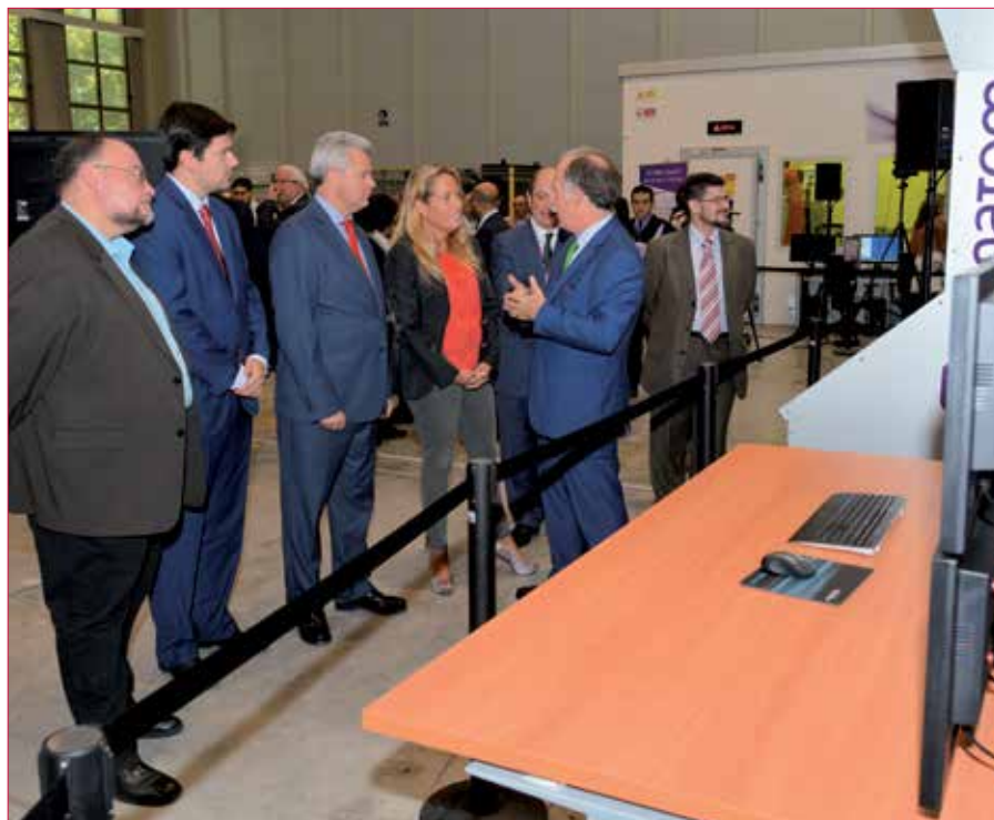
El alcalde (tercero por la izquierda) con representantes municipales y de la empresa de seguridad nuclear.

La empresa de ingeniería española Tecnatom, especializada en garantizar la operación y el mantenimiento de las centrales nucleares con los más altos niveles de seguridad, ha ampliado sus instalaciones en nuestra ciudad. Estas nuevas instalaciones, en total 8.000 m 2 , albergan los desarrollos tecnológicos y procesos de fabricación.