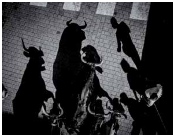
'Sombras a media mañana', fotografía ganadora del concurso.

En esta edición, organizada por la Asociación Cultural El Encierro, se han presentado 103 obras, correspondientes a 23 fotógrafos procedentes de diversas partes de España. Una muestra de los trabajos presentados se expondrá en la sala de exposiciones de la Biblioteca Central -situada en la Plaza de Andrés Caballero, junto al monumento a los encierros-, entre el 20 de octubre y el 20 de noviembre.