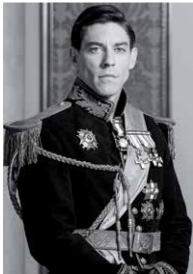
'El discurso del Rey', el sábado 24 en el TAM.