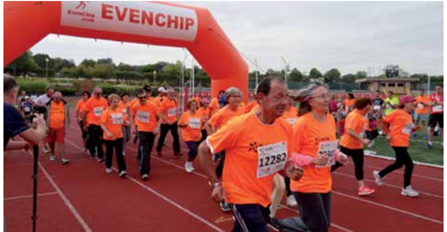
Momento de la salida de una de las pruebas en la pista de atletismo del Dehesa Boyal.

La iniciativa ha sido organizada por la asociación 'Alcosse Parkinson' y el Ayuntamiento, a través de las Concejalías de Deportes y de Participación Ciudadana, en el marco de la convocatoria global 'Run for Parkinson. Aunque llovió a primera hora y hubo que reestructurar aspectos organizativos, al final todo salió muy bien. Desde 'Alcosse Parkinson' han manifestado su satisfacción con la repercusión y participación en la prueba, que contó con más de cien corredores en total, distribuidos en varias categorías.