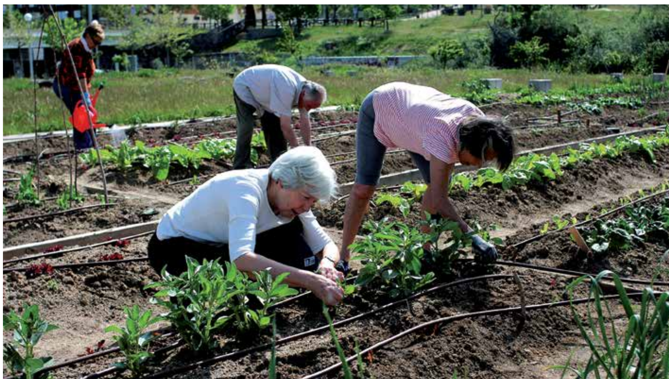
Todas las parcelas están dotadas de tomas de agua y electricidad. Se ceden a los vecinos mayores de 18 años y asociaciones.

La Junta de Gobierno Local aprobó las bases para la adjudicación de 45 parcelas para el cultivo agrícola destinado al consumo privado. A esta adjudicación, inscrita en el marco del proyecto municipal 'Huertos urbanos de Tempranales', podrán concurrir vecinos particulares y asociaciones del municipio.