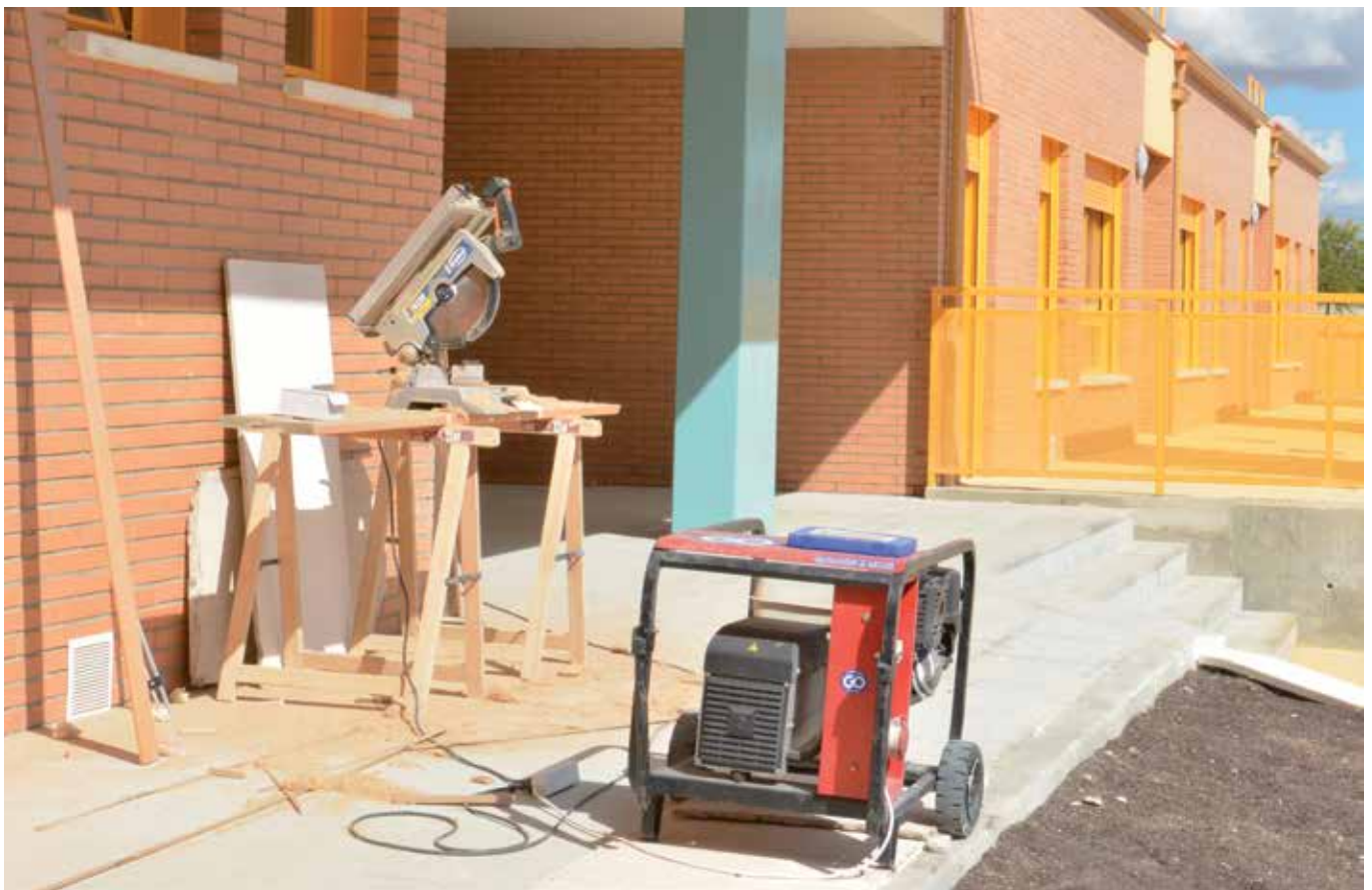
Esta fotografía, tomada el día 8 de octubre de 2015, acredita que aún se trabaja en las obras del colegio.