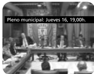
Pleno municipal: Jueves 16, 19,00h.

15,00 EL AYUNTAMIENTO INFORMA 15,30 SECUENCIA ZERO 16,00 PLENO MUNICIPAL ORDINARIO 17,35 EL SANTO 18,25 MEDITERRÁNEO 19,30 TU ALCALDE RESPONDE 20,00 EL AYUNTAMIENTO INFORMA 20,30 SECUENCIA ZERO 21,00 BAUL 47 21,20 EL AVENTURERO 21,45 QUERIDO MAESTRO 22,45 POST-DATA 23,15 ZOOMBADOS 23,40 Cine: LA MUJER TRAS LA PUERTA