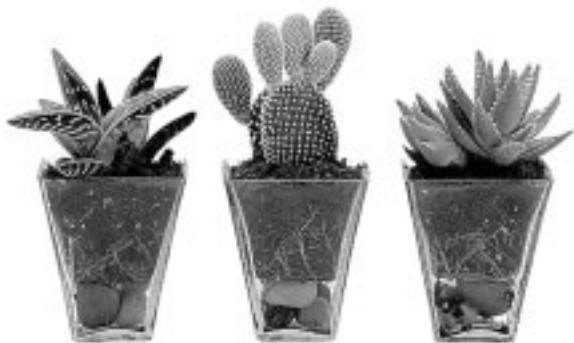
Artículos de comercio justo de Intermon Oxfam

alternativa idónea. Su catálogo de productos ha ido en incremento con el paso del tiempo y puede ofrecer un amplio surtido del sector de la alimentación, el textil, la juguetería didáctica y la papelería ecológica y de reciclado.