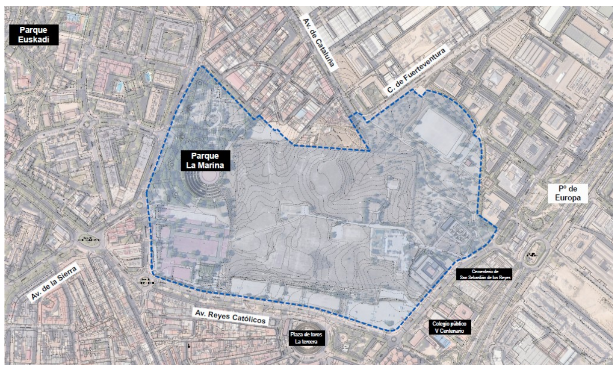
Fig. 1 Vista aérea del ámbito del PE

La superficie total del ámbito, medida sobre la cartografía base municipal, es de 299.319,2 m 2 .