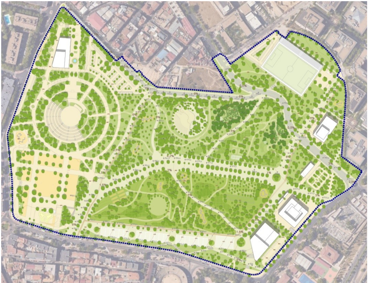
Fig. 5. Detalle del Plano PO.12 – Imagen de la ordenación.

Los elementos de la infraestructura verde son las unidades funcionales de la red estratégicamente planificada de espacios naturales y seminaturales y otros elementos ambientales diseñados y gestionados para ofrecer una amplia gama de contribuciones de la naturaleza a las personas y procesos ecosistémicos. Se definen tres categorías: