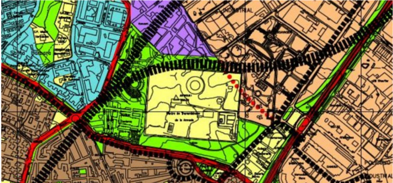
Fig. 2 Imagen del PGOUSS 01. Plano de Elementos de la Estructura Orgánica del Territorio

articula una conexión directa entre la Avenida de Cataluña y el Paseo de Europa para la mejora de la accesibilidad a la trama urbana consolidada al norte del ámbito y una mejora de la relación entre barrios.